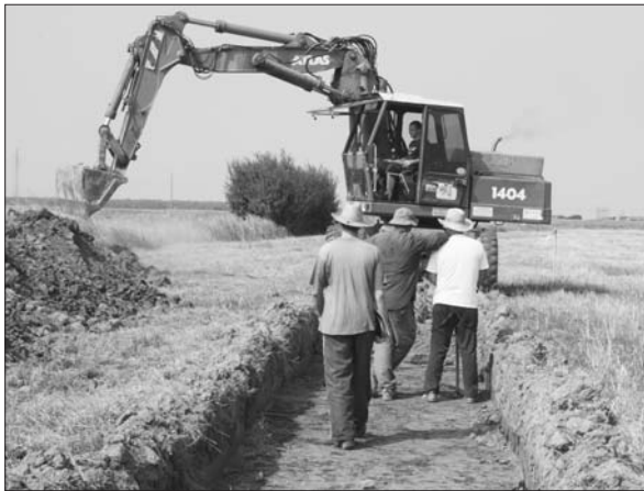
Sl. 2 Iskop probnog rova.

Fig. 2 A trial-trench.