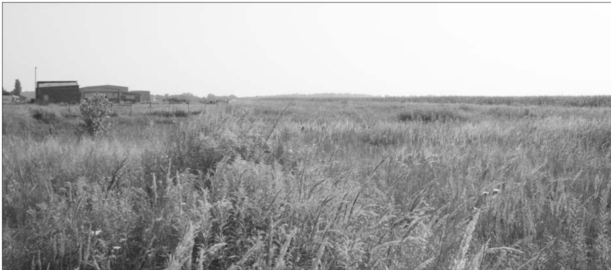
Sl. 3 AN 5 Donji Miholjac–Janjevci.

Buduća zaštitna istraživanja nalazišta AN 3 Donji Miholjac–Mlaka/Trafostanica i AN 5 Donji Miholjac–Janjevci na kojima su zabilježeni površinski nalazi iz svih razdoblja, omogućit će prikupljanje novih spoznaja o naseljenosti prostora Donjeg Miholjca koje se nalazi na važnom komunikacijskom pravcu koji je vodio nizinom rijeke Drave i kojim se ostvarivala povezanost jugoistočnoalpskog prostora s Podunavljem. Isto tako, iskopavanja većih površina nalazišta, posebno AN 3, omogućiti će prikupljanje podataka o infrastrukturi prapovijesnih naselja na dosad arheološki slabo istraženom području Donjeg Miholjca.