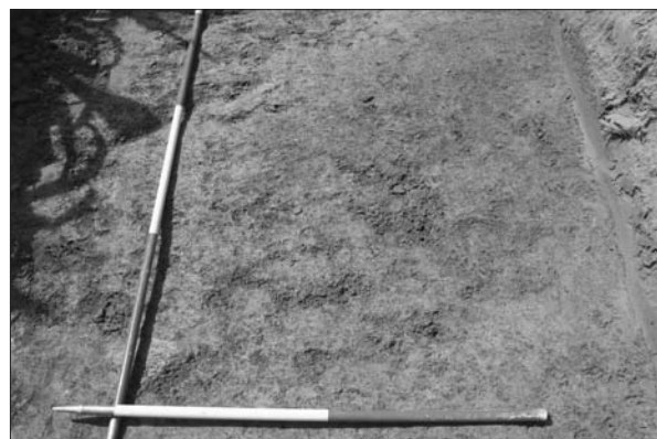
Sl. 5 Zapuna jame iz kasnog brončanog doba na AN 5 Velimirovac – Arenda 2. Fig. 5 Pit of Late Bronze Age at AS 5 Velimirovac–Arenda 2.

Još je jedno prapovijesno naselje pronađeno na blagoj, izduženoj uzvisini smještenoj u ravničarskom području sjeverno od Našičke rijeke i nalazišta na Staroj Branjevini. Na površini oranice prikupljeni su keramički i kameni nalazi, dok su u probnim iskopima izdvojene zapune objekata s ulomcima posuda i kućnim lijevom. Izdvojena je zapuna velike zemunice uz koju se nalaze i manje jame ovalnog oblika (sl. 4). Prikupljene spoznaje ukazuju na postojanje naselja starčevačke kulture, čime se novootkriveno nalazište AN 4 Velimirovac–Arenda 1 svrstava među neka od najstarijih na području Našica. Probna iskopavanja potvrdila su tako pretpostavke o postojanju neolitičkog naselja koje je pronađeno u terenskom pregledu trase magistralnog plinovoda Donji Miholjac–Slobodnica (Dizdar, Ložnjak Dizdar 2009: 136–138, nal. red. br. 17 Arenda) čija su zaštitna istraživanja provedena 2009. godine prilikom izgradnje spomenutog plinovoda. Prilikom navedenog terenskog pregleda na zapadnom dijelu uzvisine pronađeni su i nalazi iz kasnog brončanog doba, odnosno virovitičke grupe te srednjeg vijeka (Dizdar, Ložnjak Dizdar 2009: 136). Ipak, u probnom iskopu na trasi obilaznice