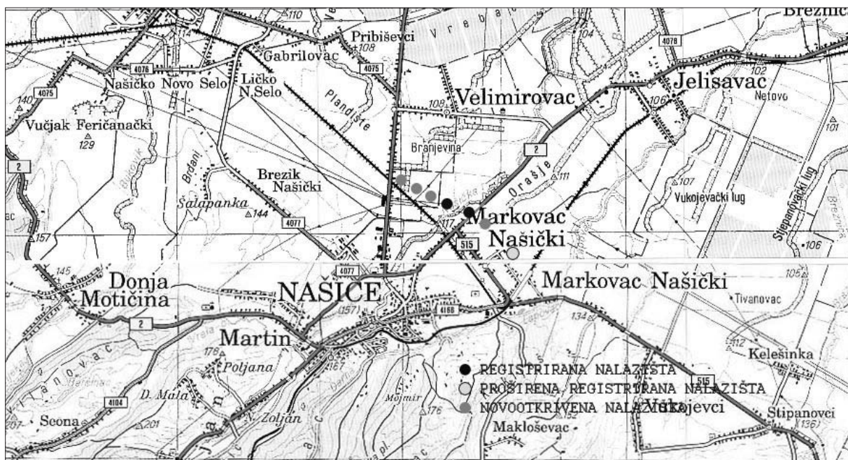
Sl. 1 Arheološka nalazišta na trasi državne ceste D-2 – obilaznica Našica.

Ključne riječi: probna iskopavanja, Našice, prapovijest, srednji vijek, naselja, infrastruktura Key words: trial excavations, Našice, prehistory, Middle Ages, settlements, infrastructure