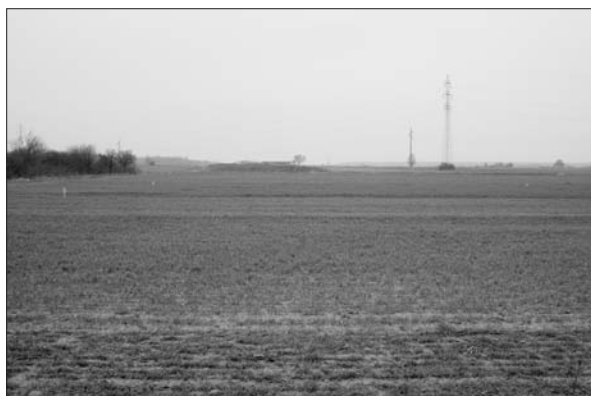
Sl. 3 AN 2a Markovac Našički – Orašje 2 (snimio: D. Strešnjak). Fig. 3 AS 2a Markovac Našički–Orašje 2 (photo: D. Strešnjak).

Probna iskopavanja potvrdila su položaje od prije poznatih arheoloških nalazišta AN 1 Markovac Našički–Male Livadke, AN 2 Markovac Našički–Orašje i AN 3 Markovac Našički–Stara Branjevina (Minichreiter, Marković 2004: 58–59). Za kasnosrednjovjekovno naselje AN 1 Markovac Našički–Male Livadke probni iskop pokazao je kako je nalazište potrebno proširiti za oko 150 m prema sjeveru. Radi se o izduženom blagom uzvišenju smještenom uz nekadašnji manji vodotok kojeg trasa obilaznice presijeca u sjevernoj polovici. Isto tako, probni iskop pokazao je kako je potrebno proširiti i AN 2 Markovac Našički–Orašje koje je položeno na povišenom položaju s južne strane Našičke rijeke. Na nalazištu su zabilježeni kasnosrednjovjekovni nalazi, dok oni iz mlađeg željeznog doba nisu izdvojeni. S nepromijenjenom površinom istraživanja ostalo je AN 3 Markovac–Našički–Stara Branjevina koje se nalazi sa sjeverne strane Našičke rijeke na kojem su, osim brojnih kasnosrednjovjekovnih nalaza, zabilježeni i dotad nepoznati keramički ulomci iz mlađeg željeznog doba. S obzirom na prostornu bliskost i istovremenost, kasnosrednjovjekovna naselja na položajima Orašje i Stara Branjevina vjerojatno predstavljaju dio većeg naseobinskog sklopa smještenog na blagim uzvišenjima uz vijugavi tok Našičke rijeke.