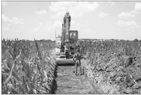
Sl. 2 Iskop probnog rova na AN 4. Fig. 2 Trial-trench at AS 4.

probni iskop po središnjoj osi na dijelovima trase obilaznice na kojima nisu bila zabilježena nalazišta kako bi se definirala površina istraživanja od prije poznatih nalazišta te provjerilo moguće postojanje drugih, dosad nepoznatih nalazišta (sl. 2). Na osnovi probnih iskopavanja i arheološkog nadzora, površina predviđena za istraživanja pojedinih od prije registriranih nalazišta je povećana, no otkrivena su i četiri nova, dosad nepoznata nalazišta koja su označena za buduća zaštitna arheološka istraživanja kako bi se prikupile nove spoznaje i nalazi o prapovijesnim i srednjovjekovnim naseljima na našičkom području (sl. 1).