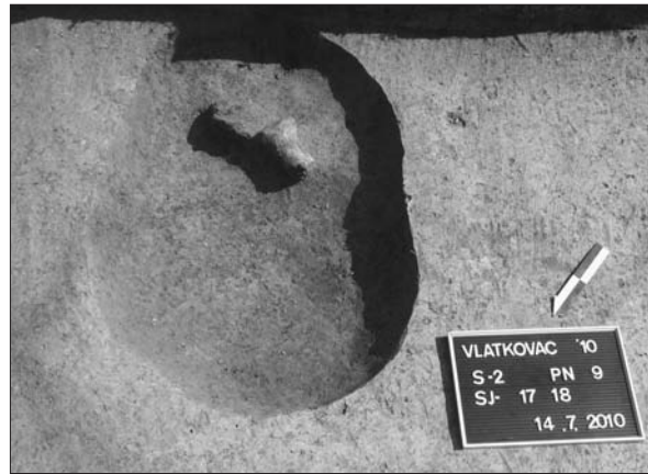
Sl. 5 Noga posude u zapuni jame SJ 18.

Fig. 4 Lasinja culture beaker in pit SU 9 fill.