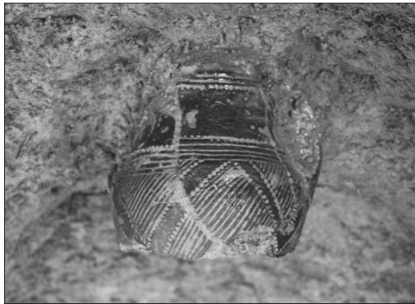
Sl. 4 Vrč lasinjske kulture u zapuni jame SJ 9.

Fig. 4 Lasinja culture beaker in pit SU 9 fill.