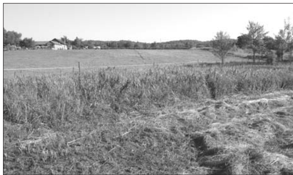
Sl. 2 Pogled iz smjera rijeke Londže na uzvišenje na kojem je smješteno nalazište u Vlatkovcu.

U pokusnim iskopavanjima ostaci kasnobrončanodobnih grobova nisu zabilježeni, na što je utjecala manja površina iskopavanja kao i spoznaja kako nije bilo moguće istražiti površinu na kojoj su ranije bili prikupljeni ulomci keramičkih posuda koje su pokrivala spaljene ostatke pokojnika. Ipak, površinski nalazi i prikupljene spoznaje ukazuju da se radi o plitko ukopanim grobovima koji će se zasigurno otkriti u sljedećim istraživanjima u kojima će se ispitati veće površine nalazišta. S prostora Požeške kotline nalazi kasnobrončanodobnih grobova spominju se u Požegi (Sokač Štimac 1976: 45), Zrilcu (Minichreiter 1984: 84–85) i Grabarju (Sokač Štimac 1984: 129–130), dok je broj istovremenih naselja nešto veći (Potrebeca, Ložnjak 2002: 10), kojima vjerojatno pripada i spomenuto nalazište u Zrilcu. Osim slučajnih nalaza iz Mitrovca i Vetova (Vinski Gasparini 1973: T. 17: 13; T. 16: 7; Potrebeca, Ložnjak Dizdar 2004), poznat je i nalaz ostave II. faze kulture polja sa žarama u nedalekoj