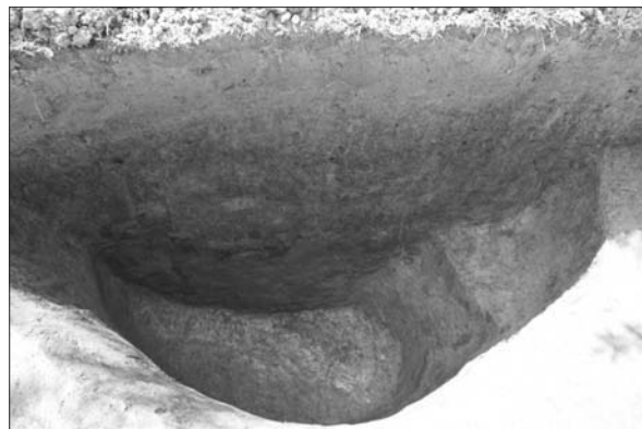
Sl. 3 Presjek zapune jame SJ 22.

Fig. 2 View of the elevation on which the Vlatkovac site is located from the River Londža.