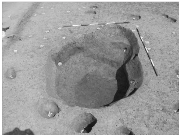
Sl. 2 Slavonski Brod, Galovo, jama 2010.

Fig. 2 Slavonski Brod, Galovo, pit 2010.