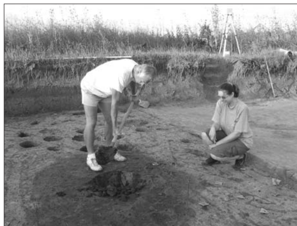
Sl. 1 Slavonski Brod, Galovo, početak istraživanja jame 2010.

Jugozapadno od zemunice 2012 otkrivena je i istražena u cijelosti jama 2010 koja je po svojem obliku i inventaru u njoj