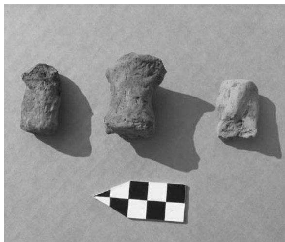
Sl. 5 Slavonski Brod, Galovo, noge žrtvenika i dio idola.

Fig. 4 Slavonski Brod, Galovo, shards of coarse and fine pottery.