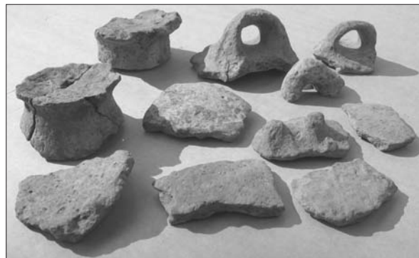
Sl. 4 Slavonski Brod, Galovo, ulomci grube i fine keramike.

Fig. 3 Slavonski Brod, Galovo, shards of vessels at the bottom of pit 2010.