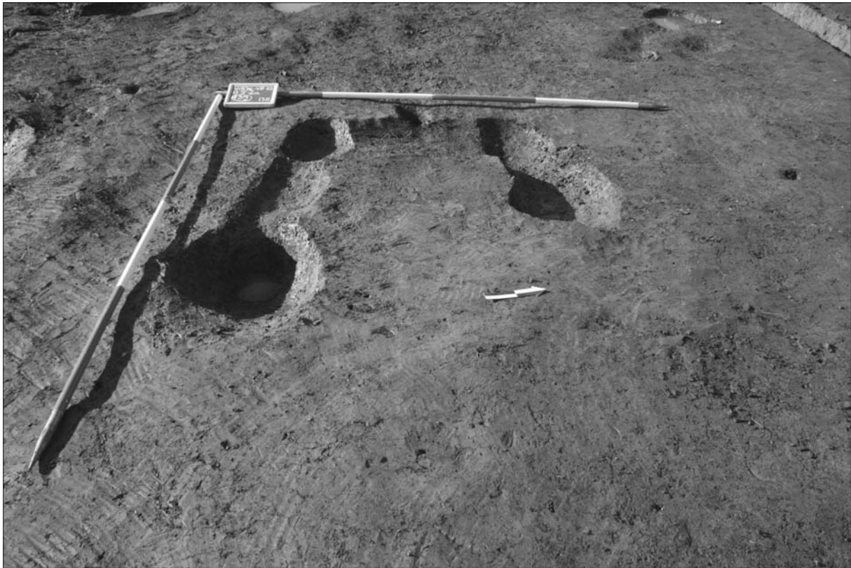
Sl. 2 Ostaci cjeline SJ 138/139-sjever i SJ 138/139-jug tijekom istraživanja.