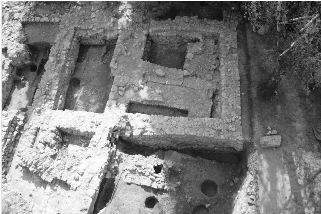
Sl. 1 Pogled na ostatke romaničke crkve ispod sjeverne kule tijekom istraživanja.