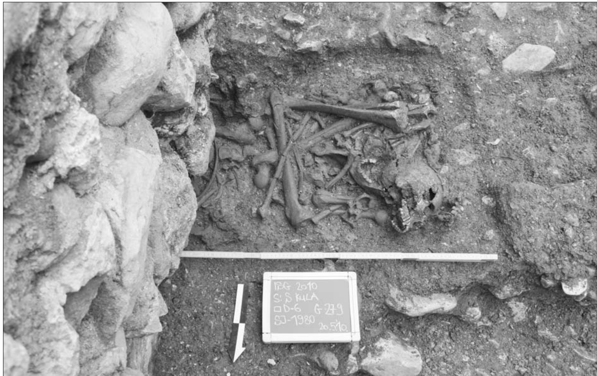
Sl. 3 Grob 279 s posmrtnim ostacima sahranjenima u okovanom sanduku.