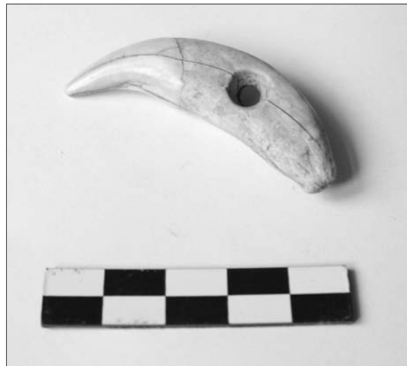
Sl. 2 Životinjski zub – amulet.

Posljednji istraženi grob u ovom sektoru je grob 279 čiju pripadnost najstarijoj fazi možemo samo pretpostaviti. Riječ je o svojevrsnoj kosturnici u kojoj su vjerojatno sahranjene kosti