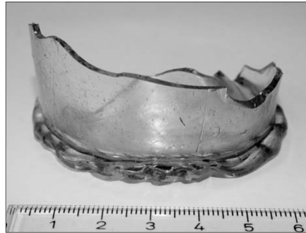
Sl. 2 Ulomak dna staklene čaše.

Ispod SJ 176 nalazio se SJ 182 – sloj žuto-svjetlosmeđe-narančaste malteraste šute sa sitnim oštrobriđnim kamenjem. To je ustvari nasip trusnog kamena živca, unutar kojeg je zamijećena i mrlja crvene paljevine, nazvana SJ 180A. SJ 180 leži na živcu. Njegovim uklanjanjem otkriveni su temelji lica obodnog zida SJ 51 gdje se vidi da je ono nemarno rađeno, što nas upućuje na to da su graditelji znali da će taj segment zida biti zatvo-