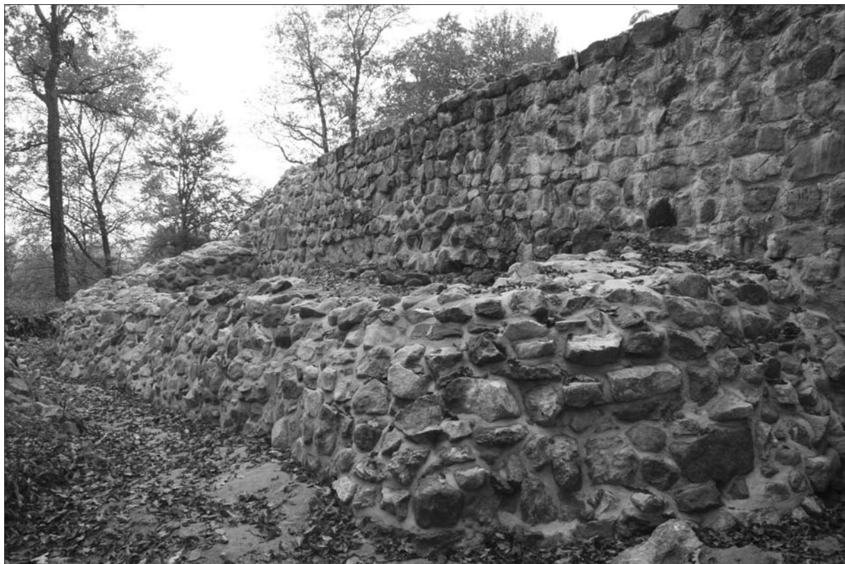
Sl. 3 Konzervirani ostaci temelja aneksiranog ulaznog objekta.

ga. Očuvan je tek segment vanjskog lica zida SJ 177, a ostali su dijelovi urušeni te je i naknadno konzerviran na tim dijelovima kao ruševina (sl. 3). Istraživanja potvrđuju sliku kakvu je dala i analiza arhitektonske plastike s burga – da je u nekom trenutku (još uvijek vrlo rane faze burga, dakle romaničke) na ovome mjestu organiziran prilaz jezgri burga sa sjeverne strane kroz taj zidani uski izduženi objekt na sjeveroistočnoj dijelu lokaliteta