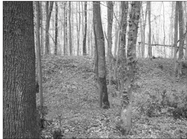
Sl. 2 Gradina u šumi kod Harkanovaca.

Fig. 1 Zelčín hill fort.