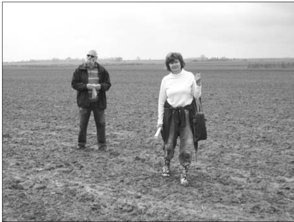
Sl. 3 Terenski pregled zemljišta u Ladimirevcima.

Fig. 3 Field survey of a plot in Ladimirevci.