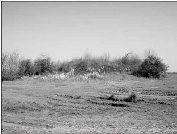
Sl. 1 Zelčinska gradina.

Fig. 1 Zelčín hill fort.