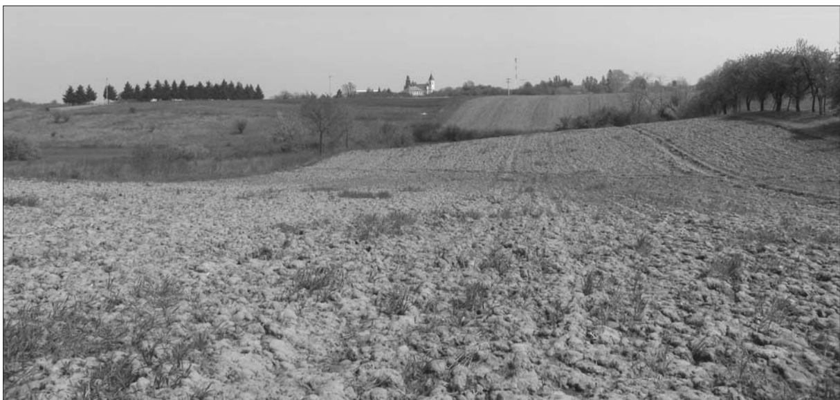
Sl. 3 Podgorač-Đakovac (u prednjem planu) i Barutana II (Grofija), Barutana I, Podrum (u stražnjem planu lijevo).

Lokalitet Barutana II (Grofija) se nalazi jugozapadno od podgoračkog groblja, na zapadnoj padini brežuljka na čijem su platou smješteni lokaliteti Barutana I i Podrum (Bostan). Administrativni naziv ovog zemljišta je Barutana, no uži predio na kojem se lokalitet nalazi u narodu je poznat i pod nazivom Grofija, pod kojim je i objavljen u ranijoj stručnoj literaturi kao: Barutana i Grofija. Poznat je od 1973. g., kada je Z. Marković ovdje prikupio dosta ulomaka srednjovjekovne i novovjekovne (turske) keramike. Ovom je prilikom sakupljena manja količina nalaza. Stare i novoprikupljene nalaze čine ulomci sive, oker i glazirane keramike raščlanjenih i oštih oboda, ukrašeni žlijebljenjem horizontalnih linija, žigosanjem kvadratića, trokutića i polukrugova te crvenim slikanjem na oker gotičkoj keramici. Ranije su pronađena i 2 kamena odbojka. Prema nalazima, lo-