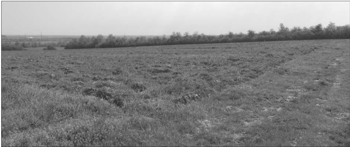
Sl. 1 Podgorač-Razište.