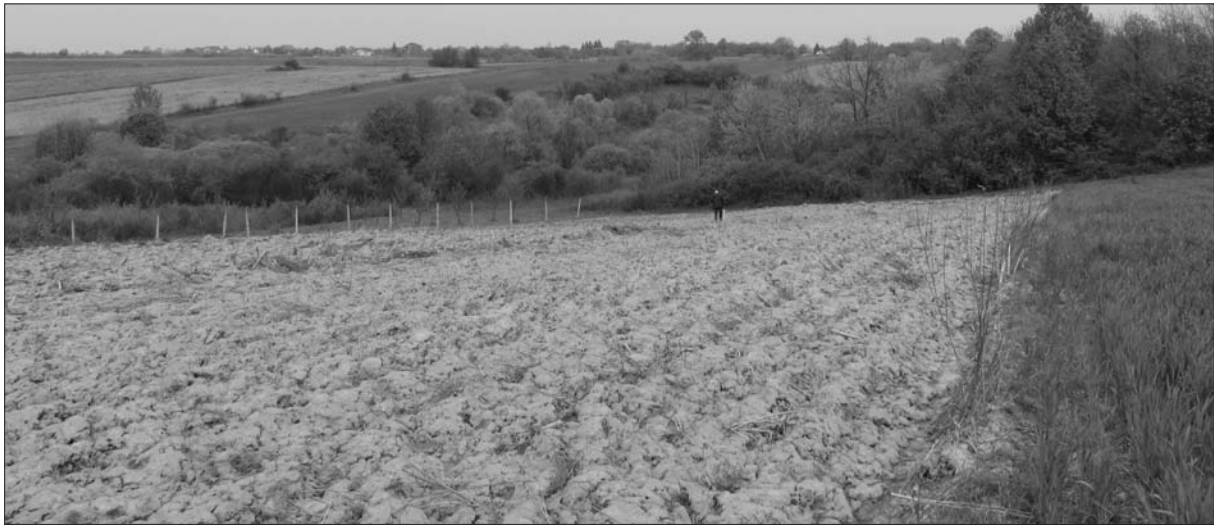
Sl. 2 Podgorač-Maorje (u prednjem planu) i Zečjak (u stražnjem planu lijevo) (snimila: J. Jurković).

Fig. 2 Podgorač-Maorje (in the foreground) and Zečjak (in the background left) (photo: J. Jurković).