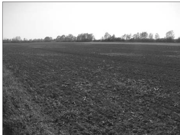
Sl. 7 Terezino polje–Djedovača.

Fig. 6 Virovitica–Kiškorijska with northern Bilogora slopes in the background.