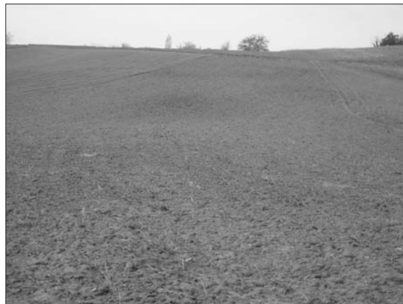
Sl. 5 Mala Pisanica–Grebenska 1, pogled na izolirane jame.

Fig. 4 Velika Pisanica–Selište 6.