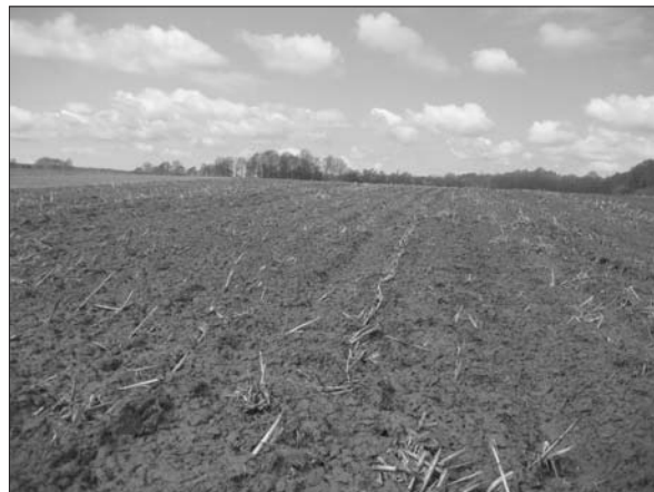
Sl. 3 Obrovnica–Selište.

Fig. 2 Malo Koreново–Vojvodinac 1.