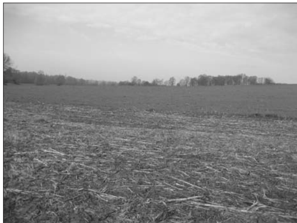
Sl. 4 Velika Pisanica–Selište 6.

Fig. 4 Velika Pisanica–Selište 6.