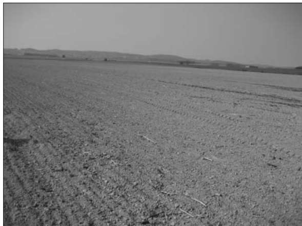
Sl. 6 Virovitica–Kiškorijska sa sjevernim padinama Bilogore u pozadini.

Fig. 6 Virovitica–Kiškorijska with northern Bilogora slopes in the background.