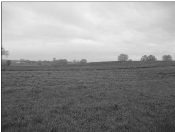
Sl. 2 Malo Koreново–Vojvodinac 1.

Fig. 2 Malo Koreново–Vojvodinac 1.