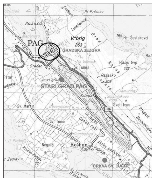
Karta 1 Kulturna dobra na trasi plovnog kanala „Grad Pag – Košljun“.

Baštini kraja pripadaju i bazeni solane, odnosno proizvodnja morske soli, jednog od simbola otoka Paga. Solane su vjerojatno postojale na ovom prostoru već u antičko vrijeme, iako je dokaza za to danas vrlo malo s obzirom na višestoljetnu tradiciju eksploatacije soli, koja seže sigurno već u 8. i 9. st. i