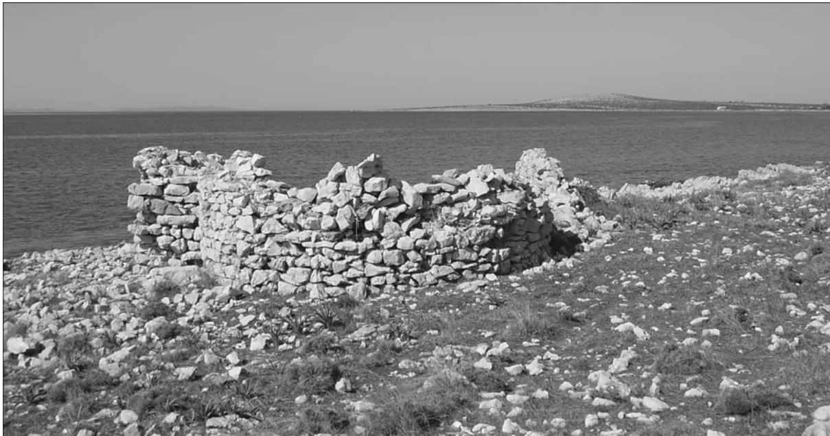
Sl. 2 Crkvice sv. Lucije kod Košljuna.