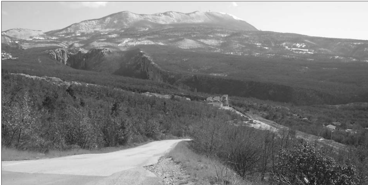
Sl. 3 Pogled na kamenolom Vranja (lijevo) i kanjon Vele drage.

rubu područja pod upravom „Parka prirode Učka“, nekoliko kilometara od izlaza iz tunela uz državnu cestu D500, koja predstavlja sjevernu granicu promatranog područja. Projektom sanacije postepeno bi se prekinula daljnja eksploatacija tehničko-građevnog kamena, a prostor uklopio u okoliš, a potom i u ponudu „Parka prirode Učka“, u skladu s načelima održivog razvoja i ograničenog iskorištavanja resursa u ovoj zoni Parka. Daljnji radovi podrazumijevaju minimalno širenje prostora eksploatacije na zapadni rub postojećeg kamenoloma, budući da se ostavlja zaštitni koridor uz državnu cestu na sjeveru, dok južnu granicu čini pruga i dalje zaseok Baričevići (Barića selo), a istočni rub definira prirodna usjeklina za odvodnju oborinskih