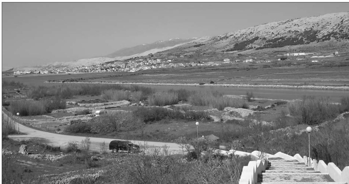
Sl. 1 Pogled s citadele na ruševine Staroga Grada uz kanal solane i sadašnji grad Pag.