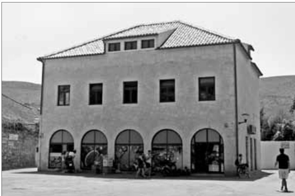
Slika 12. Sjeverno pročelje Društvenog doma HSS-a u Jelsi