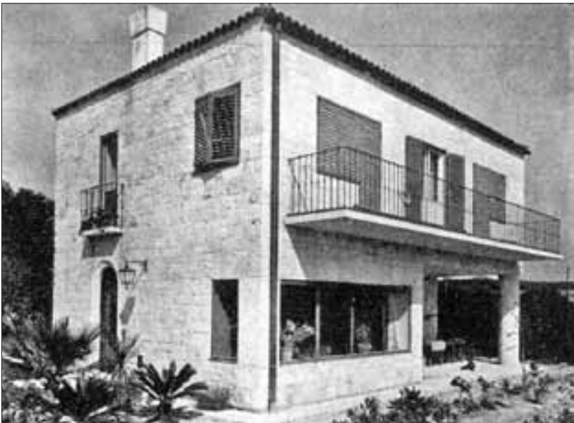
Slika 4. Kuća Čulić 1930-ih godina (S. Planić: Dva pisma o stanovanju priučnih kućevlasnika, Zagreb 1936., 25)