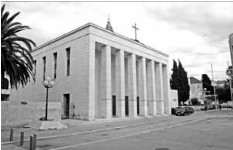
Slika 10. Gospa od Zdravlja u Splitu s jugozapadne strane