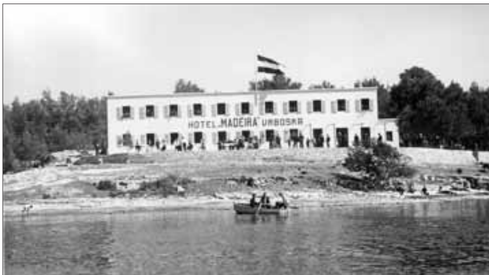
Slika 11. Hotel Madeira u Vrboskoj krajem 1930-ih godina