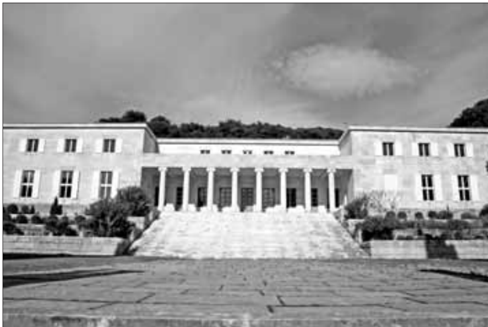
Slika 6. Južno pročelje palače Ivana Meštrovića u Splitu