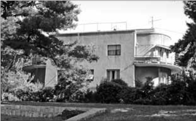
Slika 3. Južno pročelje stambene zgrade Ilić u Splitu