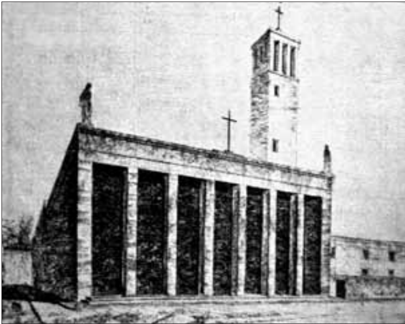
Slika 9. Perspektivni prikaz izvedbene varijante Gospe od Zdravlja u Splitu (A. Crnica: Naša Gospa od Zdravlja i njezina slava. Šibenik 1939., 569)