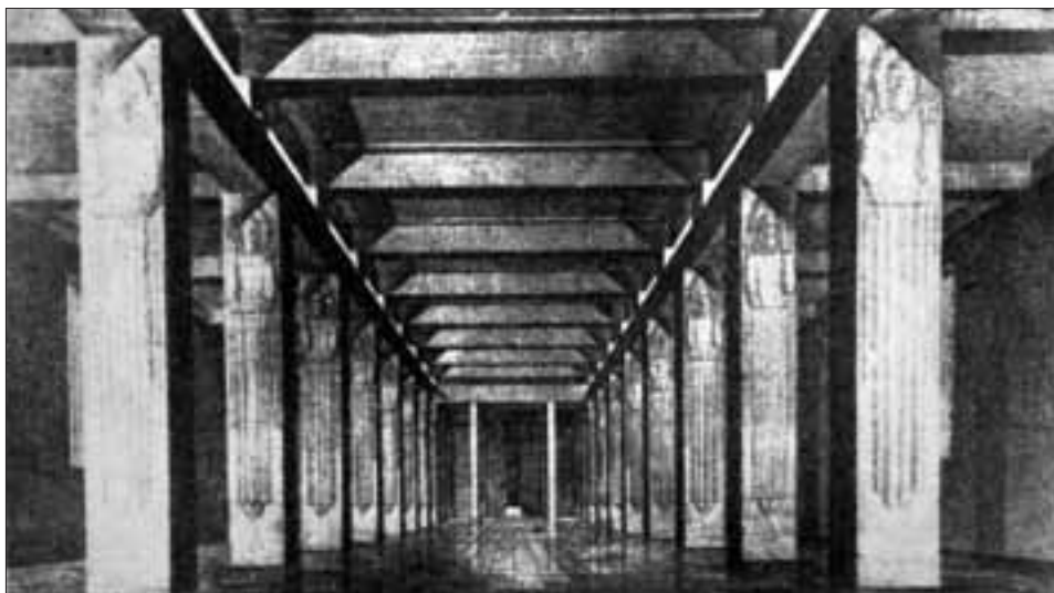
Slika 7. i 8. Perspektivni prikaz treće inačice i fotografija unutrašnjosti crkve Gospe od Zdravlja u Splitu (Ž. Vidović: Meštrovici i savremeni sukob skulptura s arhitekturom. Sargero 1961., sl. 100, i fototeka Z. Paladino)