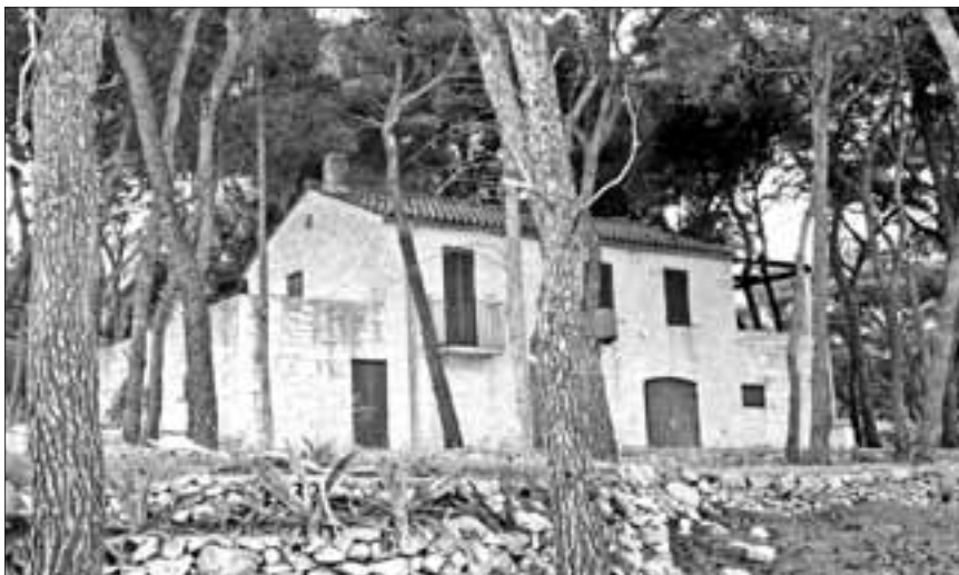
Slika 2. Kuća Nižetić u Sutivanu, jugoistočna strana