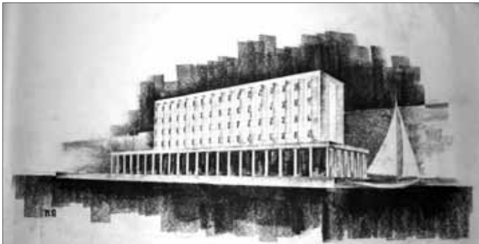
Slika 5. Perspektivni prikaz zgrade hotela na Zapadnoj obali u Splitu (HMA-HAZU-LH)