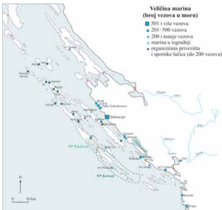
Marinas, mooring sites and important sport ports in Northern Dalmatia

Marine, organizirana privezišta i važnije sportske lučice u sjevernodalmatinskom akvatoriju