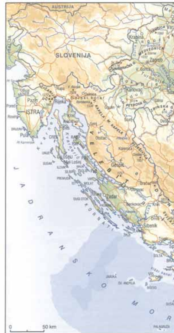
■ Fizička karta

Fizička karta Republike Hrvatske iz Atlasa svijeta Leksikografskog zavoda "Miroslav Krleža" (dolje)