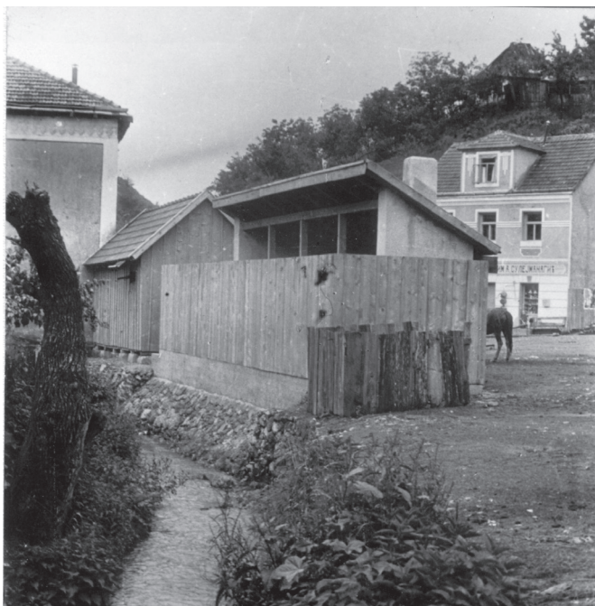
Javni higijenski nužnik, oko 1930.