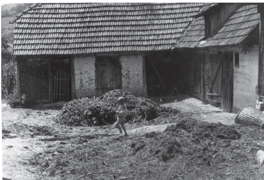
Nehigijenska gnojnica, oko 1930.