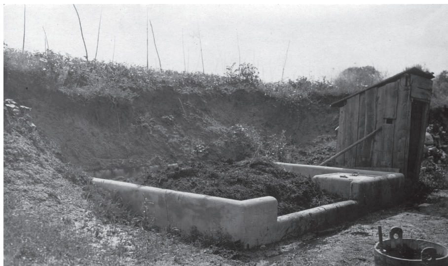
Sanirana gnojnica, oko 1930.