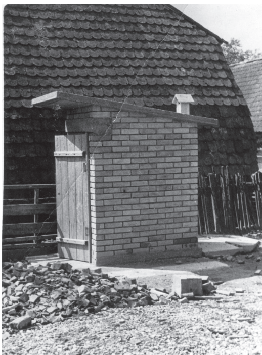
Privatni higijenski nužnik, oko 1930.