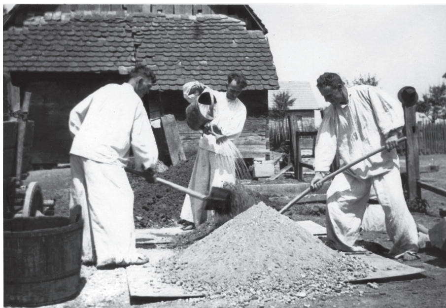
Asanacijski radovi u Mraclinu, oko 1930.