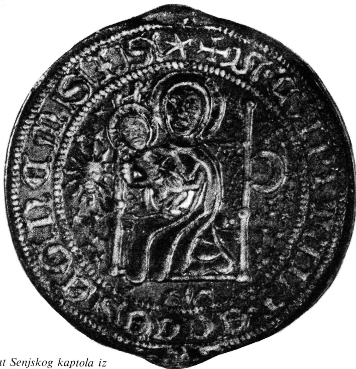
Sl. 23. — Mali pečat Senjskog kaptola iz 14. st. u Arhivu Stolnog kaptola u Senju

2. Srednjovjekovni Senjski kaptol bio je ustrojen kao i drugi naši katedralni kaptoli u Dalmaciji i sjevernoj Hrvatskoj. U početku je brojio manji broj kanonika, između kojih su se po zvanju ili časti isticala dostojanstva, kanonik arhiprezbiter, kanonik arhidakon i kanonik primicerij. Ta su trojica imali posebno zaduženje u kaptolu. U 13. i 14. st. kaptol je stalno brojio dvanaest kanonika, čiji se broj održao i kasnije. Glavna zadaća kanonika kaptola bila je ponajprije u obavljanju bogoslužja, a tek onda i u drugim stvarima unutar crkve ili izvan nje. Kanonici su se uzdržavali od redovnih prihoda, tj. desetina.