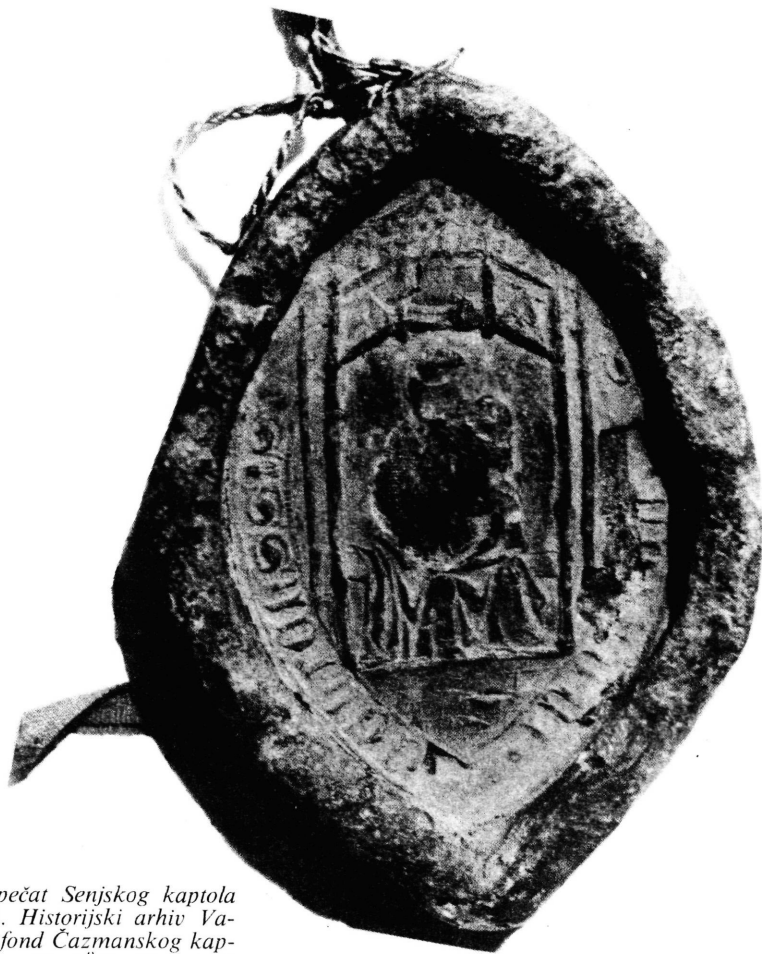
Sl. 22. – Veliki pečat Senjskog kaptola iz 1492. Historijski arhiv Varaždin, fond Čazmanskog kaptola, fasc. 16, N o 9.

Završnica slova ima određeno zadebljanje. Svi elementi pečatne slike, natpis, stojeći lik biskupa s mitrom i pastoralom, imaju izrazito naglašene gotičke osobine. Konceptija pečata izvedena je izuzetno dobro kroz modelaciju i nijansiranje biskupova lika. Po svim