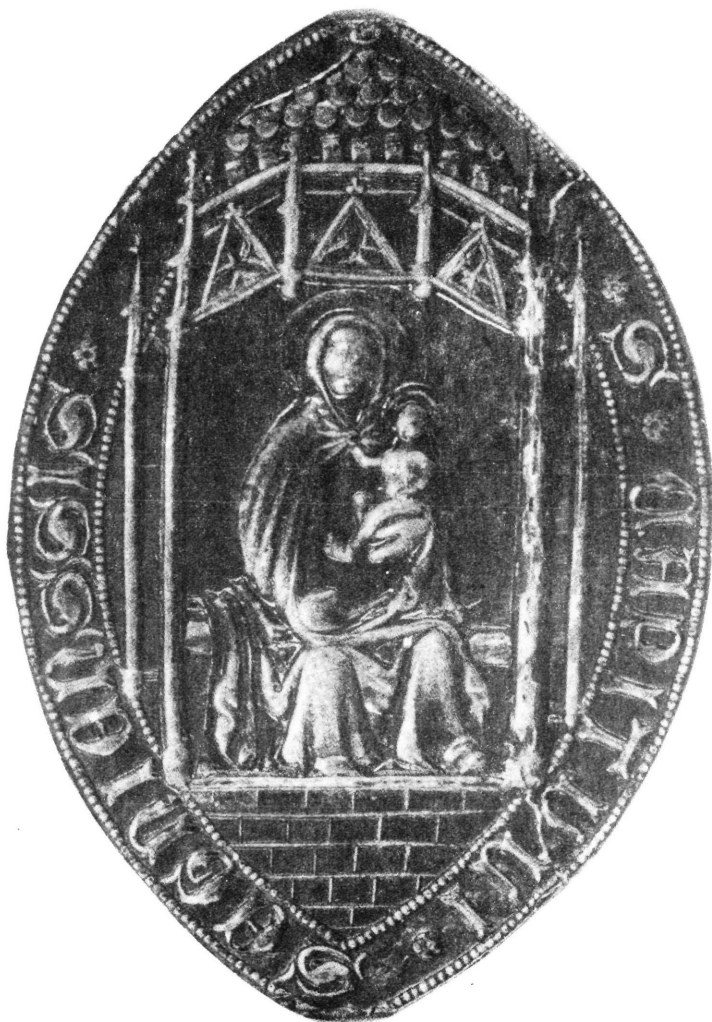
Sl. 21. — Veliki pečatnjak Senjskog kaptola s kraja 14 st., u Arhivu Stolnog kaptola u Senju

skupa Stjepana i zadarskog nadbiskupa Lovru Periandra, i »dominus Martinus Seniensis episcopus«, što potvrđuje ne samo navedeni tekst isprave nego i pečat biskupa Martina, koji visi s desne strane nadbiskupova pečata, o zelenoj vrpci isprave u smeđem vosku s protupečatom, utisnutim palcem ruke. Pečat je oblika mandorle s dimenzijama 5,5 x 3,1 cm (8 sl. 24). Vrlo je elegantne forme, sa središnjim motivom stojećeg biskupa. Biskupov lik frontalno je koncipiran s mitrom na glavi, koja je trokutastog oblika i razdijeljena po sredini do ruba, ukrašenog nizom sitnih bisera u formi dijademe. Ispod mitre izvire sa svake strane jedna traka, ukrašena perlama, koje dodiruju ramena. Detalji glave,