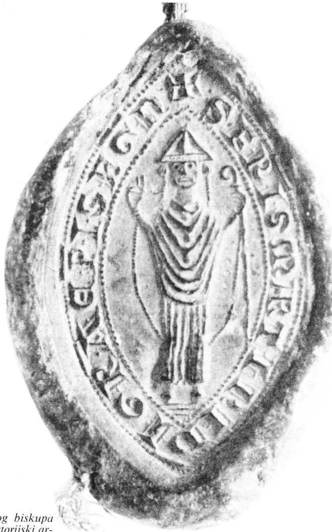
Sl. 24. – Viseći pečat senjskog biskupa Martina iz 1280. Historijski arhiv u Zadru, Fond isprava sv. Dominika, stara sign. 2172.

3. Bilo kakvu javnu djelatnost u vidu sklapanja, svjedočenja, sastavljanja, te pisanja, prepisivanja, ovjeravanja i izdavanja privatno-pravnih ugovora ili drugih dokumenata (isprava) do potkraj 14. st., nije vršio kaptol, nego javni notar po carskom ovlaštenju, koji se u Senju prvi put spominje već 1233. godine. Međutim, potkraj 14. st. i kaptol je počeo vršiti službu javne djelatnosti na temelju privilegija kralja Sigismunda od 25. listopada 1392. godine. Od tada kaptol postaje »locus credibilis«, pred kojim su se mogli vršiti svi