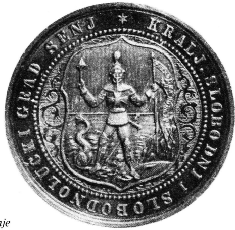
Sl. 27. – Naličje medalje uz proglašenje Senja slobodnim kraljevskim gradom 1871.