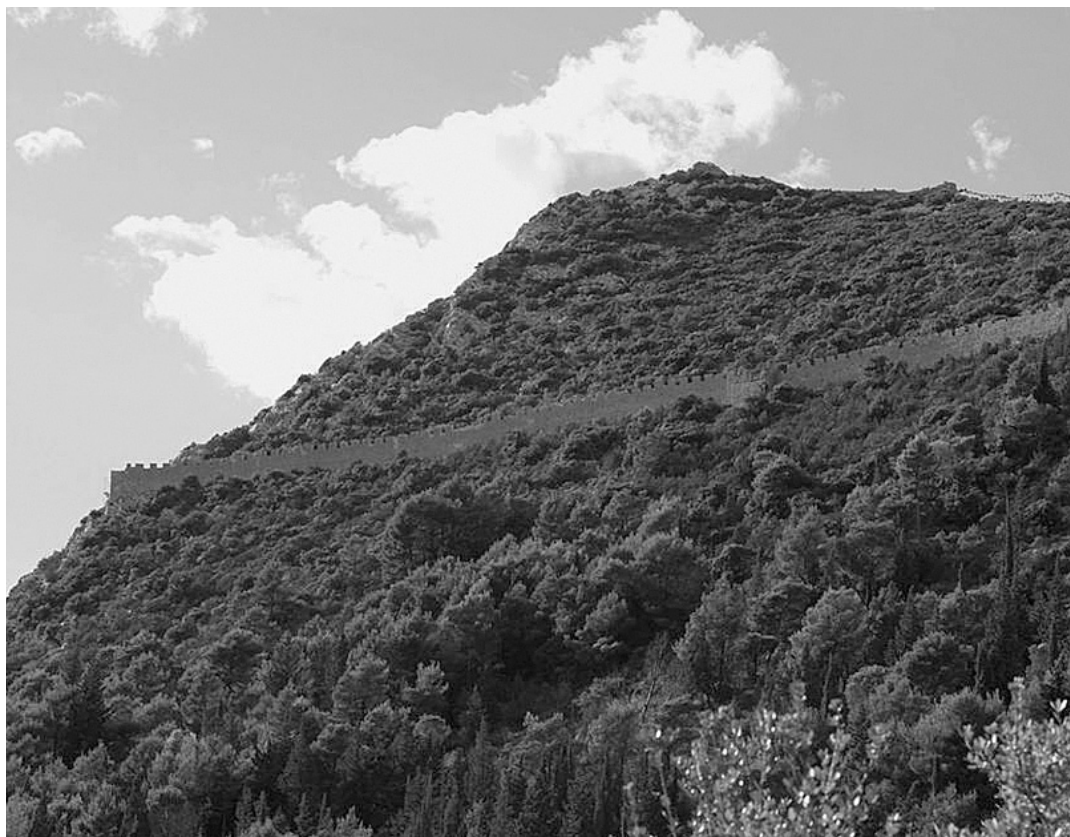
↑ Konzervirani potez Velikog zida

Gradnja imponantnoga fortifikacijskog sklopa koji nazivamo Stonskim zidinama započela je ubrzo poslije kupnje Pelješca (Stonskog Rata) 1333. godine. Dubrovačka komuna odlučuje tada radi osiguranja svoga novostečenog posjeda podići Veliki zid. Dugačak oko 1200 m, vodio je preko vrha brda Podzvizd i, zatvarajući cijeli poluotok, završavao