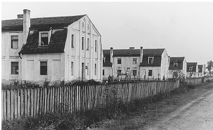
← Pogled na Koloniju 1925, razglednica iz zbirke Željka Divnića

Hrvatske zemaljske vlade u Zagrebu), imao je oko 4 tisuće stanovnika i bio obrtničko i trgovačko središte za širu okolicu, a njegovu naglom razvoju koji je uslijedio najviše je pridonijela izgradnja željezničke pruge 1878. Prva industrijska postrojenja počinju nicati osamdesetih godina 19. stoljeća: ciglana, pivovara i pecara žeste, potom parni mlin i parna pilana, a najveći zamah gradu dala je početkom 20. stoljeća izgradnja Prve jugoslavenske tvornice vagona, strojeva i mostova, osnovane 1921, s 90 posto domaćega kapitala. Radilo se o značajnu projektu koji je podržala i gradska uprava te je Grad od poduzetnika Zefira Marca otkupio 100 jutara pustare za njezinu izgradnju. Tvorničke zgrade, skladišta, uprava, elektrana i drugi objekti podignuti su za nešto više od godinu dana te je Prva jugoslavenska tvornica vagona, strojeva i mostova počela raditi već 1. srpnja 1922. Bilo je to u ono vrijeme najveće industrijsko postrojenje te vrste u jugoistočnoj Europi, s početnih 850 radnika. 1 Tako velik broj radnika, većinom doseljenih s obiteljima, stvorio je problem smještaja te je odlučeno podići radničku koloniju. Gradsko poglavarstvo, na čelu s gradskim načelnikom Bubićem, 1922. godine ustupilo je 22 jutra Dimovićeve livade (pustare) u Čaplji na kojoj je podignuta nova radnička kolonija sa sedam jednokatnica (svaka