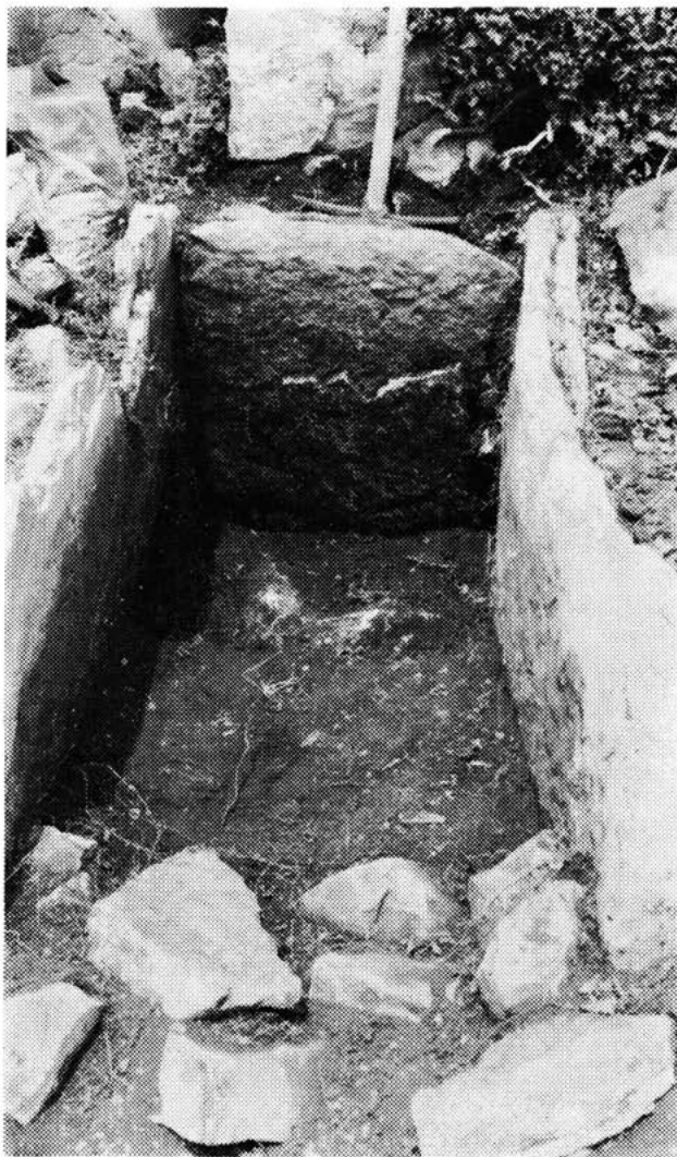
Sl. 6 — Unutrašnjost groba br. 1 pod »Gradinom«, zaselak Kneževiči — Malo Libinje. 1981.

Veliko Rujno najveće je kraško polje koje se prostire na primorskoj strani Velebita na nadmorskoj strani od oko 900 m. Na sredini polja, uz križanje putova, od davnine se nalaze ostaci stare i nove planinske crkve posvećene sv. Mariji. Sa sjeveroistočne strane crkve izdigla se mala kamena glavica »Gradina«, koja tridesetak metara nadvisuje Rujno. Padine glavice nisu posebno strme, ali su ipak bile pogodne da pruže veću zaštitu naselju koje se gore na zaravanku razvilo. Glavica je na vrhu poravnata i podijeljena na nekoliko lijeha, koje svaka za sebe predstavljaju ograđen prostor što