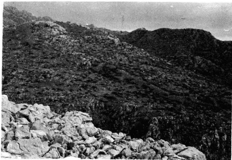
Sl. 9 — Velika gradina »Sv. Trojica« istočno od Sibuljine, snimak od zapada.

Na prostoru Sv. Trojice, i to na njegovu najvišem, sjeverozapadnom dijelu, na jednoj veoma istaknutoj glavici, utvrđeni su ostaci Velike gradine, 5 koja se sastoji od tri zasebna, ali međusobno povezana dijela. Velika gradina (A) sa zapadne strane zaštićena je dosta strmim stijenama, iznad kojih su, u cilju obrane bili podignuti bedemi. Nasuprot tome, sa sjeveroistočne strane gradina je bila zaštićena jakim i visokim bedemom izgrađenim u tehnici suhozida, koji u osnovi prelazi 3 m debljine. S te strane bedem je najviši zbog toga jer je prilaz sa gornje — sjeveroistočne strane bio najlakši.