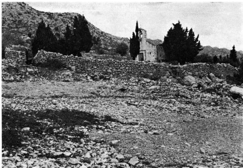
Sl. 10 — Crkva Sv. Trojice i mjesno groblje, snimio A. Glavičić od zapada 1983.

S jedne i s druge strane ovoga bedema, na uglovima s lijeve i desne strane, primjećuju se veće gomile kamenja, koje, kako mi se čini, pripadaju sistemu ugaonog utvrđenja koje je svojom visinom činilo obranu uspješnijom. Gradina A u tlocrtu je elipsastog oblika, čiji promjer u osi istok-zapad iznosi 36, a sjever-jug 23 m.