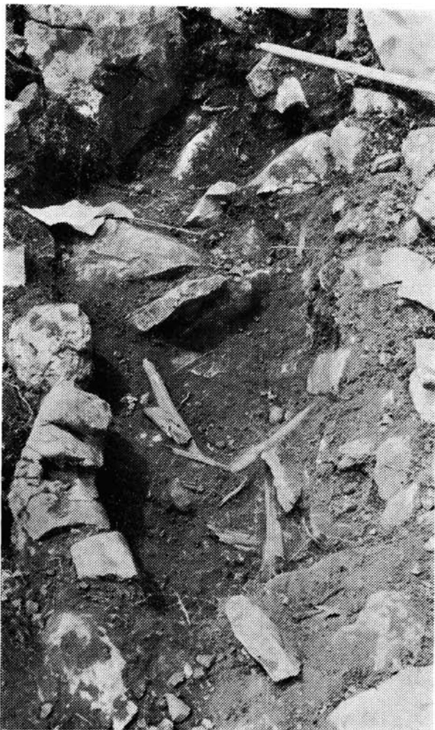
Sl. 7 — Ostaci pokojnice u grobu br. 2. pod »Gradinom«, zaselak Kneževići — Malo Libinje, 1981.

je konfiguracijom terena i umjetno podignutim suhozidom potpuno zaštićen od napada. Zapravo se radi o jednoj većoj gradini, kojoj se moglo prići s dvije strane, od sjevera i od juga. S tih strana bili su izgrađeni jaki bedemi, dok su s istočne i zapadne strane uz bedem stijene činile određenu zapreku. Da se na glavici nalazilo staro naselje, saznali smo od Marasovićevih, koji ovdje na Rujnu imaju stalne stanove i tu žive od davnine. Oni od davnine glavicu nazivaju Gradinom. I sjećaju se da je na njezinu istočnom dijelu njihov rođak Petar između dva rata pronašao neke vrijedne starine kada je u potrazi za dragocjenostima počeo kopati suhozidine. Tom prilikom on je iskopao dosta ostataka starih lonaca, ostataka željeznih šiljaka (vjerojatno