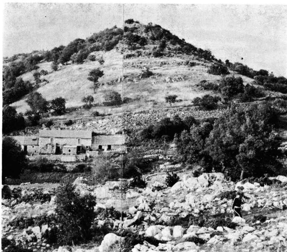
Sl. 4 — Zaselak Kneževići — Malo Libinje, j. Velebit, u pozadini gradina. Snimak od jugozapada, A. Glavičić 1981.

pokojnika koji je ovdje bio ranije sahranjen i koji je bio u nekom srodstvu s pokojnicom. U grobu nije se pronašlo drugih nalaza. Dimenzije groba iznose: 1,20 \times 0,65 \times 0,35 m.