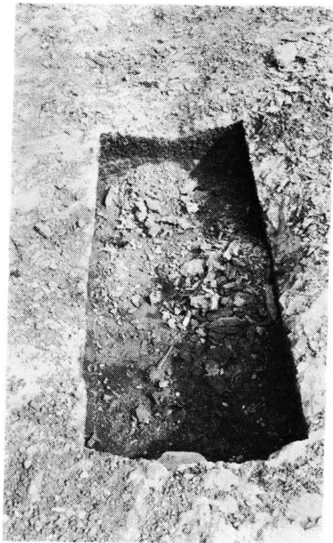
Sl. 13 — Kasnoantički grob iskopan u kamenu. Temelji kuće Milana Rončevića Čo- pićevo naselje — Varoš, 1983.

Svi ovi grobovi, kao i oni koji su otkriveni na obližnjim jugoistočnim parcelama, dosta su pravilno poredani u redove, s potrebnim međusobnim udaljenostima. Kao u susjednim grobovima, tako i ovdje pretpostavljamo