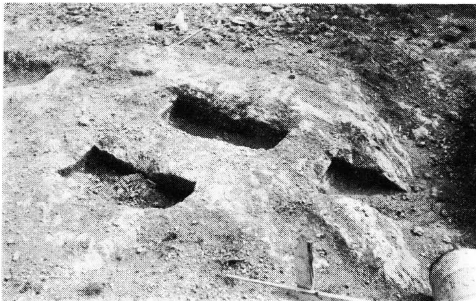
Sl. 12 — Prazni grobovi u iskopu temelja kuće Mile Rončevića, Naselje Vladimira Čopića — Varoš. Snimak od zapada, A. Glavičić 1983.