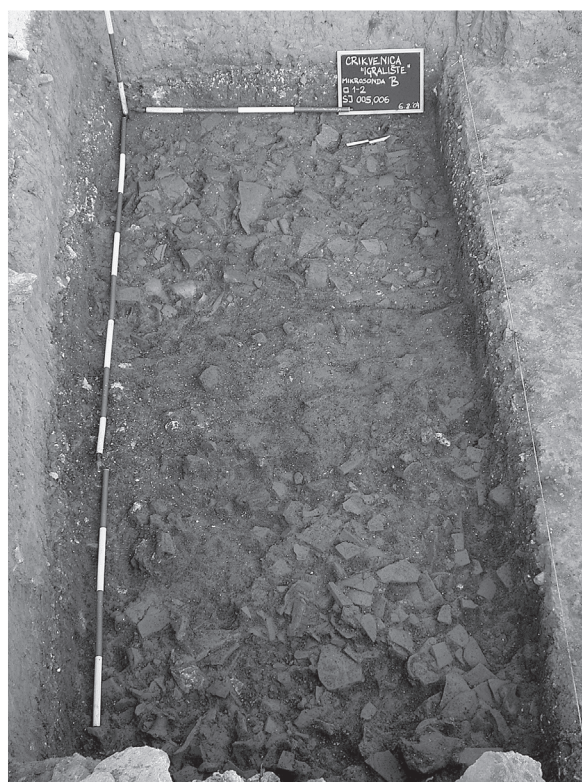
Sl. 2. Antički kulturni sloj s keramičkim teracom Fig. 2. Antiquity cultural layer with ceramic terrazzo

Uz znatniju koncentraciju keramičkih ulomaka u SJ 004, znakoviti su nalazi keramičke troske. Uz trosku je nađena manja koncentracija gara, gotovo samo u tragovima. Javljuju se i manji ulomci životinjskih i ljudskih kostiju.