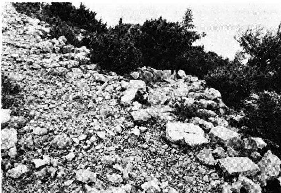
Sl. 18 — Pogled na mirilo obitelji Magaš pokraj puta. Snimio St. Gilić 1983.