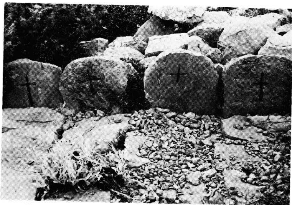
Sl. 16 — Podnožnice na mirilu obitelji Magaš, snimio St. Gilić 1983.

Kod mirila Stanića uočavaju se pačetroviniasti, pravokutni oblici i njihova masivnost. Međuprostor gledan iz profila nigdje nije tako masivan kao na ovim mirilima. Obično su to ploče oko 10 cm široke, no ovdje je to kameni blok širok oko 20 cm. Pretpostavljam da je ovaj masivni međuprostor ujedno obilježavao rub puta te je zbog čvrstine i stabilnosti namjerno odabiran masivniji kamen. Od mirila Stanića sačuvana su samo četiri mirila, vizualno bez prepoznatljivog ukrasa, tek taktilno se uočava motiv antropomorfnog oblika.