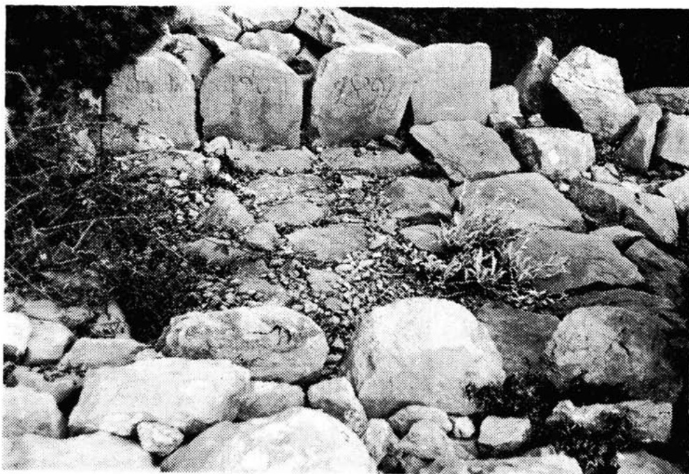
Sl. 15 — Skupno mirilo obitelji Magaš. Snimio St. Gilić 1983.

koje su udaljena svega 50 m. Pravo je čudo da su koliko-toliko sačuvana. Ne može se zaključiti da li je mirilo obiteljsko. Sačuvano je svega 5 mirila sa zatrpanim međuprostorima. Sada preko njih ide pješački put od Kneževića na magistralu. Sačuvano je 5 uzglavnica i 4 podnožnice. Međuprostor je pod zemljom i preko njega vodi novi put, jer je stari obrastao u gustiš. Nije moguće odrediti na kojoj su strani puta bila, na lijevoj ili desnoj, jer se put račva u dva dijela, pa bi se prije reklo da su u središtu, između jednog i drugog. Sveukupna dužina mirila je 2 m a širina 1,80 m.