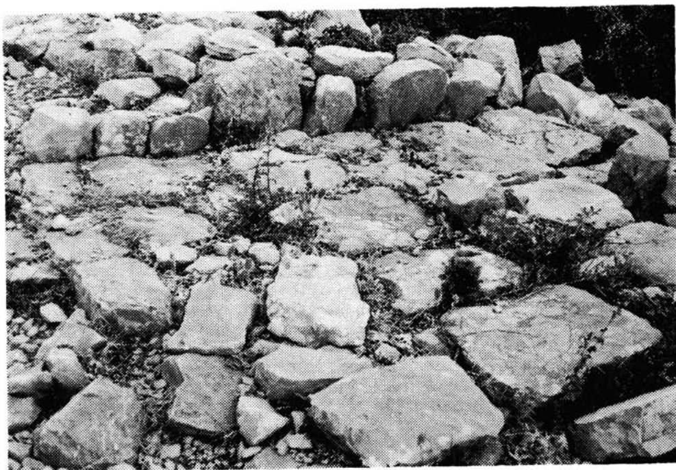
Sl. 17 — Grupa magaških mirila djece i odraslih. Snimio St. Gilić 1983.

Nije moguće odrediti poziciju, da li je i ovdje istok—zapad ili obrnuto, s obzirom na to da je reljef istrošen, a uzglavnica i podnožnica su iste veličine, što je inače rijetkost. Mirila Magaša sastoje se od dvije grupe prvobitnog položaja. Prvu grupu čini osam mirila: prva četiri su dječja, zatim slijedi jedno odraslo, pa ponovno jedno dječje, jedno odraslo i potom jedno dječje. Prva su četiri (dječja) na putu te se preko njih prelazi. Pitam se kakav je bio ranije ovaj put, kad sada mirila dopiru do njegove sredine. Prije ove grupe nalazi se jedno mirilo dijagonalno locirano preko puta, te se moralo prelaziti preko njega.