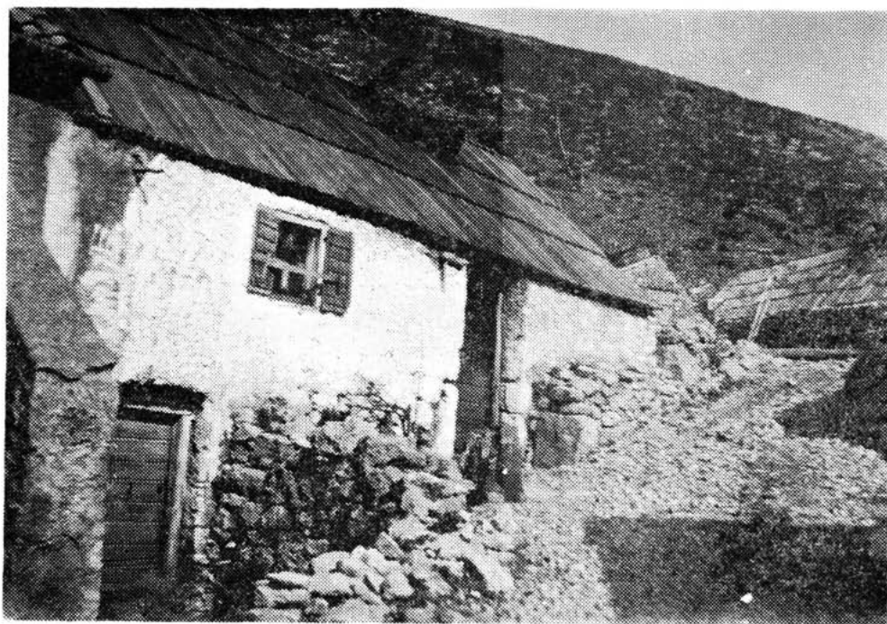
Sl. 29 — Zaselak Razbojište uz cestu Sv. Juraj — Krasno, snimio Vjeko Babić oko 1936.