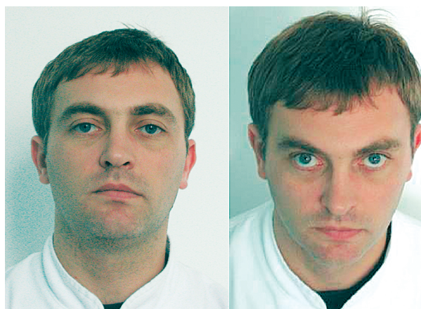
Slika 7. Nepravilan položaj kamere; kamera prenisko; kamera previsoko

Naime, problem nastaje ako kamera nije smještena u određenoj poziciji u odnosu prema pacijentu, što se ne opaža za vrijeme fotografiranja nego tek kada je fotografija gotova. Ako je kamera smještena previsoko, glava će izgledati kao da je nagnuta previše prema naprijed, a donja trećina lica činit će se manjom. Ako je kamera prenisko smještena, glava će izgledati kao da je nagnuta prema natrag, a inače povećana donja trećina lica činit će se kraćom (21) (slika 7).