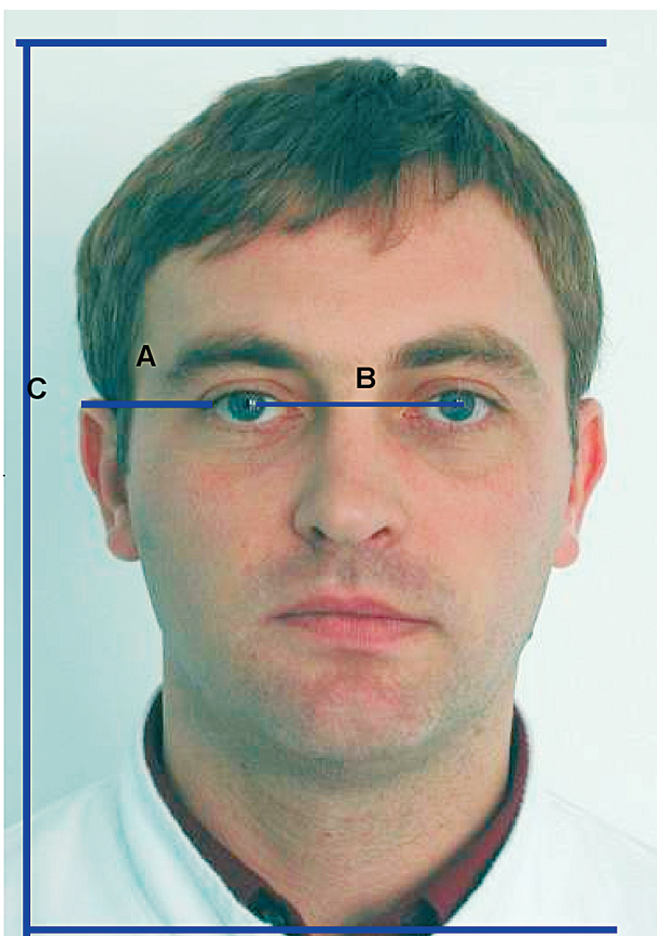
Slika 2. Idealan položaj glave kod frontalnoga prikaza. A, spojnica vanjskoga canthusa i gornjeg dijela uha; B, interpupilarna linija; C, prikaz onoga što je potrebno vidjeti na frontalnoj fotografiji.

Figure 2. Ideal head position for frontal view. A, outer canthus to superior attachment of the ear; B, interpupillary line; C, encompassing area (crown to collarbone)