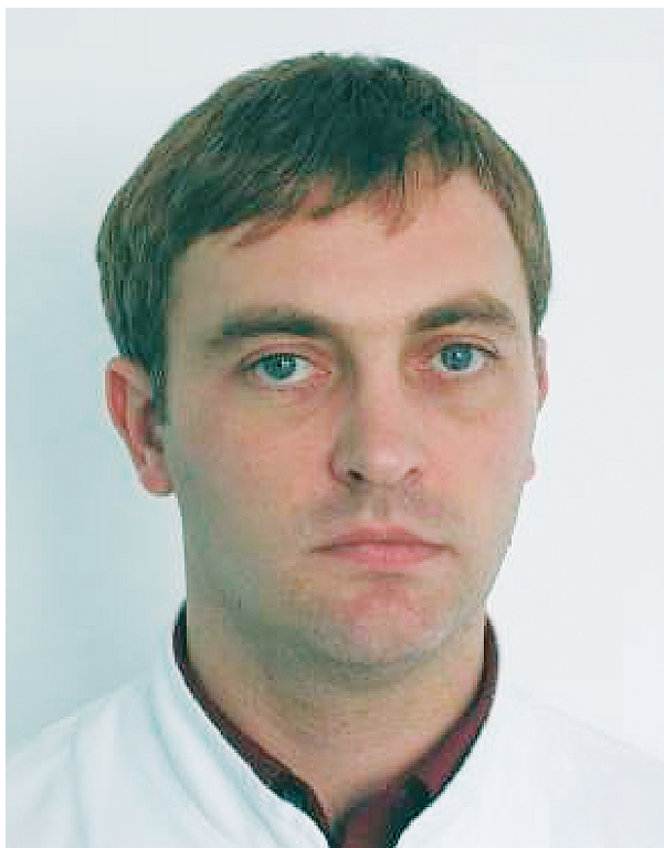
Slika 6. Pomak glave u stranu; prikaz nije simetričan Figure 6. Lateral head rotation; the view is not symmetrical

Rotacija glave na frontalnoj fotografiji također utječe na simetriju ostavljajući dojam asimetrije lica (slika 6).