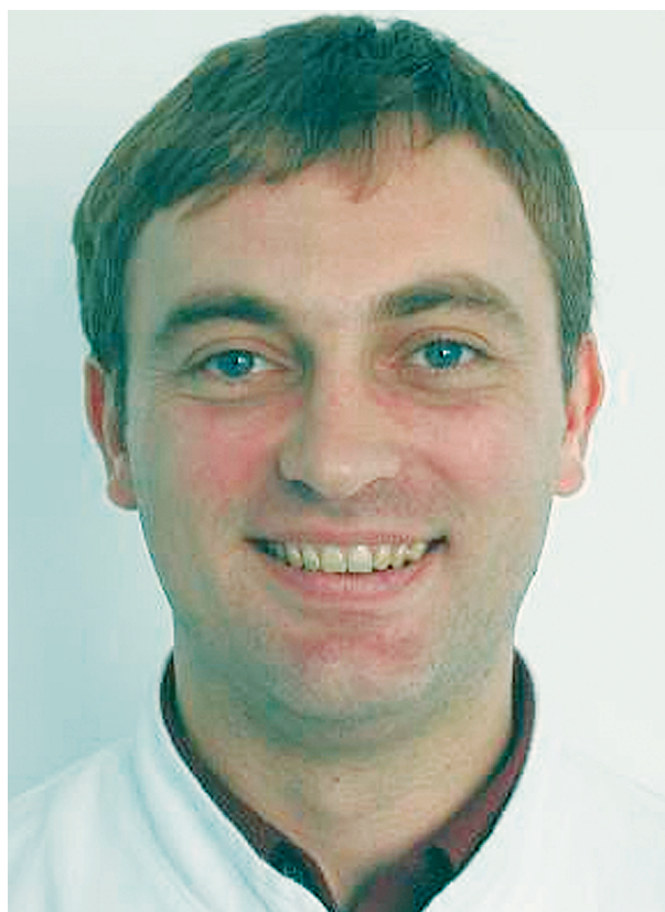
Slika 3. Prikaz osmijeha Figure 3. Smile view

definirao Broca kao položaj u kojem se stoji kad je vizualna os u vodoravnoj poziciji (10). Literatura uvelike govori o tome kako je prirodna pozicija glave u korelaciji s kraniofacijalnom morfologijom (11, 12), budućem trendu rasta (13) i respiratornim potrebama (14). Larrabee i sur. su se njome koristili za profilnu raščlambu (7), a Cooke i Wei kombinirali su prirodnu poziciju glave s vodoravnom kod kefalometrijskih raščlamba te zaključili da se radi o vrlo pouzdanoj metodi raščlamba kraniofacijalnog sustava (15). Konceptcija prirodne pozicije glave u ortodonciju je uveden 50-tih godina prošloga stoljeća. Prikazan je kao reproducibilna pozicija te se smatra da je bolje rješenje od intrakranijalnih referentnih linija zbog manje varijabilnosti u odnosu prema pravoj horizontali ili vertikali (16-20). Prirodna pozicija