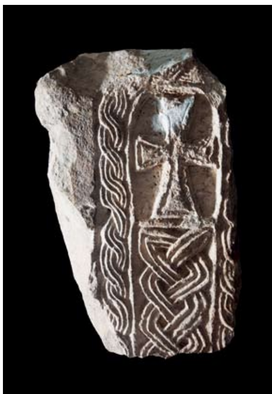
Sl. 12. Ulomak pluteja