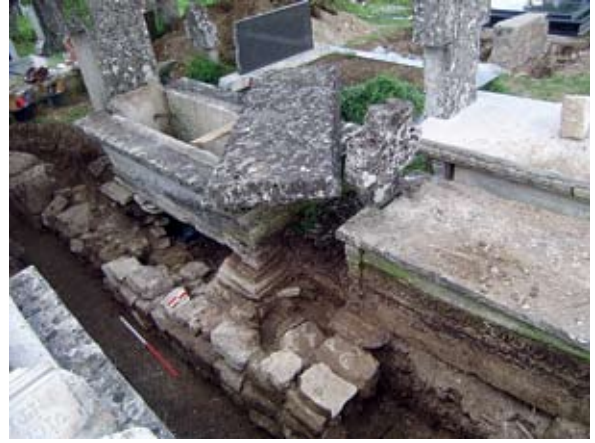
Sl. 7. Zid 2, sonda 2