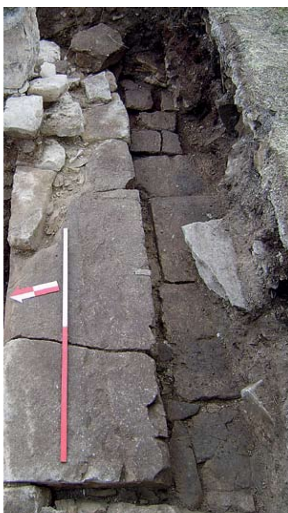
Sl. 4. Vidljivi dio podnog popločanja uza zid 1