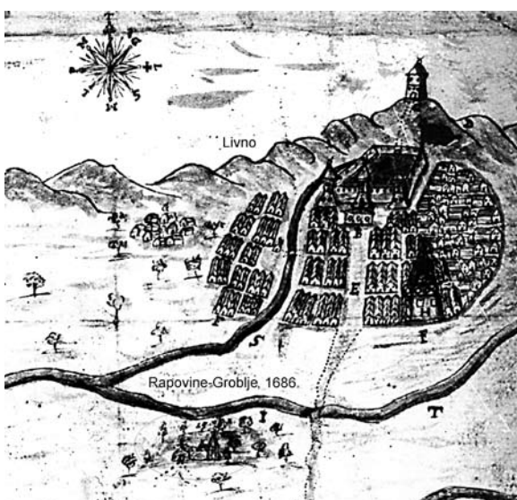
Sl. 15. Topografska karta Livna i okolice (1686.-1689.), (KAW, iz Livanjski kraj u povijesti , Split-Livno, 1994.)

Iznenaduje da se u Rapovinama prvi put arheološki istražuje sakralni i arhitektonski objekt iz predromaničkoga i romaničkog razdoblja na Livanjskom polju, a da se pritom ne uzimaju u obzir dosadašnji slučajni nalazi i pretpostavke. Upravo razdoblje kraja 9. i početka 10. stoljeća moglo je biti obilježeno gradnjama i obnovama sakralnih objekata na području livanjske županije. 20 Možda je donator ove crkve, ili neke druge predromaničke livanjske crkvice, bio upravo župan Želimir, koji se spominje u ispravi kneza Muncimira iz godine 892., što se uklapa u vremenski okvir djelovanja spomenute radionice. Ime donatora, njegovu ulogu u društvu i kod gradnje crkve posvećene apostolu Petru u Rapovinama, može nam otkriti nastavak arheoloških iskopavanja. Istoimeni titular na gredi crkvene pregrade i toponomastički zapis na karti iz 17. stoljeća, upućuju da je crkva posvećena apostolu Petru