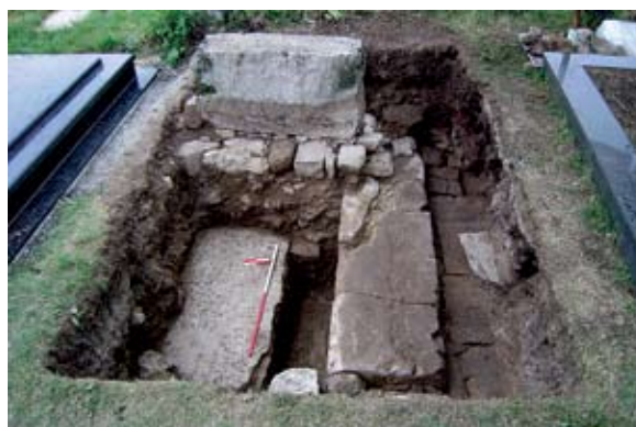
Sl. 2. Dio istražene arhitekture između novijih grobova, sonda 1