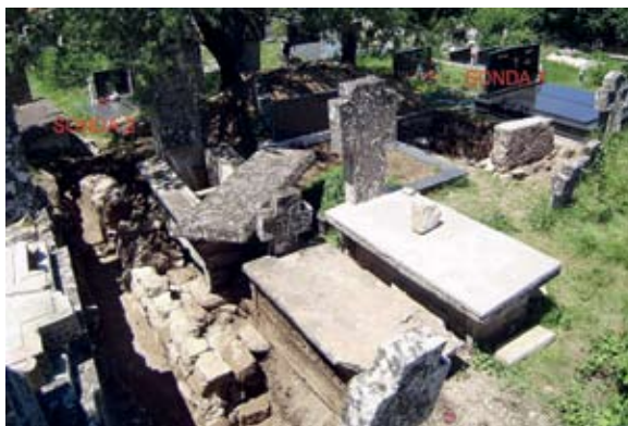
Sl. 14. Položaj sonde 1 i 2 u aktualnom katoličkom groblju