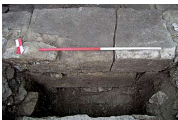
Sl. 3. Zid 1, sonda 1