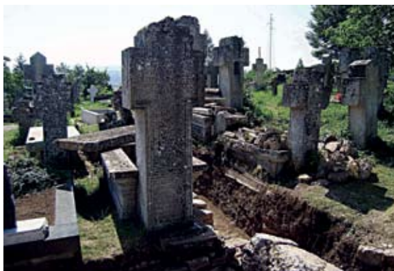
Sl. 16. Nadgrobni križevi (19. st.) na groblju u Rapovinama

obitelji (Jurkić, Kaić, Sučić, Kutleša, Lisica, Tadić-Marijanović...), i upravo su grobnice iz tog vremena s karakterističnim dominantnim križevima posebno kulturno obilježje livanjskoga kraja (sl. 16). 40 Činjenica da iste grobnice dobrim dijelom prate ili preslojavaju temelje crkvene arhitekture, pokazuje kako su ruševine crkve tijekom 19. stoljeća još uvijek bile vidljive. 41 Prema predaji, ugledni biskup i prosvjetitelj fra Augustin Miletić ukopan je unutar zidina crkve u Rapovinama, te su i livanjske katoličke obitelji željele da njihovi grobovi budu što bliže biskupu i crkvi. 42 Ukapanje na istom groblju nastavilo se i kasnije, te se još uvijek obavlja, ponajprije za mještane Rapovina i Gubera. Komisija za očuvanje nacionalnih spomenika BiH proglasila je arheološko područje groblja zaštićenim spomenikom kulture od nacionalnog značenja. 43 Sukladno tome, najbolje rješenje za zaštitu arheološkog lokaliteta i staroga groblja bilo bi proširivanje današnjega groblja i prestanak iskopavanja novih grobnica u zaštićenom dijelu, kojim se konstantno uništavaju stariji grobovi i ostaci arhitekture (sl. 17). 44