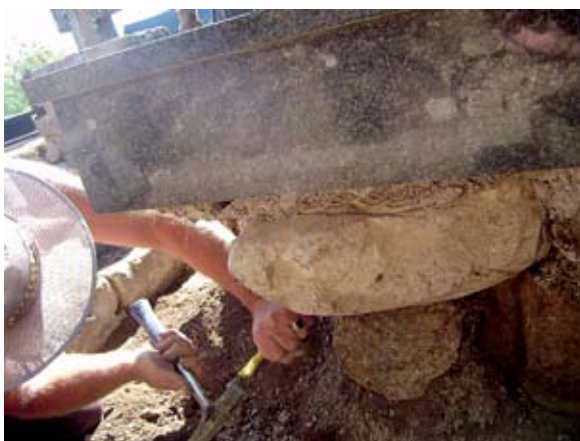
Sl. 11. Vađenje ulomka pluteja uzidanog u grobnicu Jurkić (1986.)