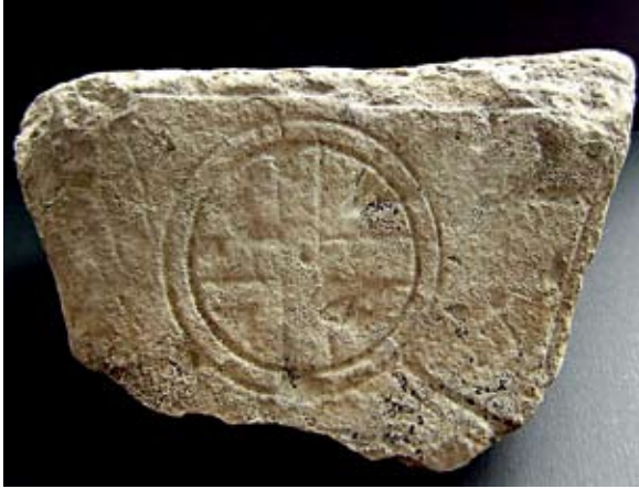
Sl. 6. Ulomak imposta