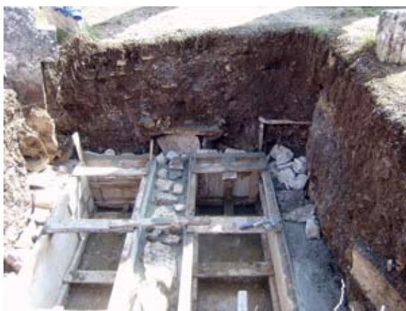
Sl. 17. Primjer devastiranja srednjovjekovnih grobova izgradnjom novih grobnica