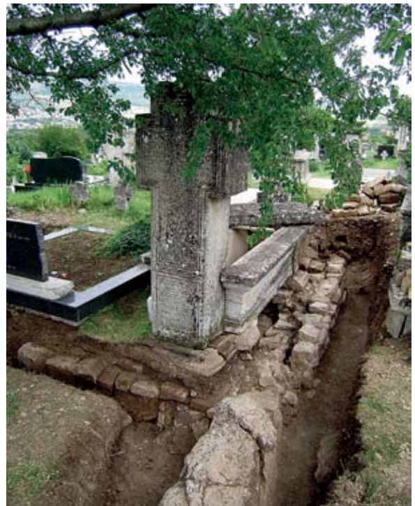
Sl. 9. Ostaci zida 3 u pročelju grobnica

padni profil grobnice Ivica Jurkića, zamijećen je ulomak s reljefnim motivom pletera, uzidan u grobnicu. 6 Uz odobrenje Stjepana Jurkića ulomak je izvađen iz zida obiteljske grobnice (sl. 11). Radi se o ulomku pluteja oltarne pregrade na kojem je reljefno uklesan motiv križa u kombinaciji s troprutim pleterom (Inv. br. FMGG 6650, sl. 12). Na vrhu ukrasnog polja je križ pod arkadom, ispod je mreža od uglatog troprutog pletera. Križ je proširenih krakova s urezanom rubnom profilacijom. Čitava kompozicija obrubljena je troprutim dvopletom, motivom kakvim su ornamentirani prije navedeni ulomci. Pletenica je, kao i rubni dijelovi ulomka, velikim dijelom otučena. Mreža pletera prekinuta je u donjem dijelu otučenog spomenika. Visina sačuvanog ulomka je 41 cm, a pretpostavljamo da je