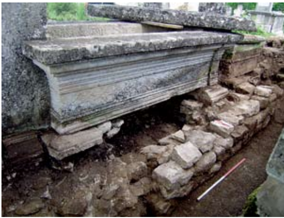
Sl. 8. Ulomci arhitekture inkorporirani u podnožje grobnice iz 1852.