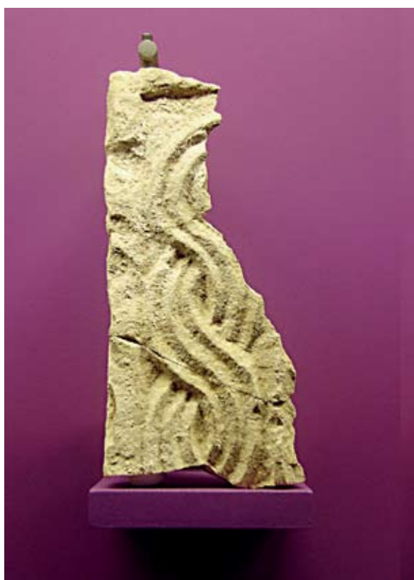
Sl. 5. Ulomci pilastra