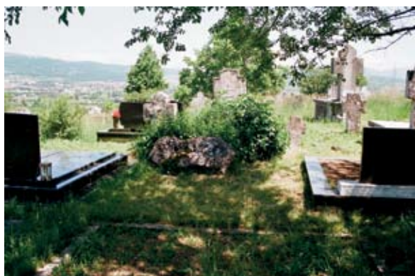
Sl. 1. Položaj sonde 1 prije otvaranja