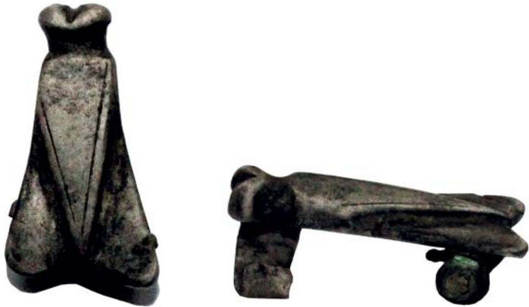
Sl. 5. Srebrna fibula u obliku cikade

triju linija na nozi. Na glatkoj poledini očuvan je dio nosača osovine spiralnog mehanizma za kopčanje i dio nosača igle. Dužina fibule je 54,44 mm, a najveća širina 23,13 mm. Već je Vinski ustvrdio da za ovu fibulu nema paralela; razlog tome leži u prilično lošem i dijelom netočnom crtežu, koji se i poslije reproducirao. Naime, ovaj tip fibule, ali izrađen od srebra može se naći na lokalitetu Magyartés, 38 datiranom od 530. do 568. g., a slične u Bökeny – Mindszentu. 39 Iako ovaj jednostavniji tip fibule nije čest, može se povezati s gepidskom prisutnosti u Vinkovcima, a uz ostale jednostavnije oblike gepidskog nakita i funkcionalnih dijelova odjeće 40 uklapa se u poznatu sliku Cibala iz prve polovice 6. stoljeća.