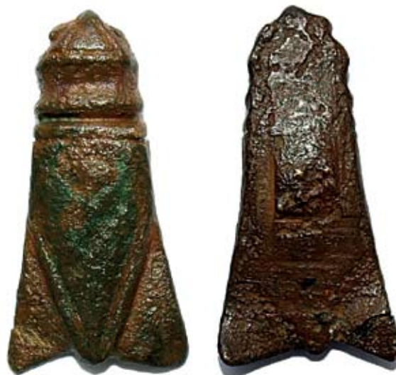
Sl. 4. Aplikacija u obliku cikade iz okolice Vinkovaca

stilizirane nasuprotno postavljene i međusobno povezane ptičje glave. Ukrašena je geometrijskim ornamentom u tehnici rovašenja. Iako igla nedostaje, na poledini su sačuvani ostaci šarnira i nosača za iglu. 31 Ovaj je tip J. Werner imenovao Varpalota 34 /Vinkovci (panonsko-langobardski tip) i datirao je u prvu polovicu 6. st. Prema novijim i preciznijim obradama pripada sjevernodunavsko-panonskoj prijelaznoj fazi, koja se datira u vrijeme od 540. do 560. godine. 32