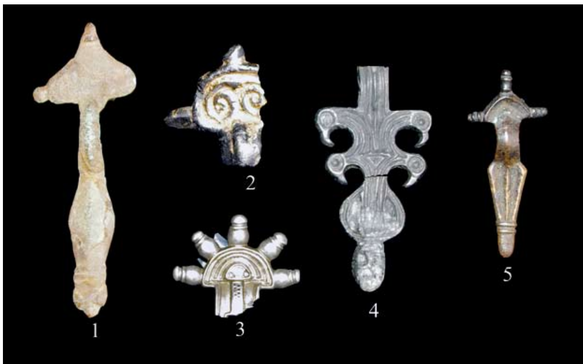
Sl. 1. Fibule seobe naroda u fundusu Gradskog muzeja Vinkovci

(1. Fibula iz Nuštra; 2. Fibula iz Mrzovića; 3. Fibula iz Ostrova; 4. Fibula iz Tordinaca; 5. Fibula iz Vinkovaca)