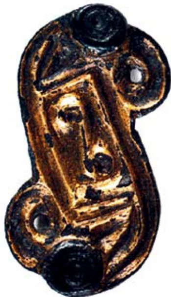
Sl. 3. S-fibula iz Vinkovaca (preuzeto iz Demo 2009)