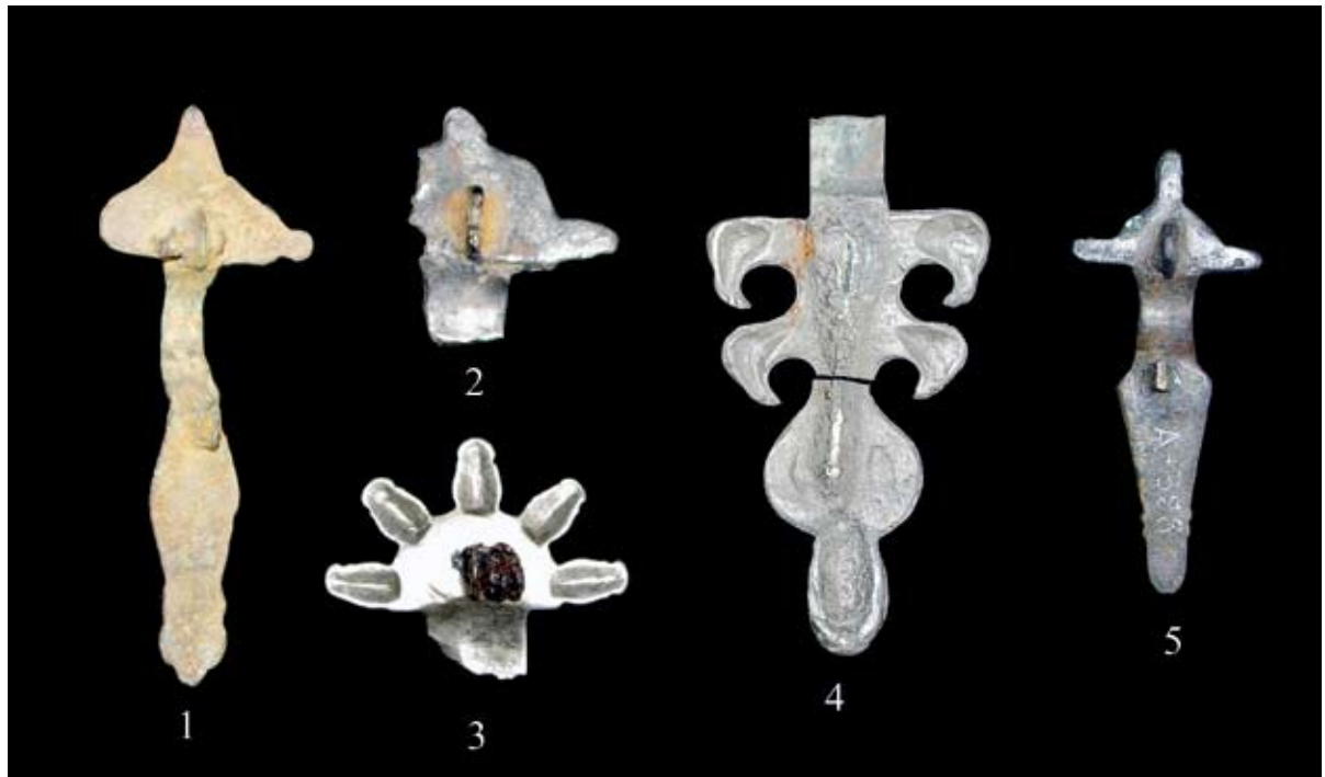
Sl. 2. Fibule seobe naroda u fundusu Gradskog muzeja Vinkovci – poledina (1. Fibula iz Nuštra; 2. Fibula iz Mrzovića; 3. Fibula iz Ostrova; 4. Fibula iz Tordinaca; 5. Fibula iz Vinkovaca)

– Rákóczi Strasse, 16 datiranom od 530. do 568. godine, potom nalazu iz groba 88 u Kiszomboru 17 (lokalitet se datira od 472. do 620.), trima fibulama iz razorenih grobova na ciglani u Szerb – Nagyszentmiklósu (Sînicolaul Mare) 18 datiranim od 500. do 568. g., fibulama iz naselja u Malomfalvi (Moreşti) 19 datiranim u 6. stoljeće, ali i u paru ostrogotskih fibula s Krima 20 datiranom u kraj 5. i početak 6. stoljeća, kao i paru fibula iz langobardskoga groba na lokalitetu Mistřín iz 6. stoljeća. 21 Riječ je dakle o vrsti fibule koja se susreće na širokom prostoru i traje relativno dugo. Kako ovoj fibuli nije sačuvana noga koja bi omogućila užu i precizniju dataciju, za sada je moramo okvirno smjestiti u prvu polovinu 6. stoljeća.