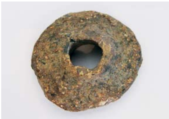
Sl. 4 a