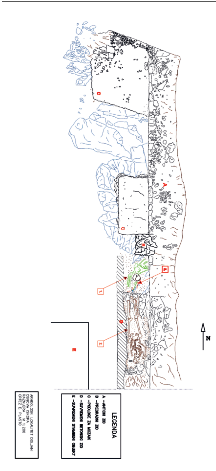
T. 1, Plan 2