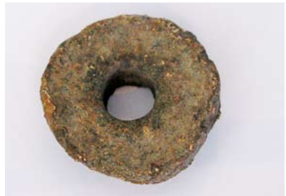
Sl. 4 b