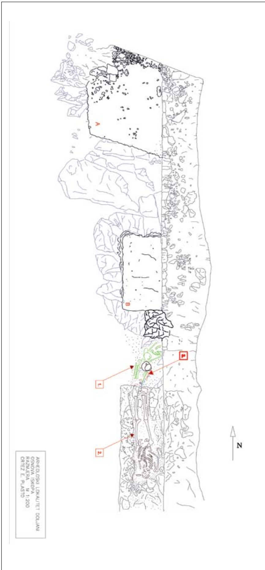
T. 1, Plan 3