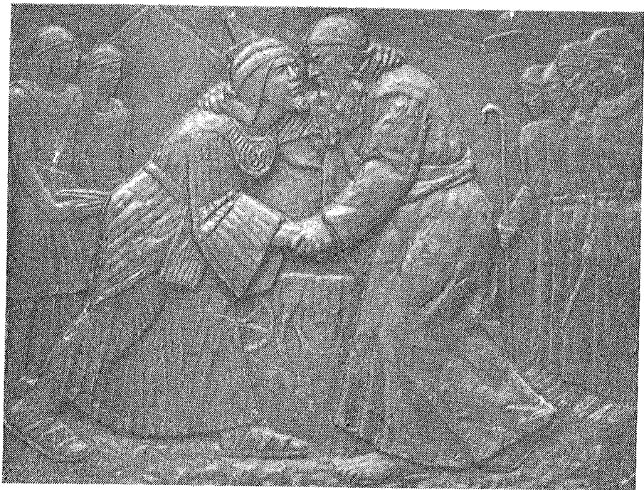
Grga Antunac, Susret Josipa i oca Jakova , detalj brončanih vratnica sjev. pobočnog portala šibenske katedrale

Te neprestane ljudske suprotnosti, opisane u vječnoj živoj riječi Biblije, Antunac je majstorski ostvario u tih osam četvorina. U prvi plan on postavlja