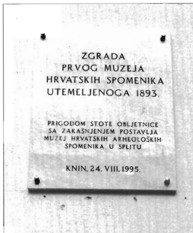
Otkrivanje spomen ploče na zgradi Prvog muzeja hrvatskih spomenika u Kninu