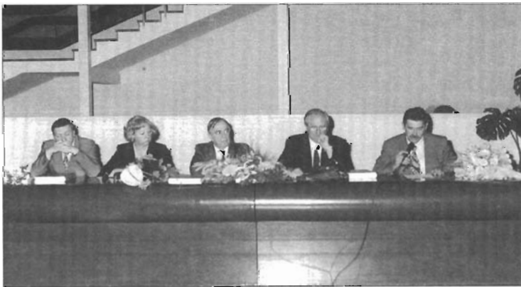
S promocije knjige V. Delonga, Latinski epigrafički spomenici u ranosrednjovjekovnoj Hrvatskoj