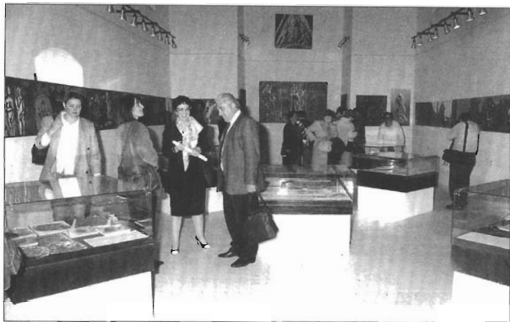
Izložba Srednjovjekovni kostim na području stare hrvatske države, u crkvi Sv. Barbare na tvrđavi u Kninu

kom za arheologiju Filozofskog fakulteta u Ljubljani. Izloženi manji segment od ukupno 8000 fotografija snimljenih u periodu od 1989. do 1991. pokazuje zanimljivu metodu arheološkog dokumentiranja kojom je u ovom slučaju autorica uvelike dopunila i izmijenila arheološku kartu Irske. Izložbu je otvorio prof. dr. Ivo Babić.