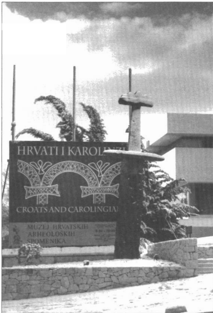
Scenografija na ulazu u Muzej u vrijeme izložbe Hrvati i Karolinci