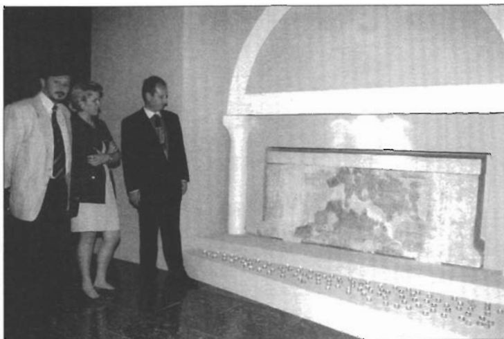
Sarkofag kraljice Jelene u MHAS-u u scenografiji izložbe povodom 100-te obljetnice otkrića sarkofaga