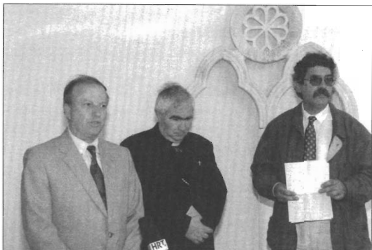
Otvorenje arheološke zbirke na Bribirskoj glavici