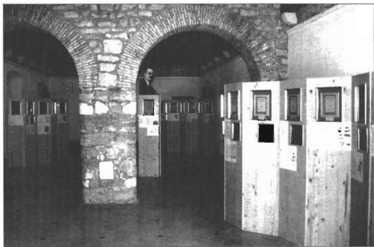
Izložba u prigodi proslave 100-te obljetnice Starohrvatske prosvjete u Županijskom muzeju u Šibeniku

Izložba "100 godina Starohrvatske prosvjete" priređena je u Muzeju u prosincu. Otvaranje izložbe bila je prigoda za pred-