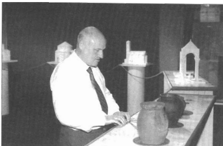
Slijepi posjetitelji na izložbi Oblik vremena

media Branka Brekalo predstavila je web stranice Muzeja kojima se najavljuje izložba Hrvati i Karolinzi i cjelokupni projekt.