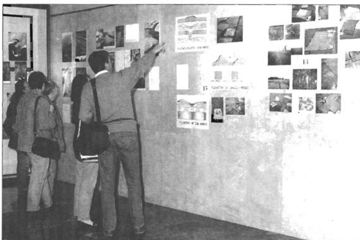
Izložba Krajolik kao dokument koju je u ime autorice dr. G. Barret u MHAS-u priredila prof. D. Grossman iz Ljubljane

U zgradi Prvog muzeja hrvatskih spomenika u Kninu u listopadu je prigodno obilježena 100. obljetnica Starohrvatske