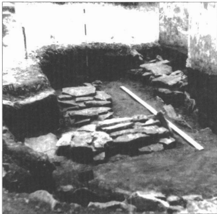
Grobovi iza apside crkve Sv. Jurja tijekom iskopavanja

vrijeme izgradnje crkve upućuje i romanička struktura zida apside i njen polukružni oblik, dok šiljasti gotički svod i recentna preslika ukazuju na kasnije obnove i dogradnje. Na pročelju je sačuvan i izvorni jednostavni portal tipičnih romaničkih odlika, s polukružnom lunetom u koju je uklesan latinski križ. Naknadno su probijena i dva četvrtasta prozora, jedan sa sjeverne, a drugi s južne strane, te jednokrilna vrata na južnom zidu. Oltar i kor do ulaza su novijega postanja, a u crkvi se čuvaju i razna ex vota , također novijega datuma. Na pročelnom zidu sjeverno od ulaza je nadođan u novom vijeku zidani četvrtasti oltar, pokriven kamenim pločama, u koji su uzidani jedan rimski nadgrobni natpis, te grb trogirskoga biskupa Dominisa (Krševana ili Šimuna?) renesansnih stilskih odlika (u puku poznat kao Markov stol). Ta su spolia naknadno bila obojena crvenom i plavom bojom. U završnim radovima na obnovi crkve taj je oltar demontiran, a spomenici sklonjeni u župni ured u Vinišćama.