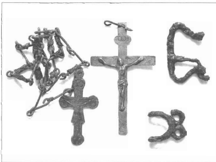
Novovjekovni nalazi iz grobova

S-2 postavljena je uz južnu stranu visokoga antičkog zida, koji je ujedno i sjeverna ograda groblja. Dimenzije sonde su 2 x 4 m. Već na samom početku je utvrđeno da je veći dio prostora koji zaprema sonda nasip što se sastoji od sitnoga šuta i rahle, svijetlo-