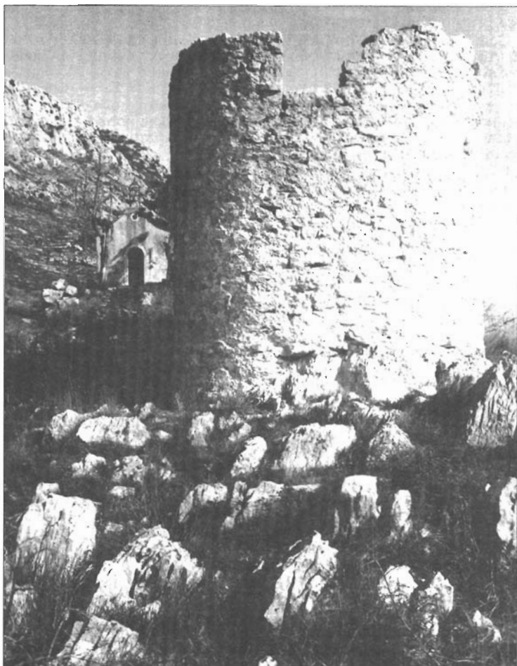
Stražarska kula u Lažanima iz vremena mletačko-turskih ratova

prvoga južnog pilona i apside, u sačuvanom mladem sloju deblje žbuke, uočljiv je otisak četvrtasta oblika. Vjerojatno je to trag nekadašnjeg stipesa ili rubne stepenice prezbiterija.