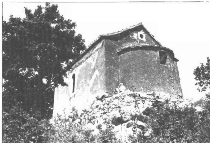
Sv. Mihovil u Lažanima, pogled s jugoistoka

nađen je i manji ulomak - vjerojatno stele, na kojemu je sačuvan ostatak trokutastoga završetka ukrasnog polja, sasvim izlizan, što upućuje da je prethodno bio iskorišten za ploču u nekom starijem podu.