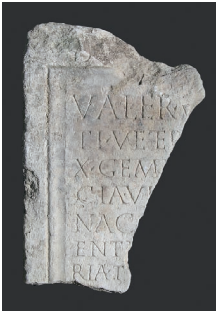
Slika 3. Stela Valerija Valenta (?)