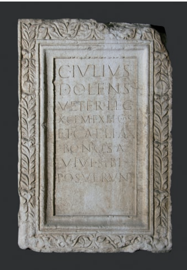
Slika 1a. Ara Gaja Julija Dolenta