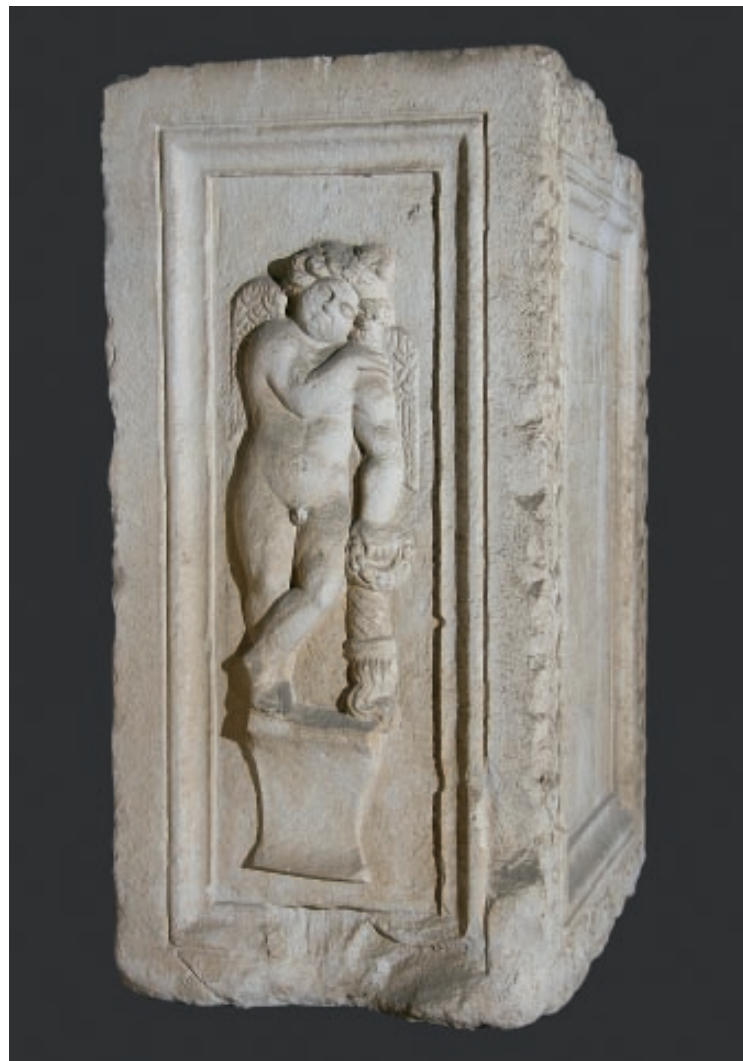
Slika 1b. Ara Gaja Julija Dolenta