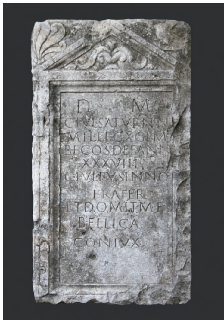
Slika 5. Stela Gaja Julija Saturnina

Saturnina je smrt zatekla u Saloni. Možda je tek došao u glavni grad provincije i u namjesnikovu oficiju čekao nove naredbe, koje su mogle biti vezane za rad u nekoj od postaja u unutrašnjosti. 83 Ipak, vjerojatnijim se čini da je službom bio vezan uz namjesnikov oficij, gdje je mogao obnašati različite zadaće. Natpisi iz ostalih dijelova Carstva spominju beneficijarije kao nadglednike namjesnikova kućanstva ( domicurator ), pomoćnike centuriona koji je bio na čelu namjesnikova stožera ( adiutor