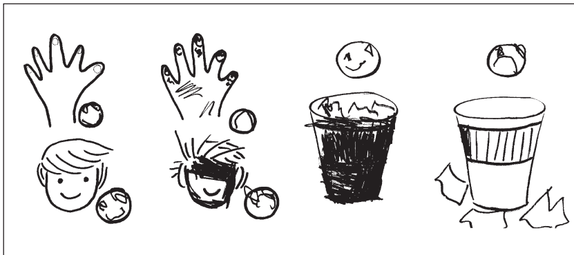
Slika 7 – Popunjeni evaluacijski listići uz temu uredno-neuredno.

U igri »Inspektori urednosti« F. A. je izvršno uočavao stvari u školi koje nisu bile na svom mjestu i pomogao ih je spremati (videozapis). Ispravno je popunio sve listiće na kojima je trebao nacrtati »smješka« za stvari koje su uredno složene i čiste, odnosno »plačka« za neuredno složene i prljave stvari, premda je pritom vidljiva njegova teškoća u pisanju zbog tremora ruke. Iz toga se može uočiti pozitivna promjena.