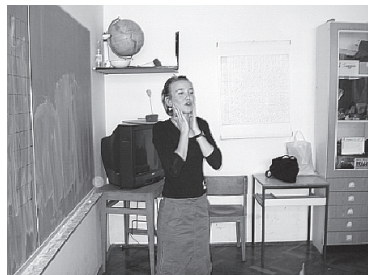
Slika 3 – Uredno