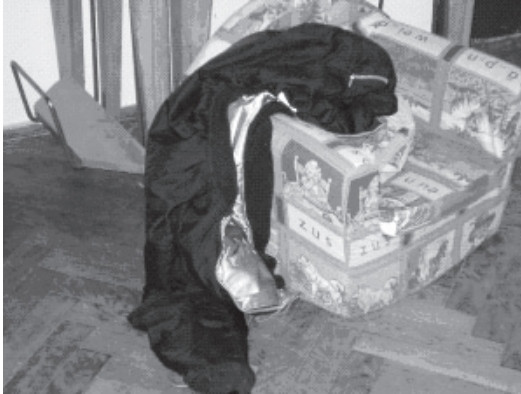
Slika 6 – Osobne stvari F. A. ostavljene na neprikladnom mjestu

se očitivalo kao učestalo ometanje razgovora. Često je u školu dolazio bez bilježnice, pernice, a znalo se dogoditi da dođe i bez torbe. Stvari je ostavljao na različitim neprikladnim mjestima (slika 6).