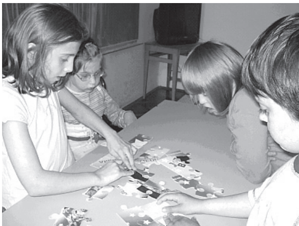
Slika 4 – Zajedničko slaganje puzzli