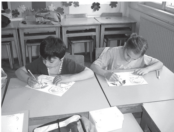
Slika 5 – Individualna nastavna aktivnost učenika

Kad sam u travnju 2005. preuzela vođenje prvog razreda, našla sam se pred nizom problema za koje nisam mogla pronaći primjerene odgovore: od toga da djeca nisu imala naviku sjediti u klupi, do zaokupljenosti svojim individualnim aktivnostima. Zajedničke igre u kojoj sudjeluje više od dvoje učenika gotovo da i nije bilo. Na kraju školske godine 2005./2006. neke stvari su se ipak znatno promijenile. Kad je to bilo potrebno, djeca su sjedila u školskim klupama, slijedeći upute i sudjelujući u zajedničkim i individualnim aktivnostima (slika 5). Kako su problemi u ponašanju bili najizrazitiji kod učenika F. A., M. B. i M. M., opisat ćemo promjene koje su uočene u njihovu ponašanju za vrijeme akcijskog istraživanja.