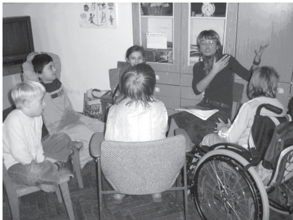
Slika 1 – Razgovor u krugu

sukob između M. M i V. N. M. M nije odgovarala blizina stolice na kojoj sjedi V. N. pa ju je pokušala udaljiti zajedno s V. N., na što je ona počela negodovati. Nakon toga je M. M. postala autoagresivna te je odbijala sudjelovati u nastavku aktivnosti, pri čemu je glavu uvukla pod svoju majicu ( http://www.ffos.hr/~bbognar/video/Problem.wmv ). Nakon tog sata razmišljala sam o ponašanju djece, nedostatku suradničkih odnosa, nedostatku povjerenja i razumijevanja. Pri donošenju pravila ključan je proces njihova dogovaranja , koji sadržava i komponentu razumijevanja posljedica nekog ponašanja (ako nekog lupimo, njega to boli, zato se nećemo tući). Moj kritički prijatelj Branko Bognar upozorio me da kod pravila koja su djeci nametnuta bez njihova razumijevanja, djeca ne mogu preuzeti odgovornost za vlastito ponašanje.