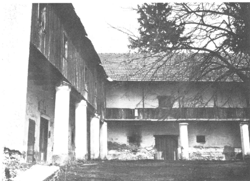
Veternica – Pavlinski ljetnikovac s dvorišne strane