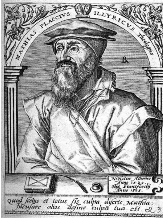
Matija Vlačić Ilirik (1520-1575).

Wittenberga. 9 Luther je bio na njihovu vjenčanju, čime je pokazao respekt i veliko priznanje Vlačiću. I Vlačić je visoko cijenio Luthera. “Lutherove su najbolje godine iza njega” izjavio je Vlačić. “Evo, to je naš stari, častan otac u Kristu, vjerni Božji čovjek i pravi Ilija, koji se kao neustrašivi junak borio pouzdano i sretno protiv Antikrista, svih vrsta krivovjerja i baala. Danas ili sutra će ga naš Gospodin Bog uzeti odavde” 10 (Olson, 2010, 60).