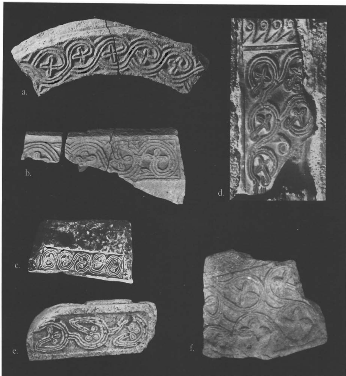
sl. 8. Vitice s trolistom u sredini: a. Bijaći (Sv. Marta, ulomak luka oltarne ograde), b. Solin (Sv. Petar i Mojsije, ulomak imposta), c. Solin (Gradina, ulomak nadvratnika), d. Terni (ulomak ciborija), e. Montefiascone (ulomak pluteja), f. Otricoli (ulomak pilastra).

istočnoj jadranskoj obali (sl. 8b, 8c, 9d) 62 , a upadljivo češće na Apeninskom poluotoku. Od brojnih tamošnjih analogija, u ovoj prigodi upozoravamo samo na one koje je izravnije stilski moguće uspoređivati s našima iz Sv. Marte. Jednoprute ili višepolute vitice s trolistom u sredini dobro su usporedive s onima na ulomku ciborija iz Ternija (sl. 8d) 63 , zatim na ulomku pluteja iz Montefiascone (sl. 8e) 64 , na nedefiniranim ulomcima iz Otricolija (sl. 8f) 65 , te na fragmentu ciborija iz Zuglia nedaleko Tolmezza u