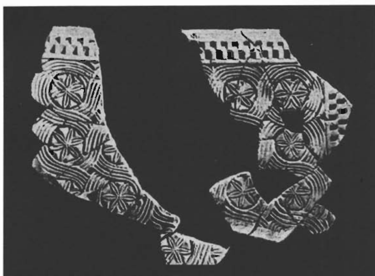
sl. 7. Rekonstrukcija pluteja iz Zenice (prema Đ. Basleru).

ornamenata, posebno upozoravamo na motive dvoprute vitice unutar koje su motivi trolista 60 . Upravo taj ukras, izveden u različitim inačicama, najčešći je ornament na skulpturama ranog srednjeg vijeka, poglavito 8. i početka 9. stoljeća u Italiji.