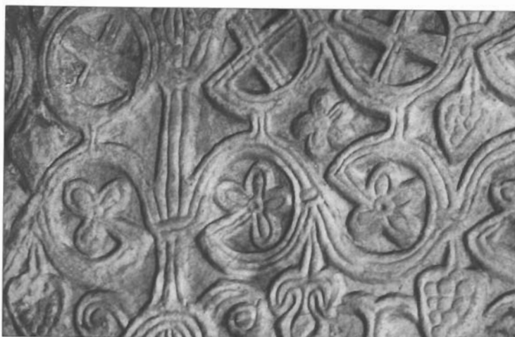
sl. 10. Genova (S. Maria di Castello, plutej).

< sl. 9. Vitice sa središnjim križnim završetkom: a - c. Bijaći (Sv. Maria, ulomak pilastra i luka oltarne ograde), d. Trilj (ulomak pilastra), e. Panisperna (S. Lorenzo, pilastar oltarne ograde), f. Rim (Museo dell'Alto Medioevo, ulomak ciborija), g. Anghiari kod Arezza (S. Maria a Miciano).