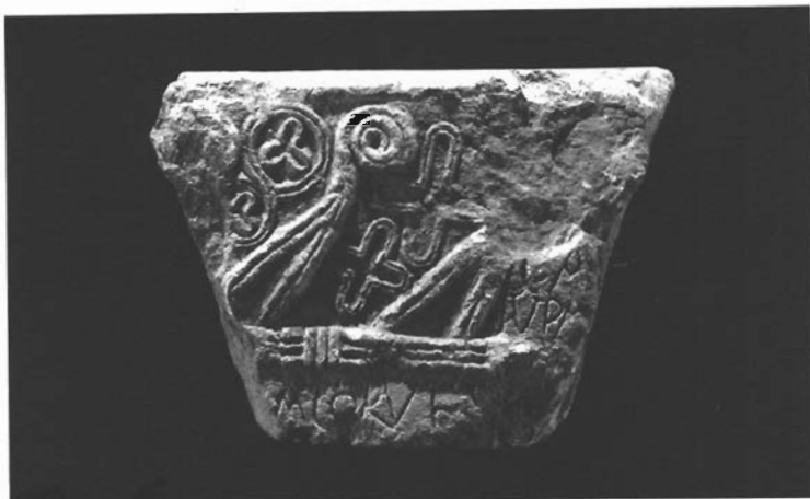
sl. 13. Ulomak ukrašene ranosred-njovjekovne grede s natpisom iz crkve Sv. Marte.

regionalnu proizvodnju, vrlo vjerojatno po zajedničkim uzorima i zadanim shemama u obje sredine.