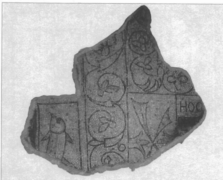
sl. 11. Vitice sa trojlistom u sredini na mozaiku iz crkvice nedaleko Asola kod Trevisa.

Friuliju 66 . Za ornament križeva umjesto trojlista u sredini upućujemo na vrlo slične ornamente na pilastrima iz rimske crkve S. Lorenzo in Panisperna (sl. 9e) 67 , na ulomku ciborija iz Museo dell'Alto Medioevo u Rimu (sl. 9f) 68 i na ulomku iz crkve S. Maria a Micciano kod Anghiarija nedaleko Arezza (sl. 9g) 69 .