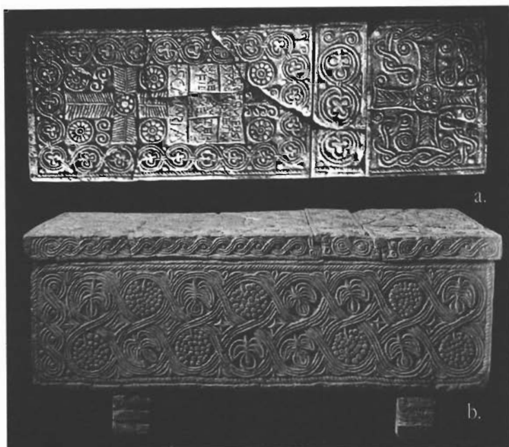
sl. 6. Gubbio, sarkofag u Palazzo dei Consoli: a. poklopac, b. prednja strana.