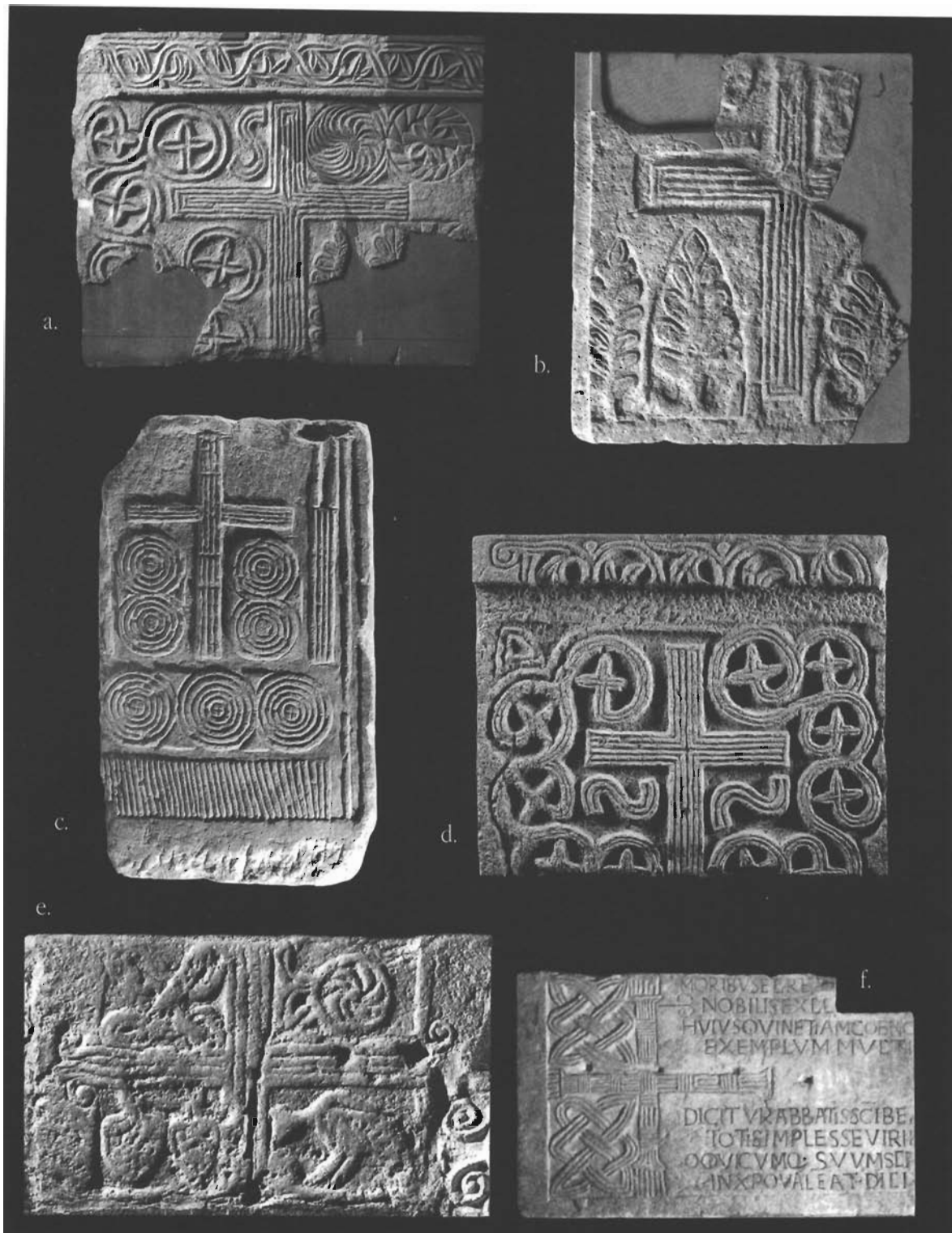
sl. 3. Višepruti križevi na pluteji- ma oltarnih ograda: a - b. Bijaći (Sv. Marta), c. Gala kod Sinja, d. Čiovo (Sv. Andrija), e. Corsignano kod Pienze (San Vito), f. Brescia (Museo Cristiano).

spomenika povezuje i nevjesta klesarska obrada. Pretpostavlja se da novigradski plutej pripada prvoj ranosrednjovjekovnoj obnovi katedrale koja se zbila krajem 8. stoljeća 33 . Stilski gotovo identičan ornament troprutih križeva upisanih u iste takve kružnice, jednako nevjesto izveden, nalazi se i na jednome pilastru iz crkve Sv. Blaža