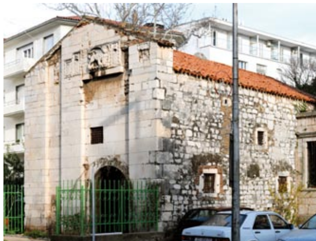
5. Zadar, Kaštel, "Mali Arsenal"

raskuštrana griva spušta mu se preko čitavog prednjeg dijela tijela, a čuperci dlaka pokrivaju i stražnje dijelove nogu. Lijevo krilo, zajedno sa smotanim repom, vješto popunjava prostor u gornjem lijevom kutu pravokutnika, a desno je u zbijenom prostoru pokraj glave naglašeno tek djelomičnim, ali snažnim izbijanjem u prostor. Začudo, unatoč sasvim očiglednim likovnim kvalitetama, ovaj lav je u stručnoj literaturi prošao gotovo nezapaženo. I. Petricioli izražava tek žaljenje što nisu sačuvani grbovi koji bi mogli pomoći u dataciji ovoga dijela kaštela, ali se ne upušta u pokušaj stilskog i kronološkog određenja reljefa krilatog lava. 17 A. Rizzi ga datira u početak 15. st. (nakon 1409.), 18 no, čini se, sasvim okvirno, temeljem podataka o utvrđi, a ne temeljem likovne i ikonografske analize. L. Borić ga ne uvrštava u svoj katalog renesansnih skulptura, 19 oslanjajući se na Rizzijevu dataciju i karakterističan gotički okvir. 20 Ipak, neki likovni elementi upućuju na moguću nešto kasniju dataciju, bliže sredini 15. stoljeća, pa i na nekog od istaknutijih skulptora u onodobnoj Dalmaciji. Dakako, za skulpturu ovakve razine kvalitete moglo bi se pretpostaviti da je izrađena u nekoj od mletačkih