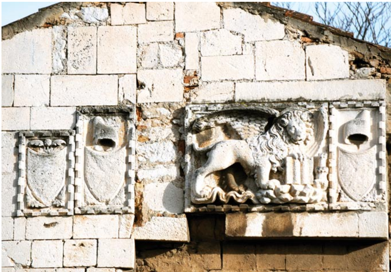
6. Zadar, Kaštel, "Mali Arsenal", detalj

radionica i dopremljena u Zadar, no čini se da je reljef lava načinjen od istoga kamena od kojeg je sagrađeno cijelo pročelje "Malog arsenala," 21 što bi ipak upućivalo na