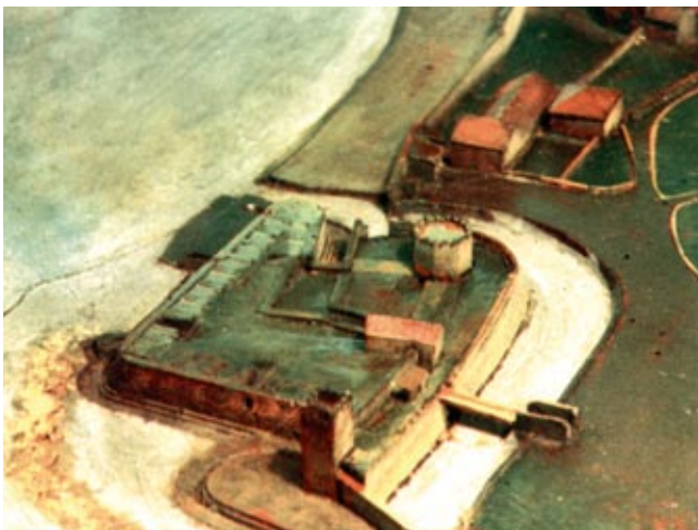
3. Maketa Zadra u Museo Storico Navale u Veneciji, oko 1570.), detalj Model of Zadar in Museo Storico Navale, Venice around 1570, detail

koje otkriva karakteristične elemente srednjovjekovnih ulaza u utvrde s pomičnim mostovima. 15 Zidano je velikim, precizno klesanim blokovima kamena, što jasno