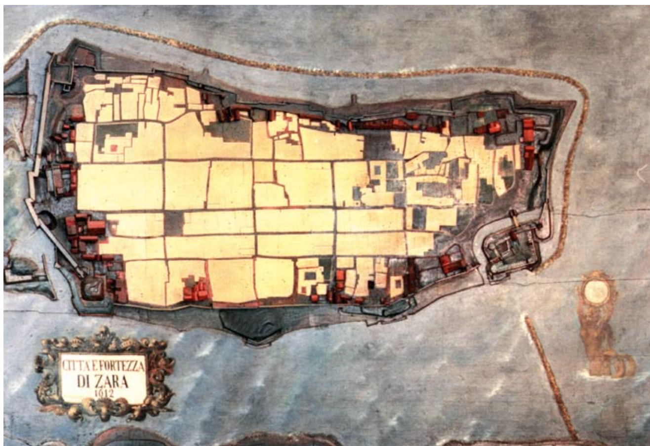
2. Maketa Zadra u Museo Storico Navale u Veneciji, oko 1570.

Među sačuvanim ostacima nekadašnjeg kaštela najupečatljiviji dio predstavlja pročelje "Malog arsenala",