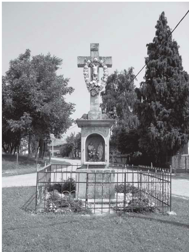
RAVENSKI PAVLOVEC, raspelo u centru sela, na križanju glavnih cesta

Raspela podizana kao osobni zavjeti s vremenom postaju dijelom zajednice koja se pokraj njih moli, zapali svijeću i sl. Raspela podignuta kao osobni zavjeti nalaze se u selima Novi Bošnjani, Gornja Brckovčina, zaselak Heruci, Mali Potočec.