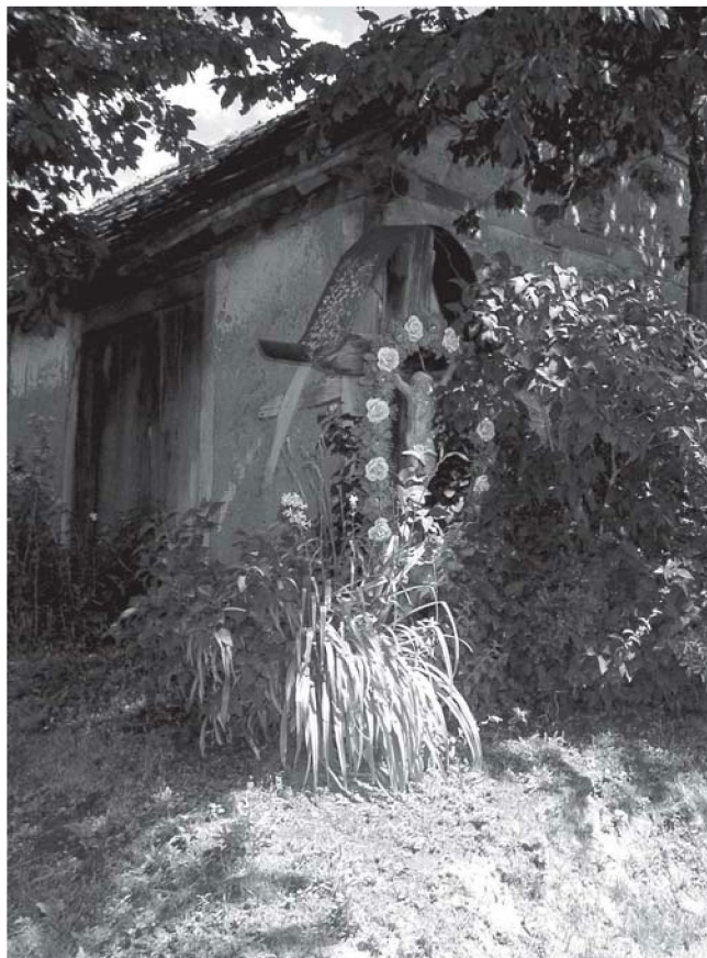
SVETA HELENA, raspelo uz put u vinogradu

bude viđen, iza nas su. Tada se selom pozdravljalo Falen Isus i Marija , a pred raspelom se obavezno prekrizilo, muškarac bi podigao šešir ili kapu uz kimanje glavom, ponekad se pomolilo i nastavilo se dalje, u polje na okapanje ili rad u gorice. Bicikli su ubrzali prolazak kroz selo te se i uz raspelo prošlo brže, uz podizanje šešira i brzo križanje. A danas - da li ih uopće zamjećujemo? Vozeći se automobilima zasigurno ih ne primjećujemo, a za križanje sebe ili djeteta koje vozimo nema niti spomena, dok jednom rukom vozimo auto, a u drugoj držimo mobitel, dogovarajući novi sastanak ili posao. A raspelo kraj kojega smo upravo prošli, stoji na mjestu križanja putova zauvijek, prateći nas milosnim i šticeničkim pogledom Rasketoga. Iako smo prošli ne primjećujući ga, svjesni smo da nas cijelim našim putem prati taj milosni pogled Rasketoga. Kada ga zatrebamo na križanjima i raskršćima životnih putova, pogledajmo iznova u raspelo kraj kojega svaki dan prolazimo ne zamjećujući ga, jer je navek tu, i sjetimo se da svatko od nas nosi svoga križa, a netko i cijelu kapelu.