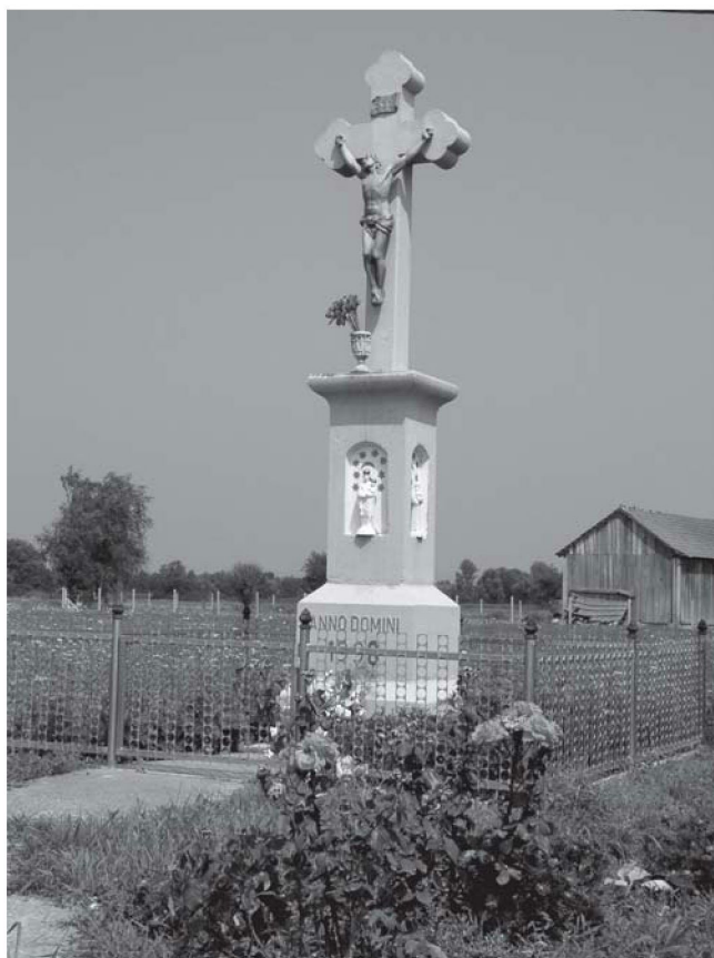
SREDNJI DUBOVEC, raspelo podignuto 1995. godine na mjestu gdje nije bilo raspela nikada