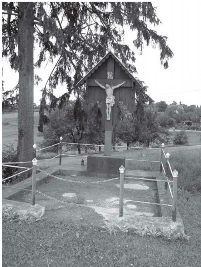
DONJE KRIŽEVČINE, drveno raspelo

Seoski križevi i raspela su također jedan od oblika javne plastike koji daje prepoznatljivost određenom krajoliku, a kao takvi u Europi su poznati još od ranog srednjeg vijeka, kada su podizani uz putove. Drvena raspela poznata su i podizana na cijelom području Hrvatske, a njihovu se pojavu, npr. u Slavoniji, bilježi već od kraja 17. stoljeća (Španiček 1995). Kada su se na našem području postavili prvi križevi, ne znamo, ali prema kazivanju i sjećanju nekoliko najstarijih kazivača (danas osamdesetogodišnjaka) 1 bilo ih je, kako sami kažu: Od kada se sjećaju, navek su stali tu . Sanja Cvetnić drži kako je u sjeverno-hrvatskim krajevima učestalije obilježavanje krajolika javnim znamenjem, u ovom slučaju raspelima, započelo u doba katoličke obnove, u 17. i 18. stoljeću (Cvetnić 2002, 42). U župnim Spomenicama župa, u kojima se nalaze sela na obrađivanom području, nije nađeno nešto više podataka o vremenu, tj. godini postavljanja raspela na pojedinim mjestima. Iz nepoznatih razloga, takvi