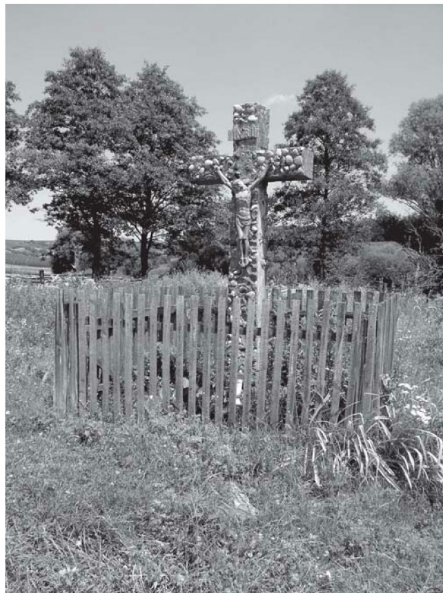
APATOVEC, raspelo od batude u zaselku Brežanci

Prostor oko raspela je gotovo u pravilu ograđen ogradom, drvenom ili željeznom, unutar koje je posađeno ukrasno grmlje ili stablo, a najučestalije cvijeće. Uglavnom su to: ruže, ruže penjačice, tulipani, irisi, neveni, ljiljani te brojno drugo cvijeće čiji izbor ovisi, dakako, o ukusu onoga koji taj okoliš uređuje. Ipak su najbrojniji ljiljani, kojih ima kod gotovo svakoga raspela, te ruže, uglavnom crvene i bijele boje. Kako svaka vrsta cvijeća ima svoje značenje, te se npr. ljiljan smatra cvijetom Blažene Djevice Marije, a ujedno je i simbol čistoće; crvena ruža simbolizira mučeništvo, a bijela čistoću kao i ljiljan (Leksikon 1990.), i razumljivo je da su se našli uz raspelo i Raspetoga. Uz cvijeće u prostoru oko raspela sadi se i drveće. Javlja se nekoliko vrsta drveća: bor, čempres, tisa, razno grmoliko žbunje, zatim hrast koji se shvaća kao drvo života i os svijeta, a inače zauzima središnje mjesto u vjerovanjima kod