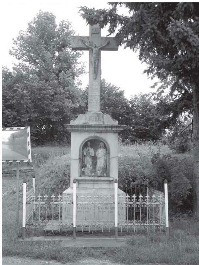
PODGAJEC, raspelo s nišom

corpusom. Svi oni imaju i zapise na postolju i na donjemu dijelu križa. Ovi tekstovi uglavnom su zapisi godine kada su podignuti i tko je financirao postavljanje. Izrađeni su od kulira koji je još ponegdje zadržao i boju.