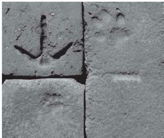
Sl. 1. Primjerci opeka s otiscima nogu kokoši, psa (s utisnutim slovom l) i mačke izrađivanih u poljskim ciglanama

Za proizvodnju i pečenje cigle i crijepa u 18. stoljeću interesantan je Gospodarski pravilnik ( Regulamentum domaniale ) Ivana Adamovića iz 1774. godine, napisan mješavinom kajkavštine i ikavštine. 2