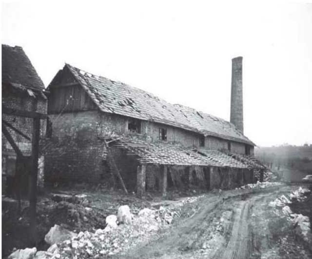
Sl. 8. Fotografija ciglane obitelji Santo prije rušenja 1982.