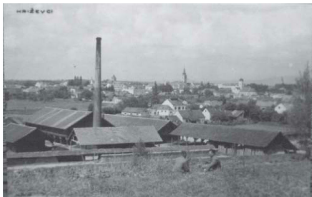
Sl. 3. Grahorova ciglana na razglednici poslanoj 1931. god.; snimak vjerojatno stariji

tvrtke 1936.-1948. bjelovarskog suda, s pozivom na spis R 485/02. Vjerojatno je u tim rokovima likvidirana i Narodna Štedionica u Križevcima, kao svojevremeni vlasnik nekadašnje Grahorove ciglane.