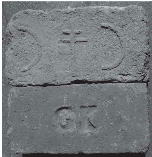
Sl. 4. Opeke Gradske ciglane: gornja opeka s obzirom na veličinu koji prelazi austrijski format i na ispupčene simbole na plošnoj površini, može se svrstati u najraniji proizvod varoške ciglane. Dvostruki križ iz gradskog grba Križevaca s obrnuta dva slova C mogu se tumačiti kao Ciglan Crisiensis, što navodi na pretpostavku da je to opeka iz 18. stoljeća, a možda i ranije. Donja opeka austrijskog formata, sa slovima GK (Grad Križevci) potječe unutar razdoblja, od izgradnje kružne peći 1910. do donošenja novog formata opeke 1932. godine.

Ovim podacima o zaposlenima, zaključuje se prikaz razvoja nekadašnje "varoške" ciglane i njeno djelovanje, popraćeno s uspjesima i financijskim krizama, te statusnim promjenama, prema dostupnim zapisima u nizu od preko 150 godina.