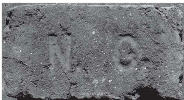
Sl. 2. 10peka austrijske mjere iz ciglane Nikole Grahora, izradena između 1912. i 1916.

Sudski predmet o postupku likvidacije Štedionice nije pronađen u izvanparničnim predmetima "R" od 1947. do 1950. u Državnom arhivu u Bjelovaru, gdje se nalaze spisi Kotarskog suda Križevci iz tog vremena, kao niti registar Kotarskog suda Križevci u koji je upisana likvidacija.