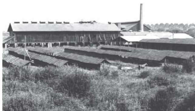
Sl. 5. Pogled na nekadašnju Gradsku ciglanu oko 1979. (srijeda: kellersušare za sušenje sirove cigle u gričama; lijevo šupa za sušenje crijepa izgrađena 1935., iza tvorničkog dimnjaka tunelska peć podignuta 1941.)