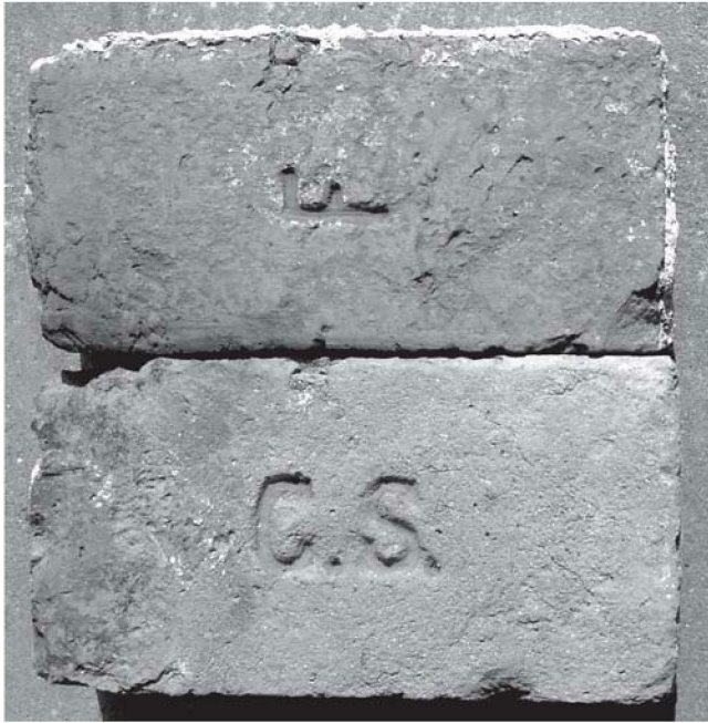
Sl. 7. Opeke austrijskog formata Ciglane Santo: gornja (F- Ferdinand Santo) iz prvih godina rada ciglane; donja (C. S. -Ciglane Santo) iz kasnijih godina uhodane proizvodnje.