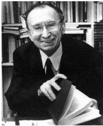
Sl. 1: Arnaldo Dante Momigliano (1908.-1987.)

Prošle je godine bila stota godišnjica rođenja jednog od najznačajnijih istraživača stare povijesti – Arnalda Dantea Momigliana. Talijansko-engleski povjesničar židovskog podrijetla svojim je djelima doprinio boljem razumijevanju antike i brojnih aspekata povijesne znanosti. Prije svega, ovdje mislim na njegov teorijski rad o povijesnoj znanosti, kojim je utro put novim stavovima i mišljenjima o razvoju ljudskoga društva i djelatnosti tijekom povijesti.