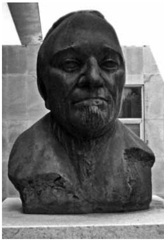
Sl. 1: Bista Stjepana Gunjače

Stjepan Gunjača je uvaženi hrvatski povjesničar, arheolog, konzervator i muzealac. Rođen je u Sinju 28. IX. 1909. godine, a umro je u Splitu 6. XII. 1981. Osnovnu i srednju školu pohađao je u rodnome gradu. Nastavlja svoje školovanje u Zagrebu, gdje upisuje studij povijesti i geografije koji završava 1933. godine. Te iste godine, ubrzo nakon apsolvature, počinje i njegov rad u Muzeju Savske i Primorske banovine u Kninu, 1 koji bi se mogao opisati kao dosta buran. Na mjesto kustosa predlaže ga njegov profesor Grga Novak. Već na samom početku njegovog djelovanja kao kustosa, u muzeju se javlja potreba za preseljenjem zbirke u adekvatnije prostore. Tako je zbirka zahvaljujući njemu, iz franjevačkog samostana, preseljena u kninsku tvrđavu već 1934. godine. Traženje odgovarajućeg smještaja za zbirku muzeja uvelike će obilježiti njegovo djelovanje, što više, postat će njegov životni projekt. Otvaranjem zgrade MHAS-a 1976. u Splitu zasigurno se ostvaruje jedan od zadanih ciljeva u životu, ali i zatvara vrlo važno poglavlje jer će Gunjača na sam dan otvaranja nove zgrade uručiti