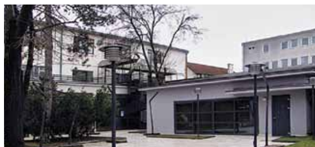
Prenamijenjeni prostori negdašnje Tvornice pokućstva »Bothe i Ehrmann« u Savskoj cesti, 2012. godine

Aerial of the former »Bothe and Ehrmann«