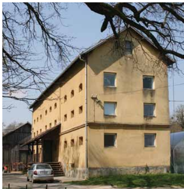
Prenamijenjena zgrada bivše Svilane u Maksimiru 2010. godine, (Fototeka GZZSKP)

smještena u središnjoj osi južnoga pročelja, a pred njima je povišeni drveni trijem natkriven jednostrešnim krovom. Unutrašnje su prostorije služile za čahure svilene bube, dok su danas prenamijenjene u skladišne prostore.