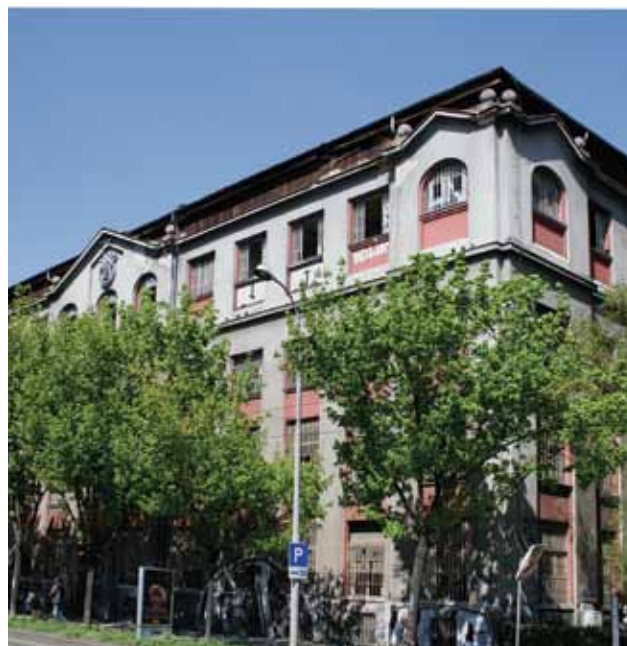
Tvornica »Penkala« (»Nada Dimić«) u Branimirovoj ulici, 2012. godine

Konzervatorske propozicije za obnovu i čuvanje Tvornice »Penkala« izdane su 2003. godine postupkom izdavanja lokacijske dozvole za prijedlog rekonstrukcije povijesne graditeljske strukture tvornice »Penkala« s adaptacijom i prenamjenom ulične i dvorišne zgrade u poslovni sklop, te izgradnjom podzemne garaže. 41 Sa stajališta zaštite kulturnih dobara uvjetovano je sljedeće: oblikovanje pročelja ulične uglovnice i dvorišne zgrade treba predvidjeti obnovom elemenata pročelja, pri čemu se misli na ožbukane dijelove i karakterističnu drvenu stolariju, uz interpretaciju dekorativnih oblikovnih elemenata na parapetima uličnih pročelja, a sve izrađeno sukladno arhivskoj dokumentaciji arhitekta Rudolfa Lubynskog iz 1919. godine. Nadalje je propozicijama uvjetovano projektiranje nadogradnje na dvorišnoj strani bez otvora na zapadnoj međi, kao i oblikovno usklađenje s postojećom građevinom, u pogledu materijala i završnih obrada.