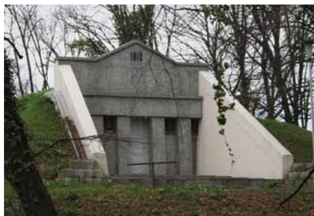
Vodospreme gradskog vodovoda na Jabukovcu, 2010. godine

City waterworks reservoirs in Jabukovac, 2010.