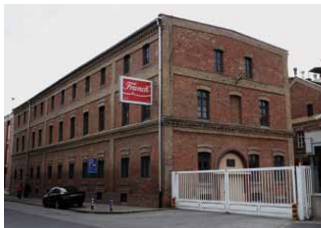
Dio sklopa današnje tvornice »Franck« u Vodovodnoj 20, 2012. godine

Predmetni se industrijski lokalitet također nalazi na području kulturnog dobra Povijesna urbana cjelina grada Zagreba , na dijelu za koji je utvrđen sustav zaštite »B«. Za područje za koje je utvrđen rečeni sustav određen je režim zaštite osnovnih elemenata povijesne urbane strukture, pejzažnih vrijednosti, te pojedinih skupina i pojedinačnih povijesnih građevina, unutar kojih je potrebno očuvati sva bitna obilježja strukture. Konzervatorske se propozicije zaštite za tvornicu »Franck« u Vodovodnoj ulici stoga usmjeruju na sklop izvornih i do 1927. godine dograđenih građevina, a ne na kasnije dogradnje.