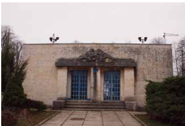
Vodocrpilište u Botaničkom vrtu, 2010. godine Waterworks in the Botanical Gardens, 2010

Dva desetljeća mlađa vodosprema na Lašćini iz 1932. godine djelo je arhitekta Jurja Denzlera. 44 Isti je arhitekt 1933. – 1934. godine ostvario i skladan sklop vodocrpilišta u Botaničkom vrtu, koje se nalazi pod višestrukom zaštitom. 45 Botanički je vrt, naime, kao spomenik parkovne arhitekture registriran 1971. godine, a kao dio Zelene potkove zaštićen je godine 2004. i kao kulturno dobro.