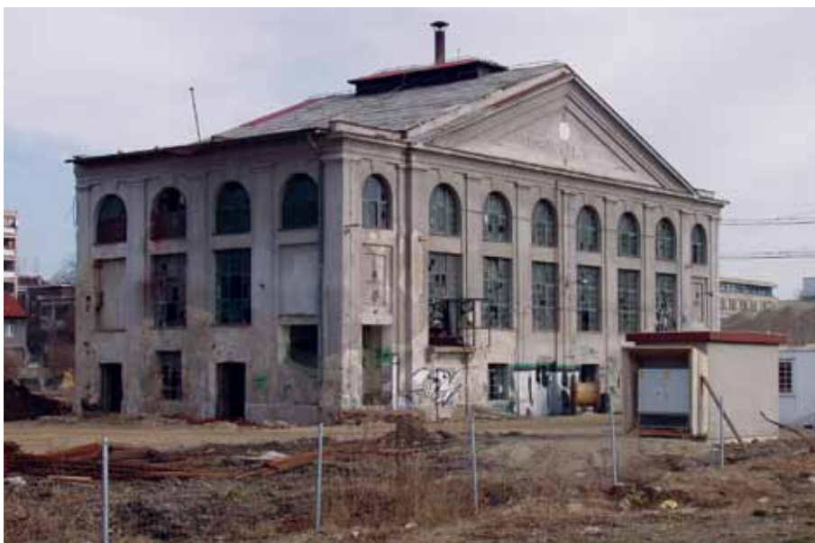
Zgrada kotlovnice i strojarnice negdašnje »Prve hrvatske tvornice ulja« u Branimirovoj ulici, 2010. godine

Boiler room and engine room of the former »First Croatian Oil Factory«, Branimirova, 2010