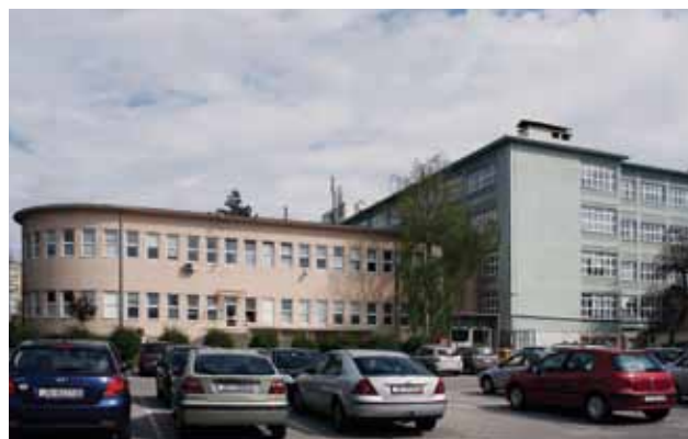
Današnja tvornica »Ericsson - Nikola Tesla« u Krapinskoj ulici broj 45. 2012. godine, (foto: Gordana Jerabek)

Manja je sjeverna zgrada danas u funkciji ambulante i toplinske stanice, a u prislonoj i povezanoj većoj južnoj zgradi danas su institut i restoran. Građevina negdašnje »Samospojne središnjice i pošte« sačuvani je primjer industrijske arhitekture kvalitetnih funkcionalnih i oblikovnih rješenja realiziranih prema načelima »moderne« arhitekture s izražajnim autorskim obilježjima arh. Stjepana Planića.