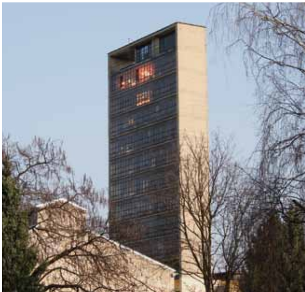
Probni toranj Tvornice električnih žarulja »TEŽ« u Folnegovićevoj ulici, 2010. godine

Testing tower of the Electric Light-bulb Factory »TEŽ«, Folnegovićeva, 2010