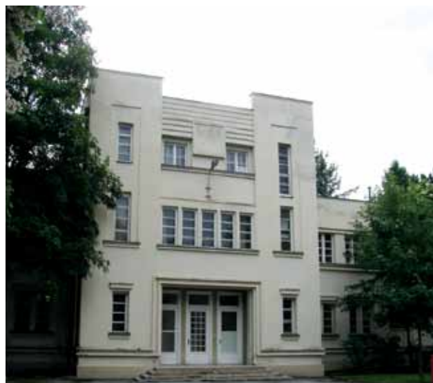
Prenamijenjena pristanišna zgrada »Aerodroma Borongaj« 2011. godine, (Fototeka GZZSKP)

Graditeljski fond bez posebnih obilježja čine naknadno izgrađene građevine, prigradnje i nove tvorničke hale, za koje su moguće opsežnije rekonstrukcije, prenamjene, uklanjanje i nova izgradnja. Hortikulturnim je uređenjem uvjetovano očuvanje izvornih značajki kvalitetnoga pejzažnoga prostornog koncepta.