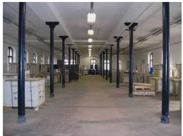
10 Interijer Tvornice duhana Zagreb u Klaićevoj ulici, 2005. godine (Fototeka GZZSKP-a)

kraljevske ugarske Tvornice duhana u Zagrebu očuvana u cijelosti. Tvornica duhana u Zagrebu, koja je dvadesetak godina starija od negdašnje Tvornice koža, jedina je cjelovito očuvana građevina industrijske arhitekture druge polovine 19. stoljeća, iznimnih konstrukcijskih i oblikovnih obilježja. Trenutačno je u tijeku njezina prenamjena u Hrvatski povijesni muzej, prema projektima rekonstrukcije i prilagodbe novoj namjeni, koje je izradio projektini tim arhitekta Ivice Plaveca.