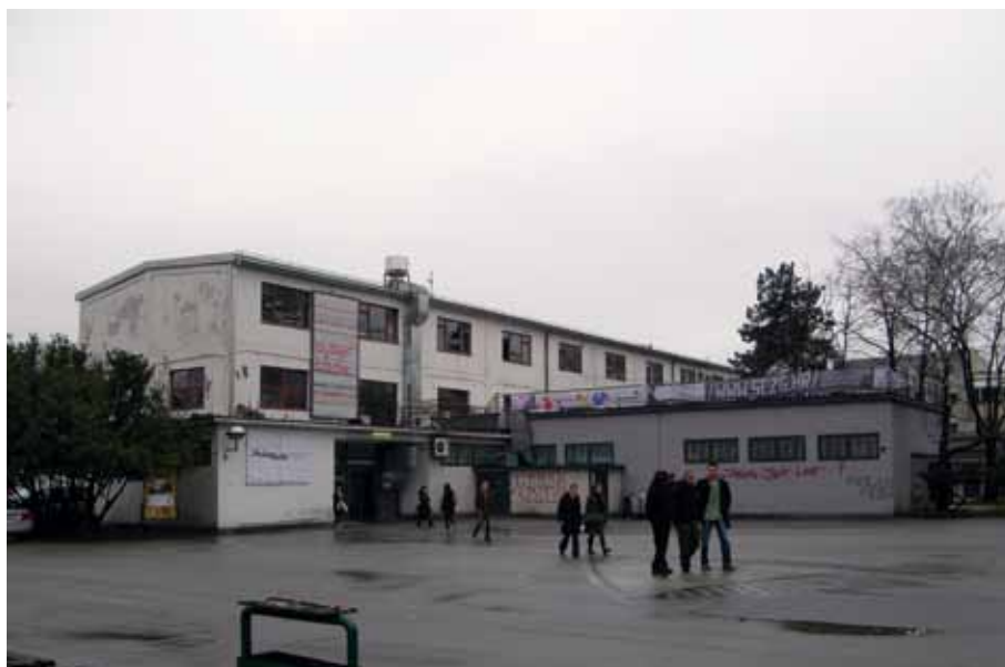
Prenamijenjeni prostori negdašnje Tvornice pokućstva »Bothe i Ehrmann« u Savskoj cesti, 2009. godine

Reassigned facilities of the former »Bothe and Ehrmann« Furniture Factory, Savska, 2009