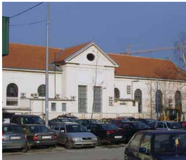
Prenamijenjena zgrada negdašnjeg sklopa Plinare u Radničkoj ulici 2008. godine, (Fototeka GZZSKP)

adaptacija ostala znatno izmijenjenog izvornog industrijskog graditeljskog sklopa. Industrijski sklop Gradske plinare, s obzirom na graditeljska i oblikovna obilježja, te stupanj očuvanosti izvorne građe, posjeduje obilježja povijesne graditeljske strukture vrijedne očuvanja.