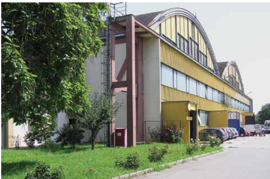
Prenamijenjeni avionski hangari na Borongaju, 2005. godine

Changed purpose of airplane hangers in Borongaj, 2005