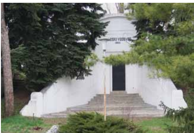
Vodosprema gradskog vodovoda u Gornjem Prekrižju, 2010. godine

City waterworks reservoir in Gornje Prekrižje, 2010