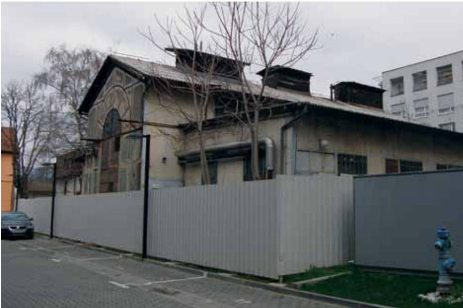
Pogonska zgrada negdašnje Tvornice svijeća »Iskra« u Bužanovoj ulici, 2008. godine

Workshop building of the former candle factory »Iskra« in Bužanova Street, 2008