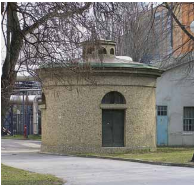
Strojarnica zdenca »Gradskog vodovoda« u Zagorskoj ulici, 2010. godine

GZZSKP je trenutačno stavio pod preventivnu zaštitu dva kulturna dobra za koja se predmnijeva da imaju svojstva kulturnog dobra, premda su u pripremi zaštite i preostale vrijedne gradske industrijske arheologije.