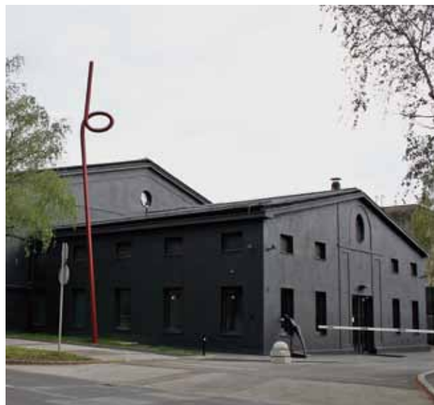
Zgrada negdašnje jahaonice Konjaničke vojarne (hale »TKZ«) prenamijenjena u privatnu galeriju »LAUBA«, u Gradišćanskoj ulici, 2012. godine

gođena za skladišni prostor tvornice) očuvala je izvorna i prepoznatljiva graditeljska i oblikovna obilježja. Godine 2011. prenamijenjena je u galerijski prostor.