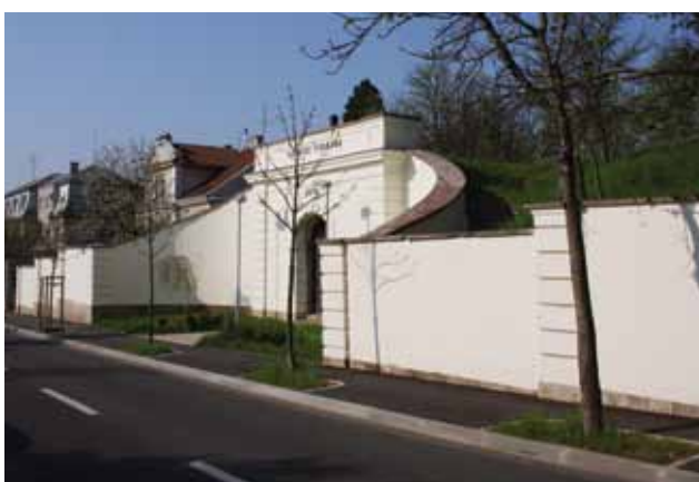
Vodosprema gradskog vodovoda u Jurjevskoj ulici, 2010. godine

Vodosprema je iz godine 1878. danas u funkciji Gradskog vodovoda i odvodnje. 42