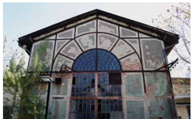
Pogonska zgrada negdašnje Tvornice svijeća »Iskra« u Bužanovoj ulici, 2012. godine

nu. Kao očuvani primjer industrijske arhitekture dvadesetih godina 20. stoljeća odlikuje se kulturno - povijesnom, graditeljsko - tipološkom, arhitektonskom i ambijentalnom vrijednošću. Naknadno se tvornički sklop kontinuirano razvijao i proširivao različitim tvorničkim sadržajima poput tvornica »Lim« i »Biserka« sve do 2004. godine, kada je na većem dijelu tvorničkoga sklopa izgrađeno stambeno naselje, a ulična je zgrada negdašnje tvornice igračaka »Biserka« dograđena, rekonstruirana i adaptirana kao poslovni prostor, uz konzervatorski nadzor kojim se osiguralo očuvanje njezine ambijentalne vrijednosti.