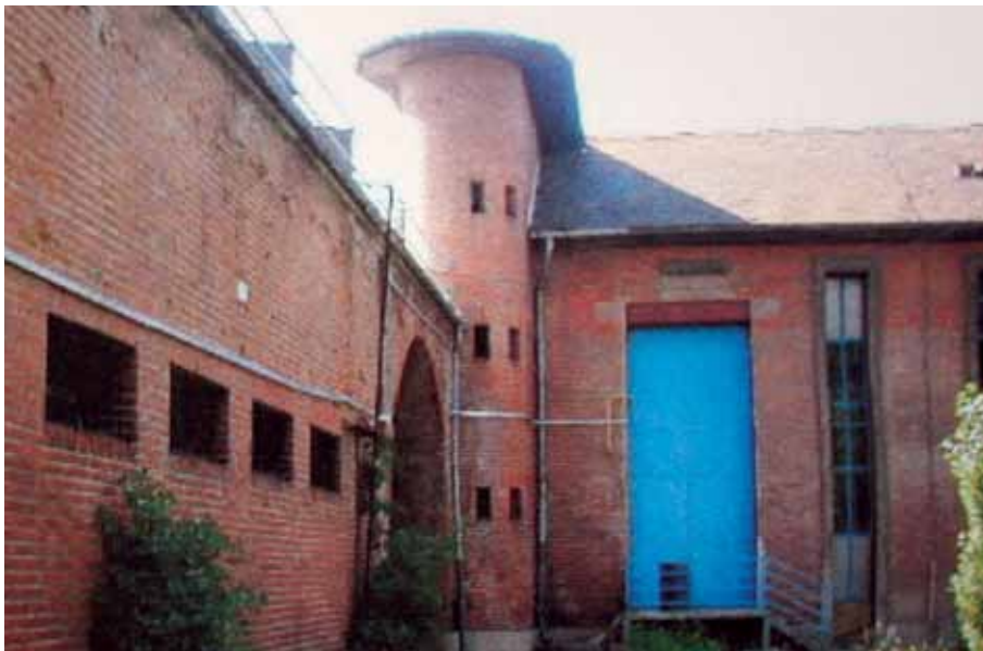
3 Istočno (unutarnje) pročelje Klaonice u Heinzlovoj ulici, 2001. godine

Eastern (interior) facade of the slaughterhouse in Heinzlova Street, 2001