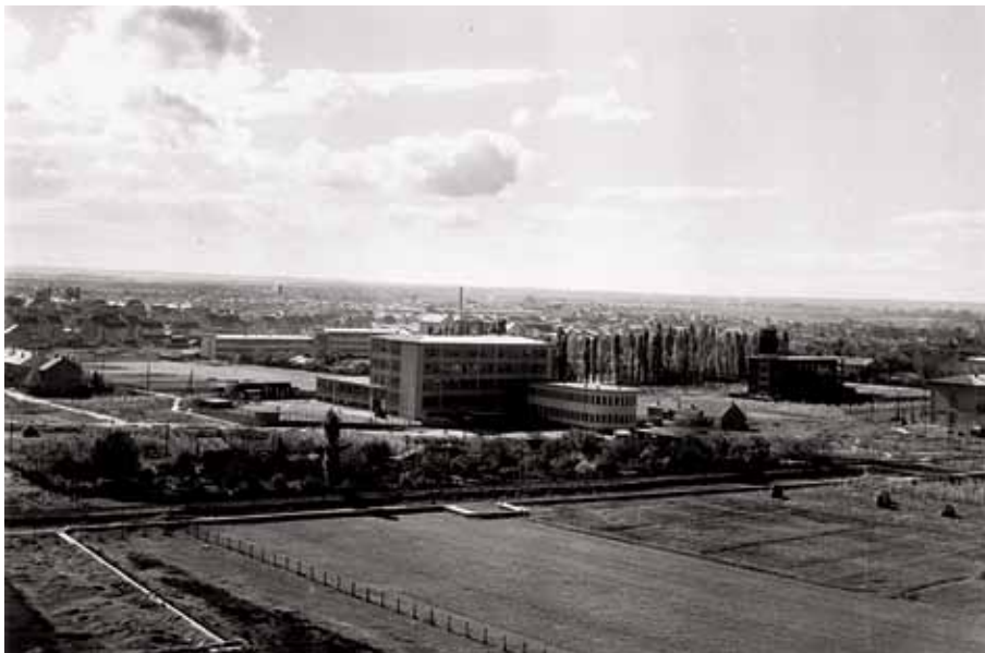
Negdašnja Samospojna središnjica i pošta u Krapinskoj ulici, 1953. godine

Front page of the conservation study on the former self-standing headquarters and post office in Krapinska Street, 2001