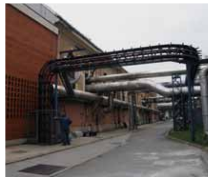
Južni zid zgrade negdašnje »Munjare« u Zagorskoj ulici 2010. godine, (Fototeka GZZSKP-a) South wall of the building of the former »Munjara«, Zagorska, 2010 (Photo archives of GZZSKP)

Primjenom kriterija utvrđenih u konzervatorskoj dokumentaciji za GUP grada Zagreba utvrđeno je da nema osnove za donošenje rješenja o zaštiti sklopa kao kulturnog dobra, ali je neupitno utvrđeno obilježje povijesne strukture vrijedne očuvanja kod strojarnice zdenca za koju je naknadno doneseno i rješenje o preventivnoj zaštiti. 27 Ambijentalnom je vrijednošću obilježen i ulazni dio ograde sklopa, kao i jugoistočna vizura na južni zid zgrade »Munjare« koji je jedini ostao očuvan u izvornom oblikovanju.