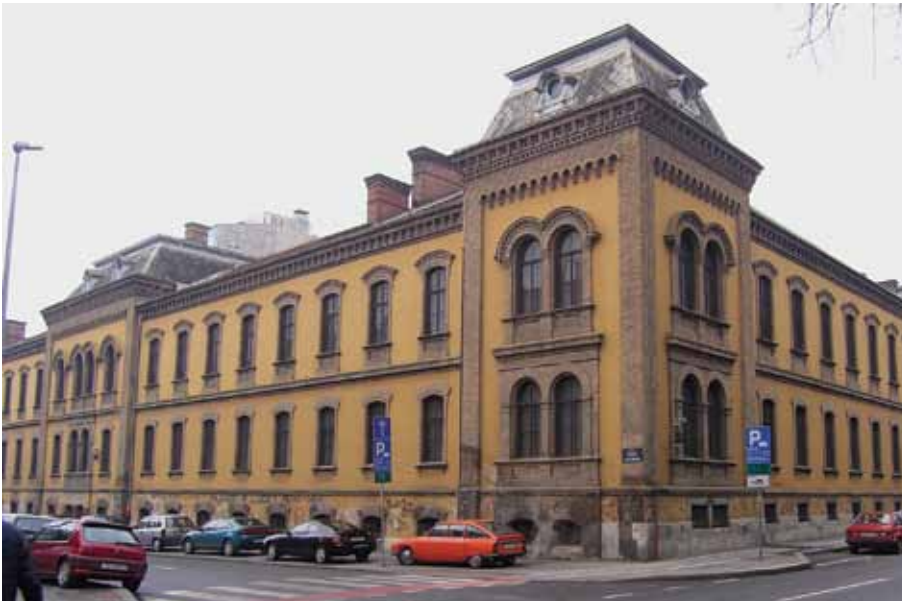
Pogled sa sjeveroistoka na Tvornicu duhana u Klaićevoj ulici, 2005. godine

Front page of the conservation study for the Tobacco Factory in Klaićevo Street, 2005