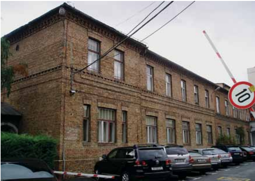
Upravna zgrada »Zagrebačke pivovare« u Ilici, 2003. godine

Administrative building of »Zagrebačka pivovara« (Zagreb Brewery) in Ilica Street, 2003