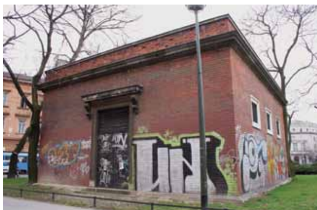
Transformatorska stanica na Rooseveltovu trgu, 2010. godine Substation on Roosevelt Square, 2010