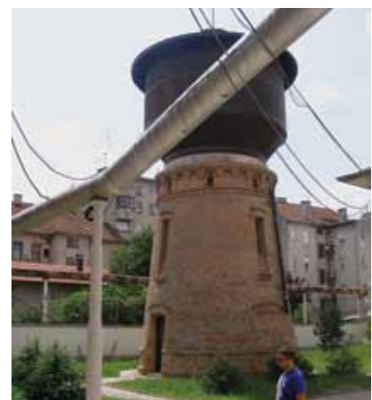
7 Obnovljeni vodotoranj »Zagrebačke pivovare« u Ilici, 2011. godine Reconstructed water-tower of »Zagrebačka pivovara« in Ilica Street, 2011

Sklop tvorničkih zgrada pivovare potkraj 19. i početkom 20. stoljeća tvorio je funkcionalnu i skladno komponiranu cjelinu, ali je zbog mnogobrojnih pregradnji i adaptacija izgubio prvotnu arhitektonsku cjelovitost. Svoju prvotnu oblikovnost sačuvale su zgrade porte s restoranom, upravne zgrade i vodotoranja nad kojima je uspostavljena maksimalna konzervatorska zaštita, te koje se pod nadzorom i obnavljaju.