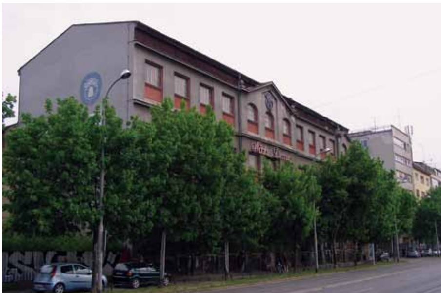
Tvornica »Penkala« (»Nada Dimić«) u Branimirovoj ulici, 2007. godine

»Penkala« factory (»Nada Dimić«), Branimirova, 2007