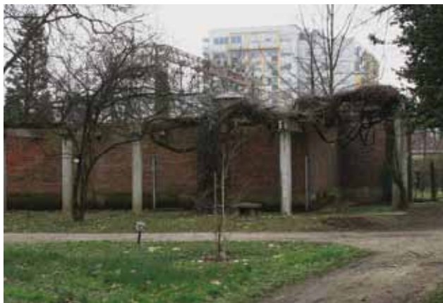
Vodosprema gradskog vodovoda na Lašćini, 2010. godine City waterworks reservoir, Lašćina, 2010