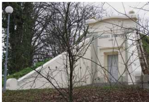
Vodospreme gradskog vodovoda na Jabukovcu, 2010. godine

Vodospremu je na Gornjemu Prekrižju 1903. godine projektirao i ostvario arhitekt Viktor Kovačić, kao i dvije vodospreme na Jabukovcu, od kojih je jedna ostvarena iste, 1903., a druga 1912. godine. Sve su danas u funkciji Gradskog vodovoda i odvodnje. 43