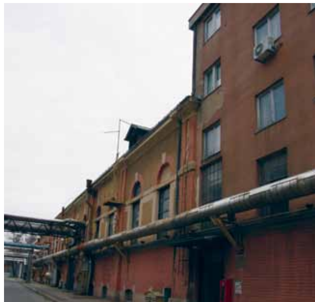
Južni zid zgrade negdašnje »Munjare« u Zagorskoj ulici, 2010. godine

Engine room (reservoir pump) of the »City Waterworks«, Zagorska, 2010