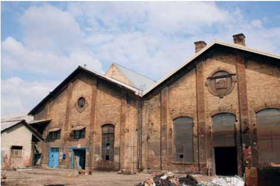
Južno pročelje dijela industrijskog sklopa »Gredelj« na Trnjanskoj cesti, 2012. godine (Fototeka GZZSKP-a)

Northern facade of the former workshop for manufacturing equipment for »Gredelj« railway cars on Trnjanska Street, 2012 (Photo archives of GZZSKP)