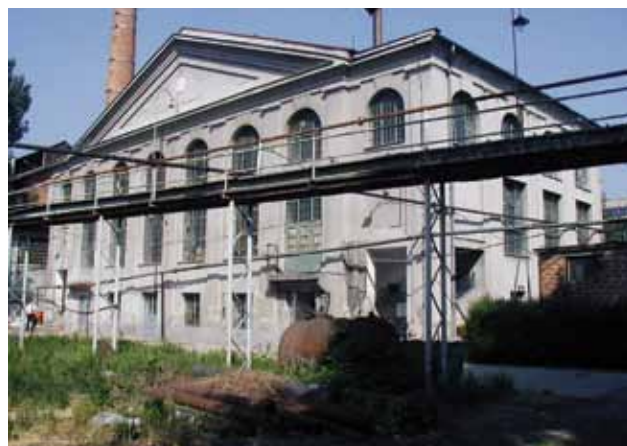
Zgrada kotlovnice i strojarnice negdašnje »Prve hrvatske tvornice ulja« u Branimirovoj ulici, 2006. godine

Ostala je gradnja zbog naknadnih preinaka, dogradnji i drugih intervencija, ostala bez spomeničkih obilježja i izvan konteksta zaštite. Konzervatorske su propozicije stoga usmjerene na očuvanje uz obnovu i sanaciju izvorne građevinske strukture i pročeljne opne, te mogućnost prenamjene ili rekonstrukcijskih zahvata i preinaka unutar postojećih gabarita radi prilagodbe za novu namjenu.