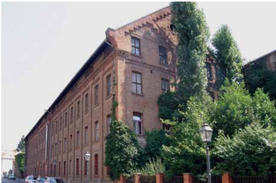
Pogled s jugozapada na sklop Gliptoteke HAZU u Medvedgradskoj ulici, 2007. godine Front page of the conservation study of the Sculpture Collection of the Croatian Academy of Arts and Sciences in Medvedgradska Street, 2007