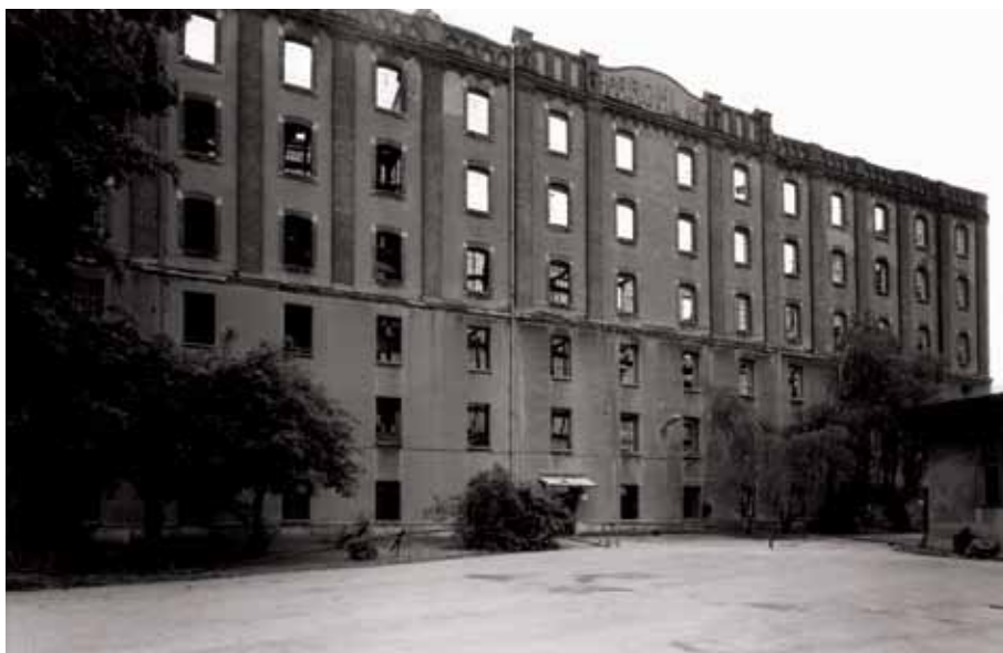
»Paromlin« u Koturaškoj ulici, 2000. godine

Main facade of »Paromlin« in Koturaška Street, 2003