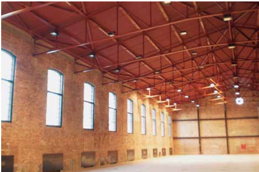
Interijer prenamijenjene zgrade bivše Konjaničke vojarne (hale »TKZ«) u Gradišćanskoj ulici, 2011. godine

Interior of the changed purpose building of the former Cavalry Barracks (»TKZ« halls) in Gradišćanska Street, 2011