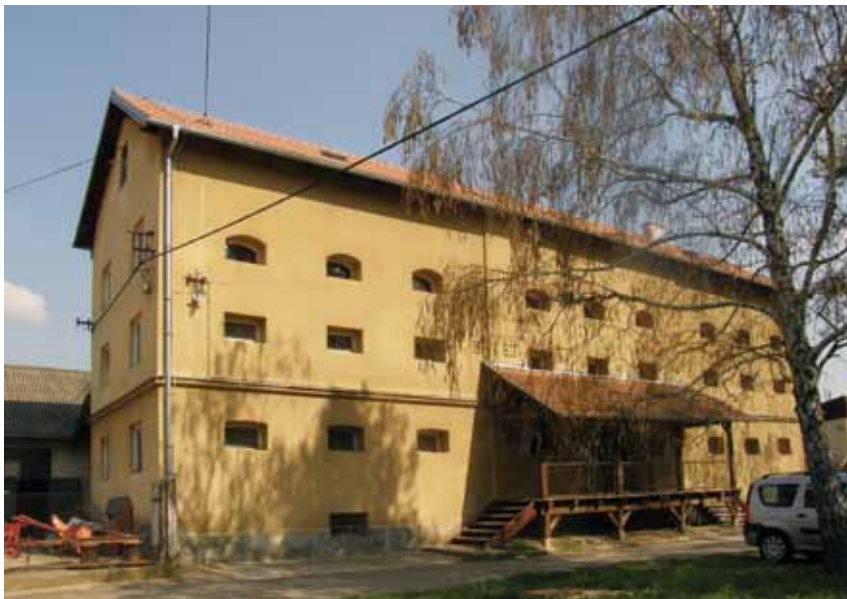
Prenamijenjena zgrada negdašnje Svilane u Maksimiru, 2010. godine (Fototeka GZZSKP-a) Changed purpose building of the former Svilana (silk-mill) in Maksimir, 2010 (Photo archives of GZZSKP)