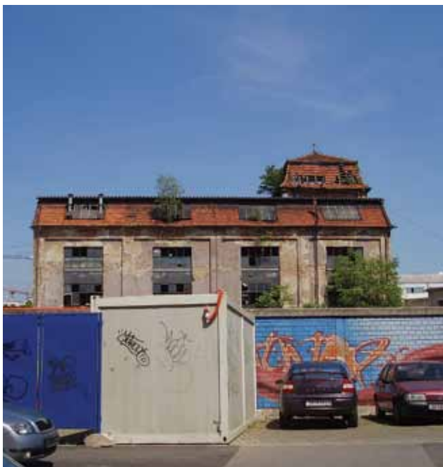
Pogled iz Derenčinove ulice na stari pogon tvornice »Badel« u Šubićevoje/Martićevoje/Derenčinovoje/Vlaškoje ulici, 2007. godine

View from Derenčinova towards the old » « factory plant in Šubićevoje/Martićevoje/Derenčinova/Vlaška, 2007