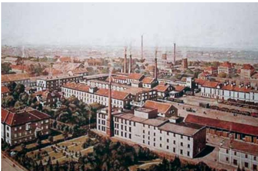
Tvornica »Franck« u Vodovodnoj ulici, 2010. godine