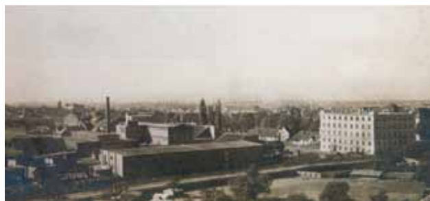
Zračnja snimka negdašnje tvornice »Bothe and Ehrmann« nakon izgradnje (Fototeka GZZSKP-a)

Zaštitne mjere predmetne građevine s obilježjem povijesne graditeljske strukture, koja arhitektonskim obilježjima i stupnjem očuvanosti ima znatan utjecaj na povijesnu fizionomiju i ambijentalnost predjela, odnose se na potrebu očuvanja zatečenih, te ponovnu uspostavu izvornih elemenata oblikovanja i volumena. Moguće zahvate u unutrašnjosti zgrade treba planirati radi prilagodbe suvremenim potrebama korištenja, a eventualnim dogradnjama treba izbjeći nepovoljan utjecaj na morfološke i oblikovne elemente građevine u cjelini. Uspostavljanjem kvalitetnih odnosa prema susjednim građevinama stvorit će se i primjeren prostorno - oblikovni odnos negdašnje tvorničke zgrade s neposrednom okolinom.