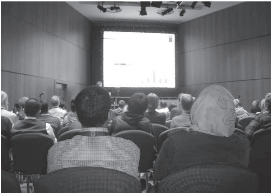
Slika 1: Detalj s izuzetno posjećene sekcije o jeguljama

U škotskom Edinburghu je od 7. do 11. svibnja 2012. održan 6. svjetski ribarski kongres. Uz dvoje sudionika iz Zavoda za ribarstvo, pčelarstvo, lovstvo i specijalnu zoologiju s Agronomskog fakulteta Sveučilišta u Zagrebu (Marina Piria i Tomislav Treer) na skupu je iz Hrvatske sudjelovala i četveročlana ekipa iz splitskog Instituta za oceanografiju i ribarstvo (Jakov Dulčić, Pero Tutman, Sanja Matić-Skoko i Josipa Ferri). Ovo je ključni ribarski znanstveni skup koji se održava svake četvrte godine, uvijek na drugom kontinentu, i na kojem redovito sudjeluje više od tisuću znanstvenika iz cijeloga svijeta (sl. 1). Koliku mu je važnost pridao i sam domaćin vidljivo je i iz činjenice da je kongres otvorio britanski prijestolonasljednik princ Charles.