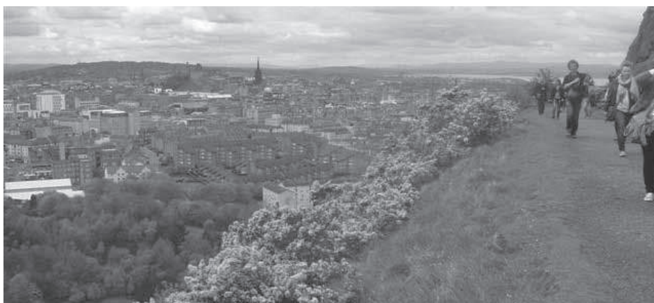
Slika 5: Pogled na Edinburgh sa šetnice po prastarom ugaslom vulkanu smještenom u samom gradu