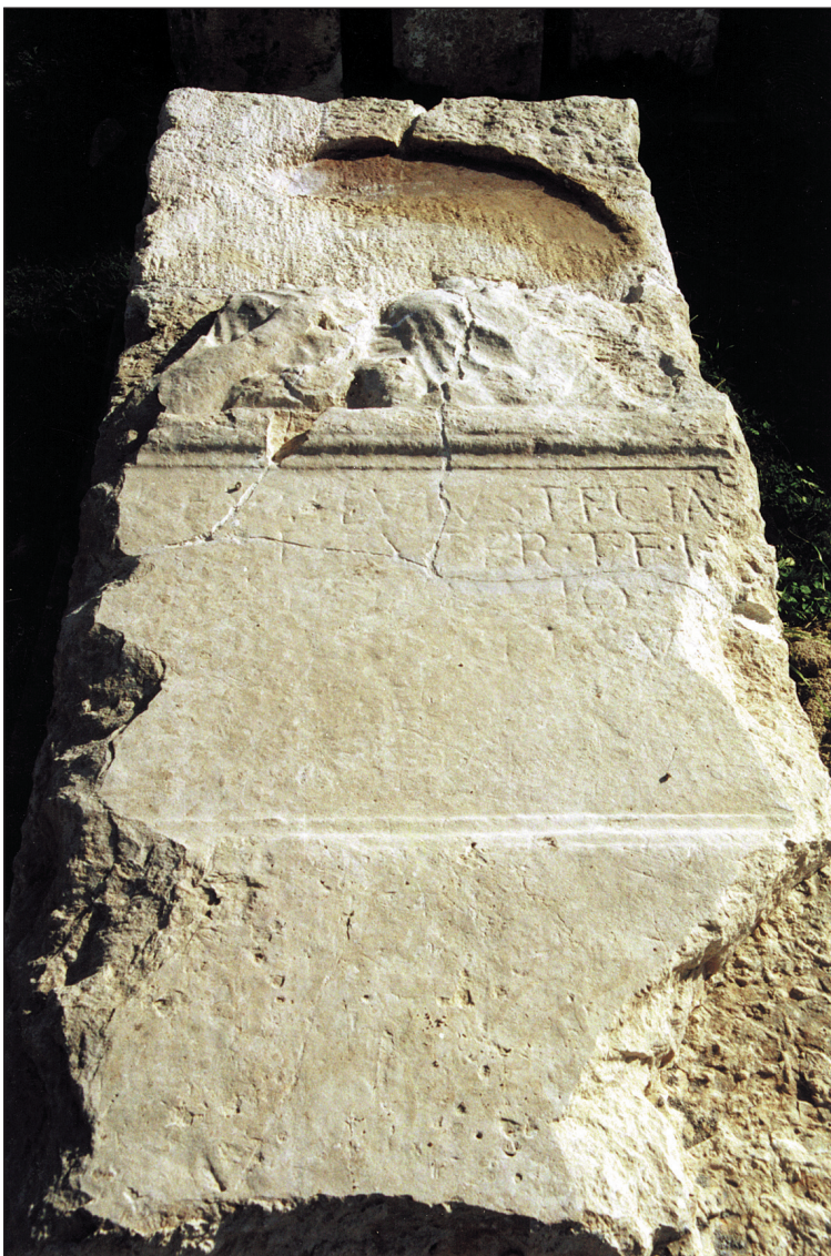
Sl. 1. Stela iz crkve Sv. Duha nakon djelomične rekonstrukcije

kako su pri sekundarnoj uporabi otučeni oni dijelovi koji se nisu uklapali u zamišljenju funkciju. Tako je otučen zub kojim se stela uglavljivala u postament, cijelom su dužinom otučene i obje bočne stranice, a zaravnan je i gornji završetak koji je stela očito morala imati. U smislu tehnike izvedbe, taj je zahvat ostavio tragove u vidu grubih udaraca zubatim i šiljastim dlijetom na bočnim stranicama, što je u kontrastu s izglaćanim dijelovima lica spomenika. Pojava iste tehnike i iznad portreta pokojnika, u gornjim uglovima ploče, daje naslutiti da je prerada dijelom zahvatila i gornji dio naličja spomenika.