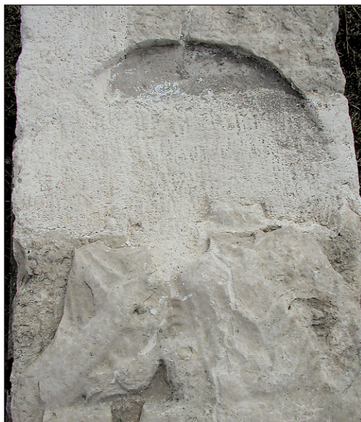
Sl. 2. Polukružna niša s portretima pokojnika na steli iz crkve Sv. Duha

Fig. 2. Stele from the church of the Holy Spirit: semicircular niche with portraits