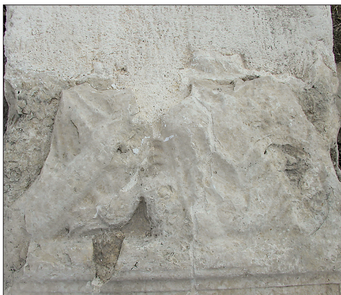
Sl. 4. Portreti pokojnika na steli iz Sv. Duha

Fig. 4. Stele from the church of the Holy Spirit: portraits of the deceased persons