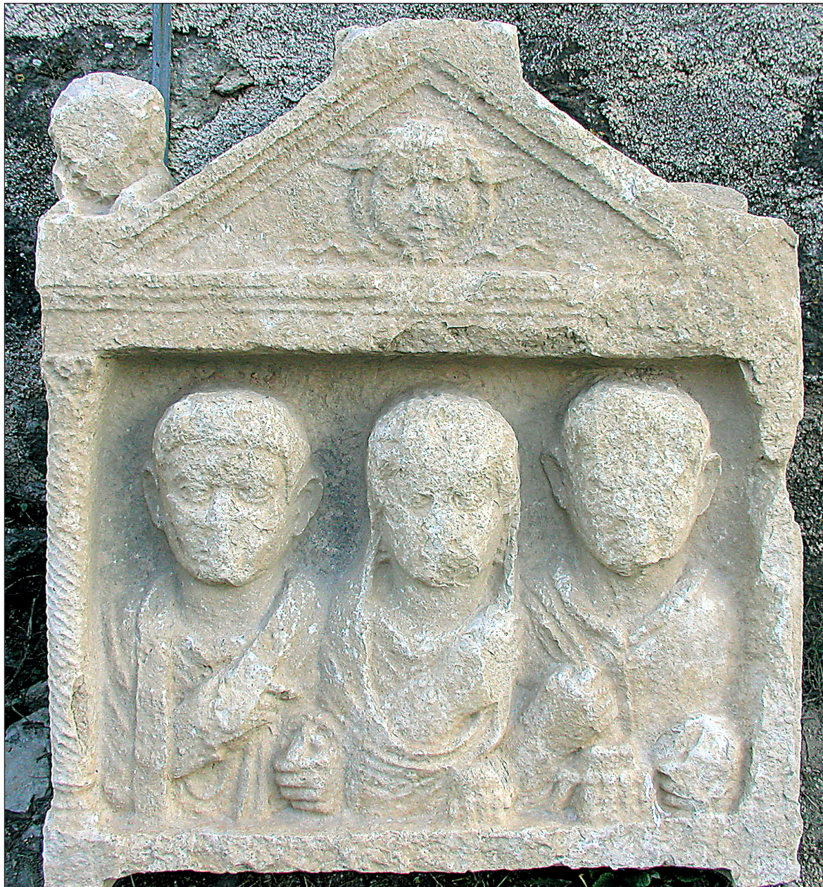
Sl. 5. Stela iz kasnoantičkoga fortifikacijskog zida

Fig. 5. Stele from the Late Roman fortification wall in the moment of its discovery