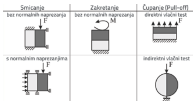
Slika 1. Utvrđivanje čvrstoće veze (prionljivosti) među slojevima [3]

Metodu direktnog ispitivanja na smicanje za određivanje čvrstoće veze između slojeva R. Leutner je predstavio 1979. godine [14]. Leutnerova metoda je jedna od najčešće