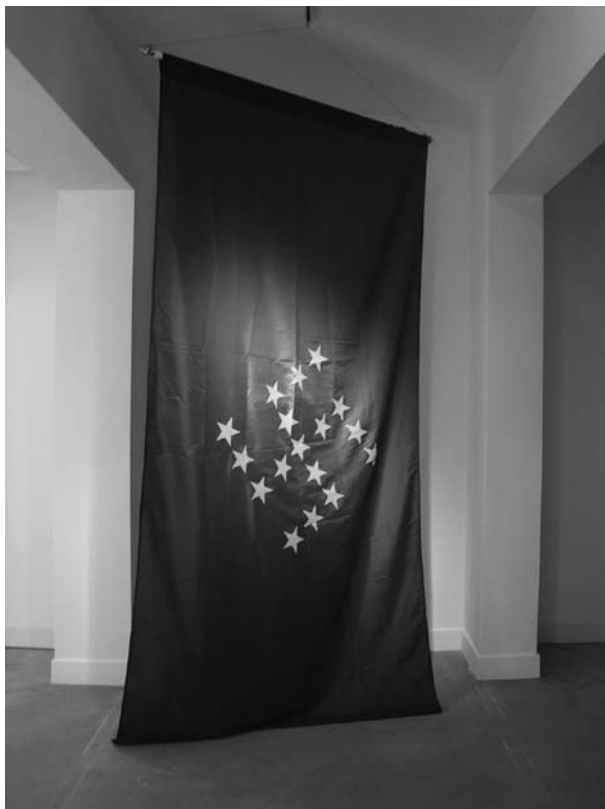
Slika 1. Nemanja Cvijanović: The Sweetest Dream (2005.)