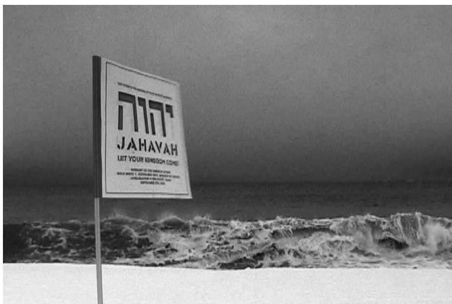
Slika 6. Tomislav i Marčelo Brajnović: Zastava (2009.)