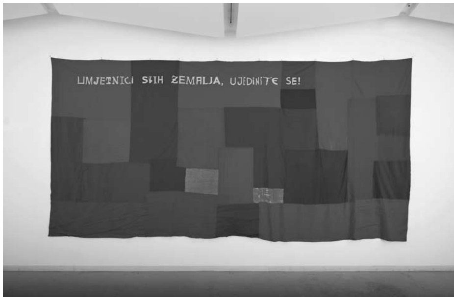
Slika 5. Robert Sošić: Crvena zastava (2010.)

Zastavu, tj. pozdravom Bogu svaka osoba stječe mogućnost preživljavanja velike nevolje....” (iz autorova e-maila).