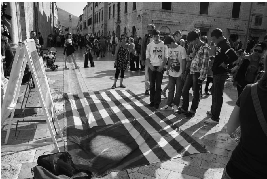
Slika 3. Božidar Jurjević: zastava iz performansa O-KRUŽENJE – Imperial – Hilton , Dubrovnik, Perforacije (2011.)