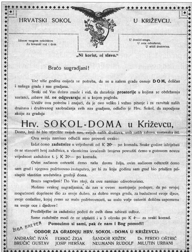
Slika 5: Poziv za kupnju zadužnica u korist fonda za izgradnju Doma (Hrvatskog doma)

Te godine je godišnja javna vježba održana na Petrovo, 29. lipnja, u Kiepatchovoj šumici, a kao gosti su bili sokolaši iz Koprivnice, Bjelovara i Vrbovca. Tijekom cijele godine članstvo je prisutno na svim svečanostima u gradu, a posjećuju i okolna sokolska društva (Bjelovar, Koprivnica, Vrbovec, Sv. Ivan Žabno, itd). Također, tijekom jeseni organiziraju izlete i javne vježbe koje su često popraćene i zabavama s plesom. Te je godine osnovan i ženski odjel Hrvatskog sokola.