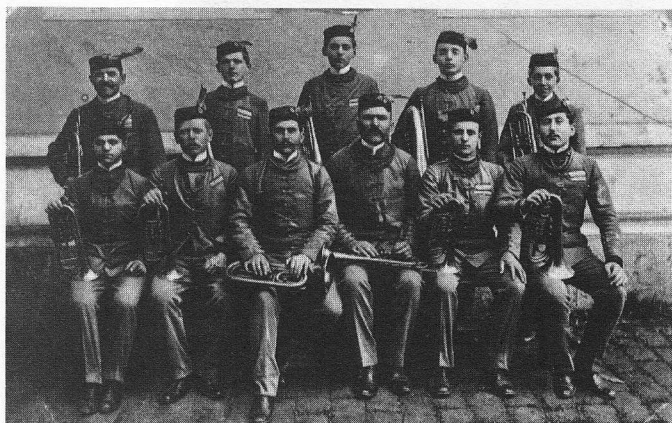
Slika 3: Razglednica Fanfara Hrvatskog sokola u Križevcu 1910

Tijekom godine članstvo se priprema i vježba za sudjelovanje i odlazak na svesokolski slet u Sofiju. Na sletu u Sofiji bilo je pet članova koji su na sletu sudjelovali u zajedničkoj vježbi. Za pribavljanje dijela sredstava za odlazak u Sofiju priređuju na Duhove svibanjsku svečanost u dvorištu Kraljevskog gospodarskog zavoda što im donosi 216 kruna prihoda. Od grada dobivaju potporu od 40 kruna, a od Župe Preradović 57 kruna.