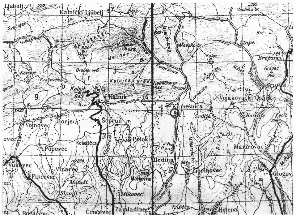
Sl. 1: Položaj Kamešnice, topografska karta u izvorniku Varaždin-Koprivnica, M 1:100 000 (izvadak)

Na kraju valja napomenuti da će ostaci ranije arhitekture u Kamešnici na neki način ostati vidljivi, jer će se kamenim oblucima, u razini zemlje, naznačiti polukružna apsida i južni temelj lađe starije crkve, kao svjedočanstvo o još jednom spomeniku romaničke arhitekture na našem području.