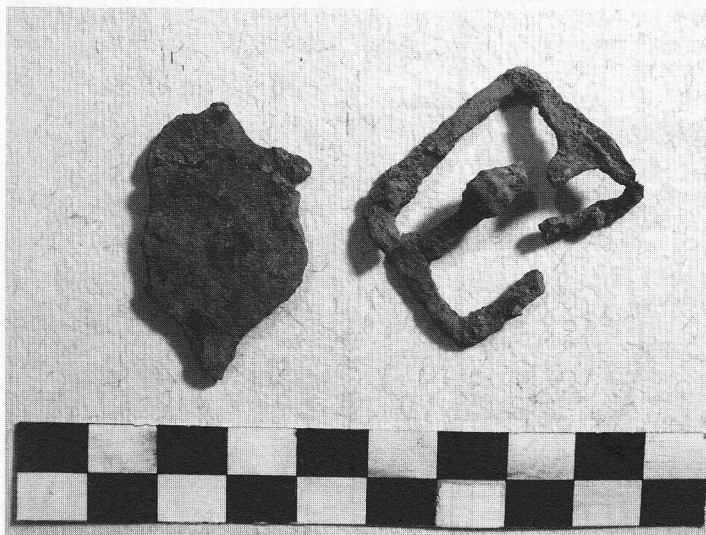
Sl. 4: Kamešnica, predica s trnom i dio okova iz groba 5 (prije restauracijsko-konzervatorskog zahvata)