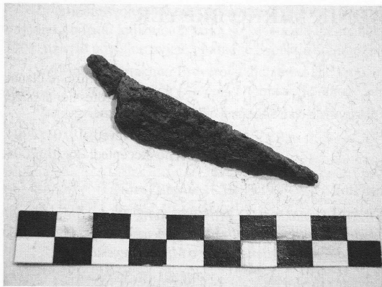
Sl. 5: Kamešnica, listolika strelica pronađena u grobu 6 (prije restauracijsko-konzervatorskog zahvata)