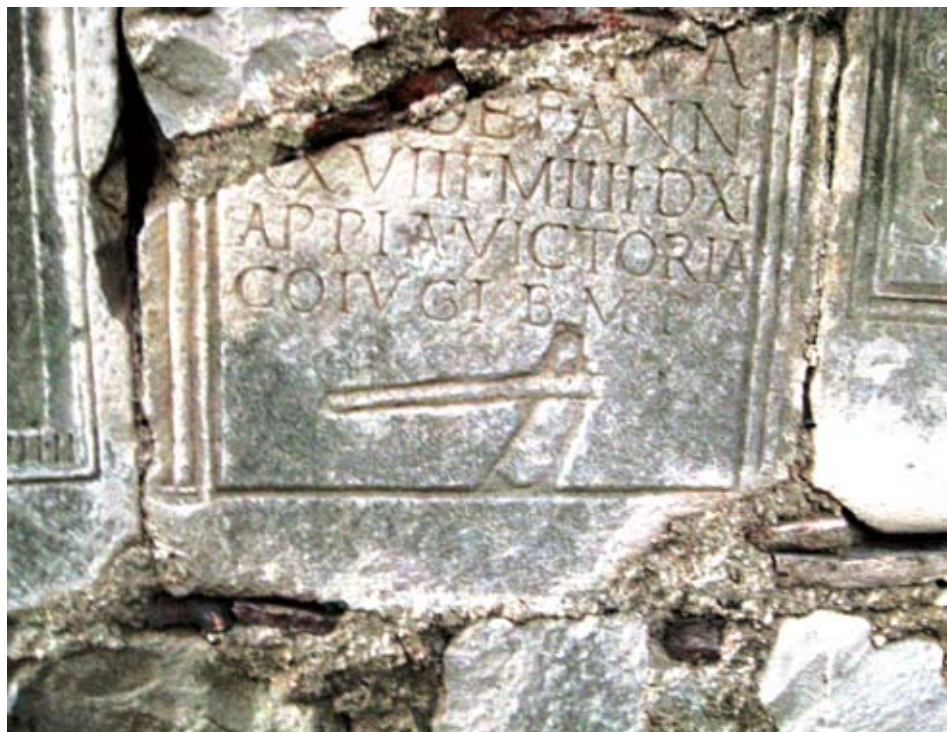
Fragment stele Sempronija Fortunata u zidu perivoja Garagnin-Fanfogna u Trogiru

nacrtao je I. Danilo, zajedno sa 34 druga antička spomenika iz Garagninove zbirke. 9 Na Fortunatovoj steli (označenoj brojem XXI kod Danila) već je tada zabilježena crta loma koja je podijelila spomenik na tri nejednaka dijela. Međutim, usporedbom sa sačuvanim dijelom spomenika, Danilo nije točno nacrtao vodoravni lom. Mommsen također bilježi oštećenje, no njegova naznaka loma na tom mjestu znatno je bliža stvarnom stanju. Poredbenom analizom i drugih nacrtanih spomenika s očuvanima, lako se uočavaju Danilovi propusti. To su zanemarivanje detalja dekoracije, nemarni prijepisi, visina i razmak između redaka te veličina slova koji često ne odgovaraju stanju na spomeniku 10 pa je opravdana sumnja u njegov prikaz prijeloma i na ovoj steli.