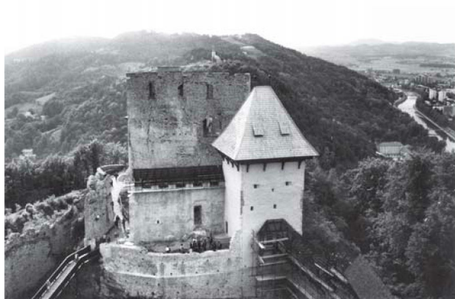
Sl. 1. Celjski grad, pogled s Friedrichove kule na Pelikanovu kulu i palas, stanje 1998.