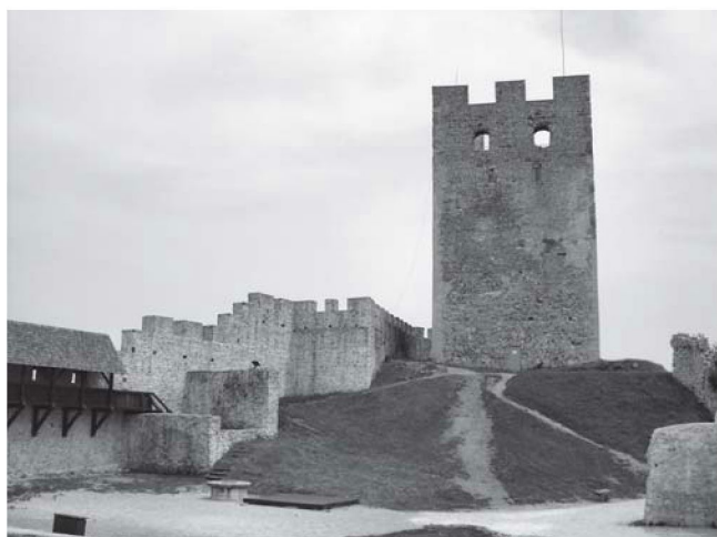
Sl. 2. Friedrichova kula, stanje 2006.