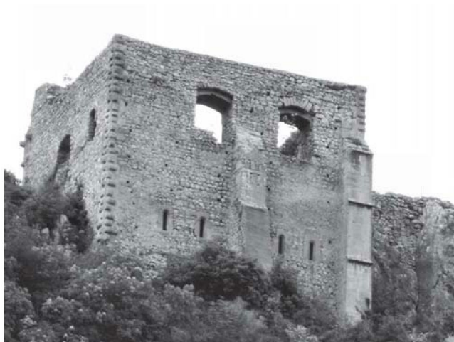
Sl. 5. Velika kula.